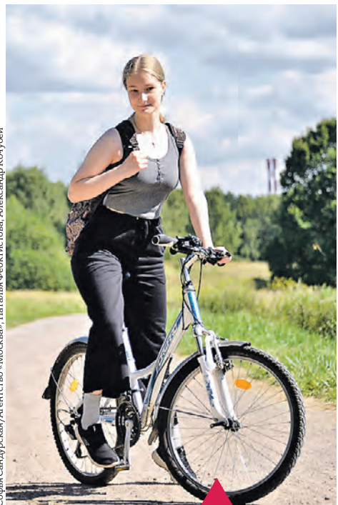
Максим Блинов/РИА НОВОСТИ, Агентство «Москва», Мобильный репортаж/Агентство «Москва», Софья Сандурская/Агентство «Москва», Наталья Феоктистова, Александр Кочубей