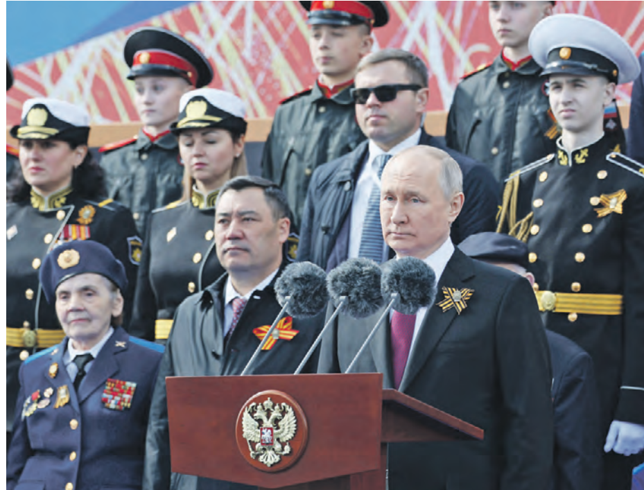
09 мая 2023 года. Президент Киргизии Садыр Жапаров (нижний ряд в центре) рядом с президентом России Владимиром Путиным во время торжественной речи

Парад Победы в этом году прошел без авиации, но с союзниками