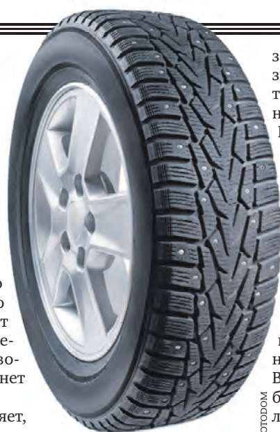
Для переобувки колес надо использовать один и тот же тип резины