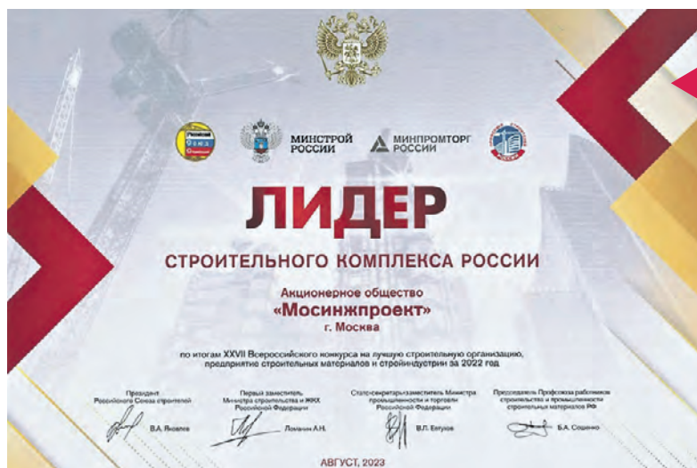
По итогам Всероссийского конкурса на лучшую строительную организацию, предприятие строительных материалов и стройиндустрии холдинг признан одним из лидеров национальной строительной отрасли

Нацпремия «Формула движения» призвана содействовать развитию транспортной инфраструктуры, повышению уровня транспортных услуг, а также стимулированию государственных и коммерческих структур к решению значимых проблем транспортной сферы