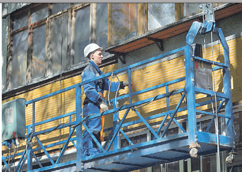
Специалисты Мосгосэкспертизы тщательно проверяют проектную документацию по капитальному ремонту жилых домов столицы

безопасности и надежности, но и корректность составления сметы. Каждый проект капитального ремонта разрабатывается индивидуально: учитывается состояние дома и степень пригодности инженерных систем. Так,