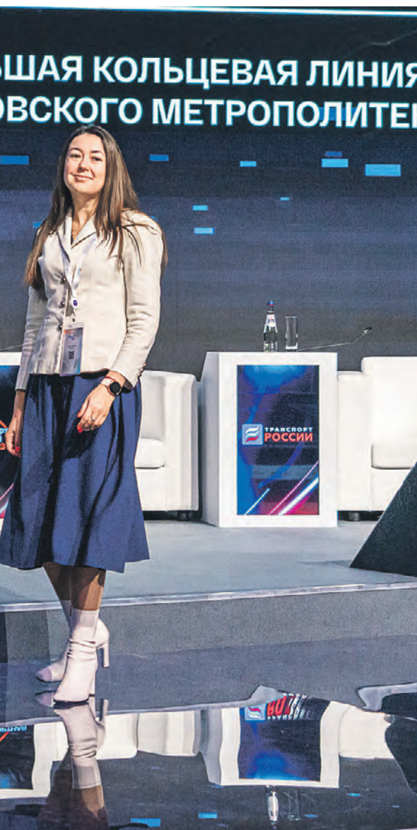
Популярная у профессионального сообщества Национальная премия «Формула движения» учреждена в 2014 году Министерством транспорта Российской Федерации. Премия вручена коллективу инженерингового холдинга «Мосинжпроект»