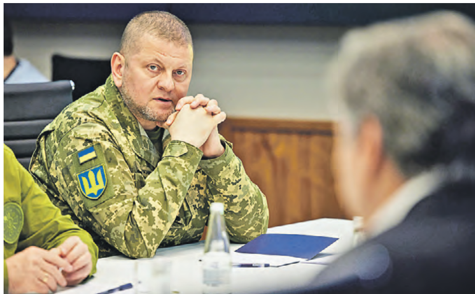
24 апреля 2022 года. Валерий Залужный во время очередной встречи президента Украины с государственными служащими Америки

Украинским чиновникам запретили общаться с главкомом ВСУ