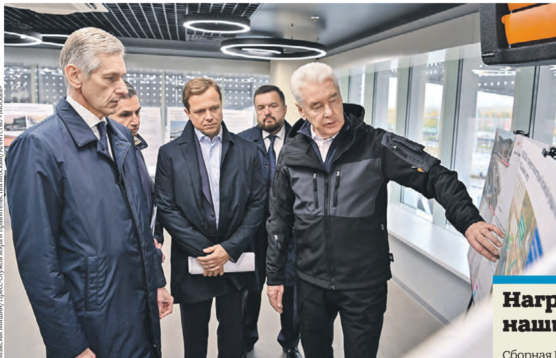
20 октября. Мэр Москвы Сергей Собянин (справа) осмотрел строящийся городской вокзал «Царицыно»