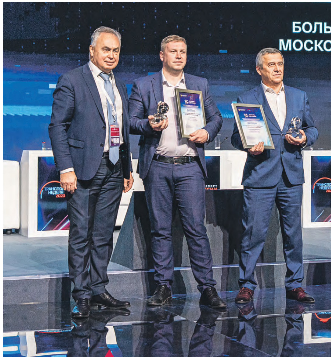
16 ноября. Проект Большой кольцевой линии (БКЛ) метро стал победителем в номинации «Лучший инфраструктурный проект регионального значения» X Национальной премии «Формула движения». Церемония объявления победителей премии прошла в рамках деловой программы Транспортной недели в Гостином Дворе

объекты, как театры «Геликон-опера» и «Табакерка», Большая спортивная арена и построенные Дворец гимнастики и Аквакомплекс в «Лужниках», «Парк легенд» на ЗИЛе и парк развлечений «Остров мечты», парк «Зарядье» и уникальный одноименный концертный зал, стали новыми визитными карточками Москвы.