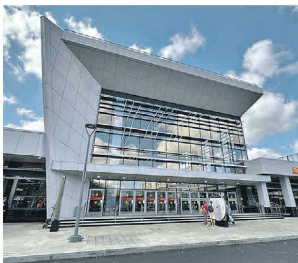
Вокзал «Зеленоград-Крюково» третьего маршрута центральных диаметров «Ленинградско-Казанский»

В Москве работают 79 вокзалов наземного метро, соответствующих новому стандарту и обеспечивающих быструю и комфортную пересадку пассажиров между разными видами транспорта. Сергей Собянин подчеркнул: современные вокзалы приходят на смену привычным пригородным платформам и обслуживают Московское центральное кольцо и четыре диаметра.