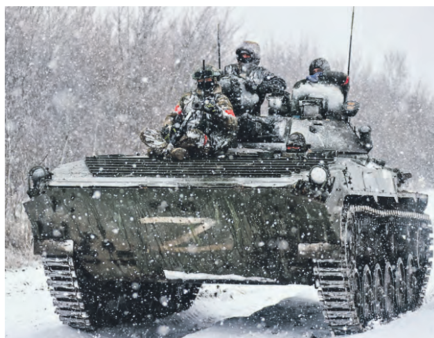
14 февраля. БМП-2 во время боевой работы танкового подразделения России на южном направлении СВО

или три атаки штурмовых групп 24-й механизированной, 77-й аэромобильной и 5-й штурмовой бригад ВСУ в районах населенных пунктов Шумы, Артемовское и Клещеевка, отметили в ведомстве. Как уточнили в Минобороны, противник потерял до 250 военнослужащих, пять танков, 12 автомобилей, самоходную артиллерийскую установку М109 Paladin и артиллерий-