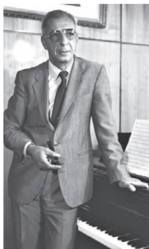
Конец 1970-х годов. Композитор Микаэл Таривердиев у рояля

...Он написал более ста песен и романсов, его музыка звучит в 130 с лишним фильмах, он — автор многочисленных камерных и концертных произведений, це-