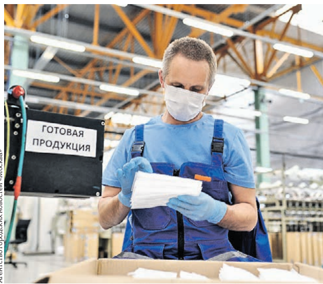
На предприятиях технополиса «Москва» производят маски с соблюдением всех существующих нормативов