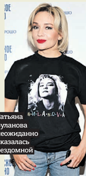
Татьяна Буланова неожиданно оказалась бездомной

Вчера звезды нашего шоу-бизнеса, которые собрались избираться в Госдуму этой осенью, раскрыли свои официальные источники доходов и сколько удалось заработать денег за 2020 год. Оказалось, в шоу-бизнесе кризис. Мало того что у некоторых заработок упал до 25 тысяч рублей в месяц, так еще и нет жилья с. 11