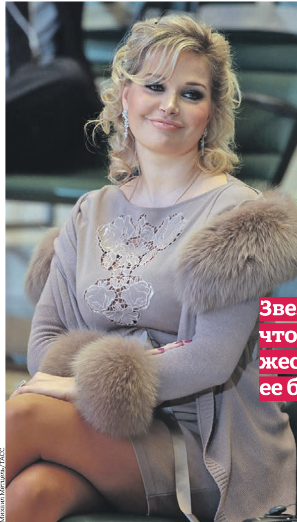
Мария Максакова не ожидала, что ее любимые дети будут пытаться забрать у нее квартиру