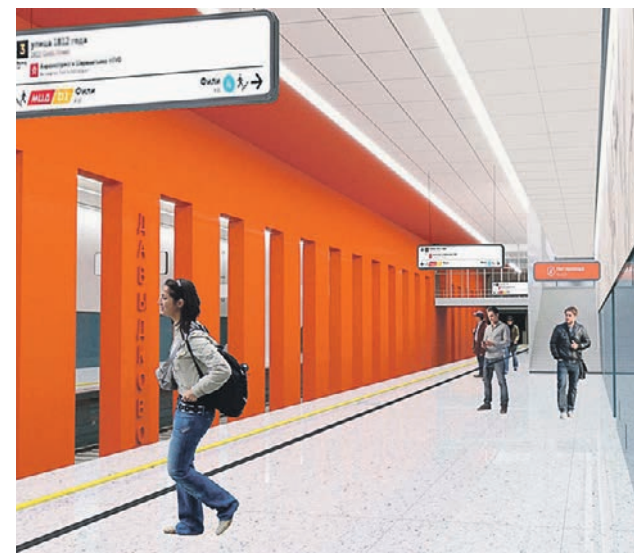
Визуализация строящейся станции Московского метрополитена «Давыдково»