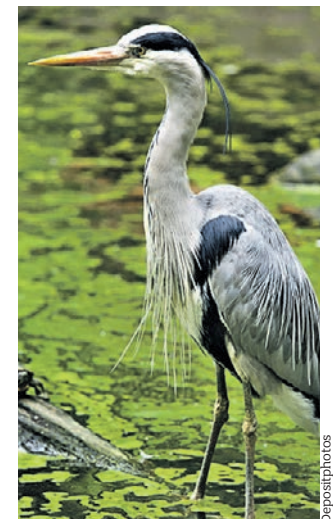
Одна из обитательниц Верхнего Знаменского пруда — серая цапля

Как выяснилось, больше всего редких птиц живет в окрестностях Верхнего Знаменского или Мельничного пруда, расположенного в южной части заповедной территории. Среди прочих здесь в последнее время встречались широконоска, серая цапля, два вида чирков, трескунок и свистунок, чибис, черныш, камышица, перевозчик, речная крачка, а также чайки, сизая