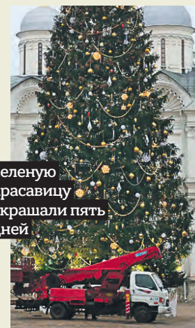
Зеленую красавицу украшали пять дней

Сегодня на Соборной площади около Московского Кремля зажглась главная елка страны, которую привезли из подмосковного Щелкова. В присутствии журналистов дерево украсили последними игрушками. Радовать жителей и гостей города зеленая красавица будет все три праздничные недели.