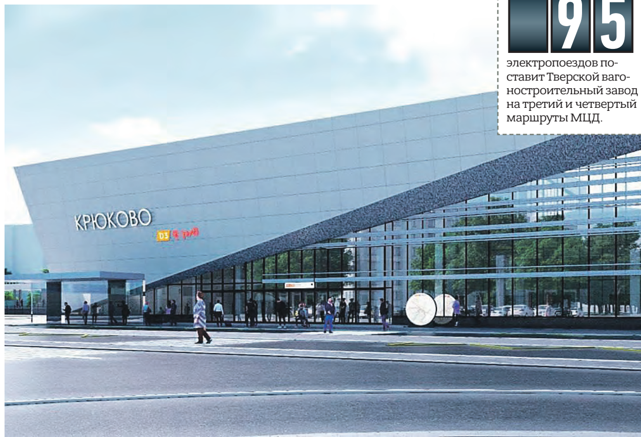
Проект пассажирского терминала станции Крюково

До Зеленограда можно будет добраться в несколько раз быстрее