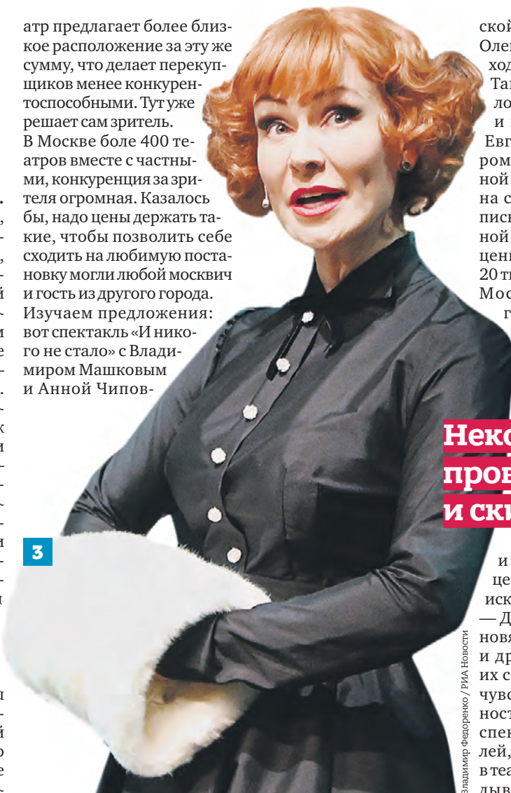
Владимир Федоренко / РИА Новости