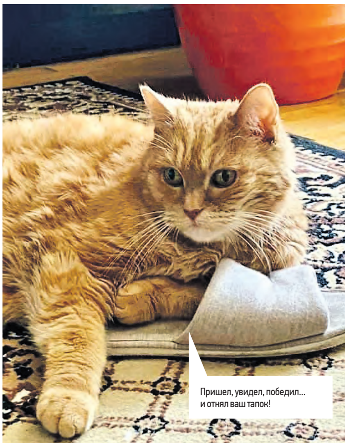
Пришел, увидел, победил... и отнял ваш тапок!