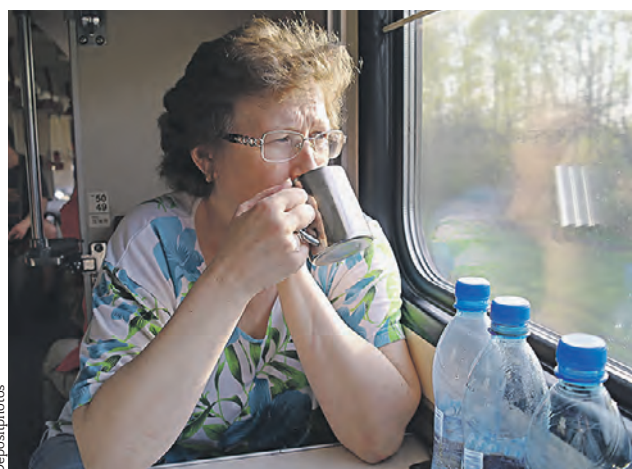
Проводники будут контролировать соблюдение новых правил в поездах дальнего следования