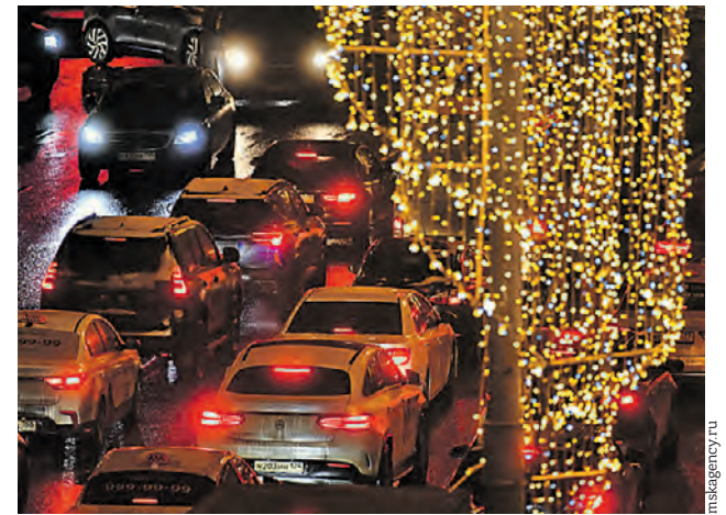
В прошлом году Москва также не обошлась без предновогодних вечерних пробок на дорогах