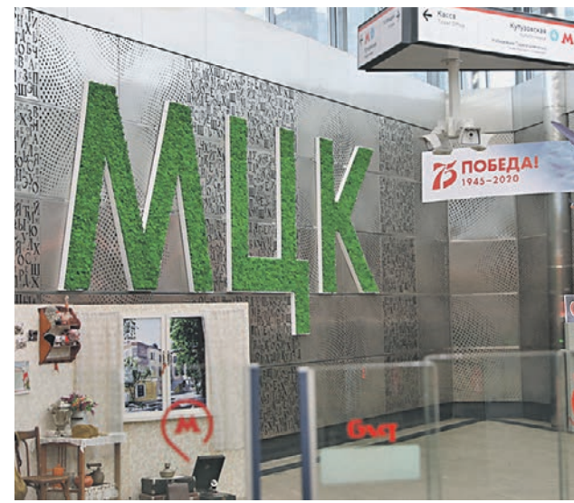
Фитопанно на станции МЦК Кутузовская, сделанное из стабилизированного мха