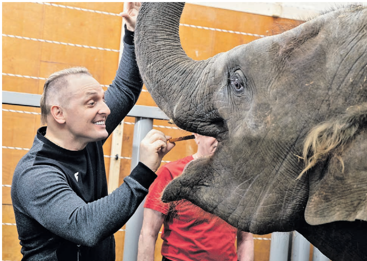
23 июня 2020 года. Художественный руководитель Большого Московского цирка Аскольд Запашный кормит слониху Эколь в процессе дрессировки

— Эколь еще ребенок, но слонята взрослеют быстро, — рассказал он «Вечерке». — Она радует меня каждый день. За две репетиции научилась делать апортировку: приносить палочку, отдавать в руки. Это не каждая собака понимает быстро, а Эколь смекнула и делает это с удовольствием. Она крупная, видимо, это гены — отец Эколь невероятно большой. Это хорошо, как и то, что она не паникерша. Как любой ребенок, малышка изучает все с интересом. Состорожностью относится к новому,