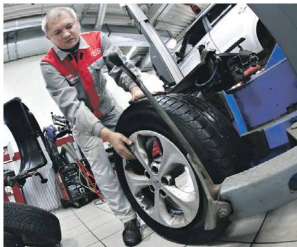
26 октября 2018 года. Сотрудник автосервиса на Крылатской улице занят заменой летних шин