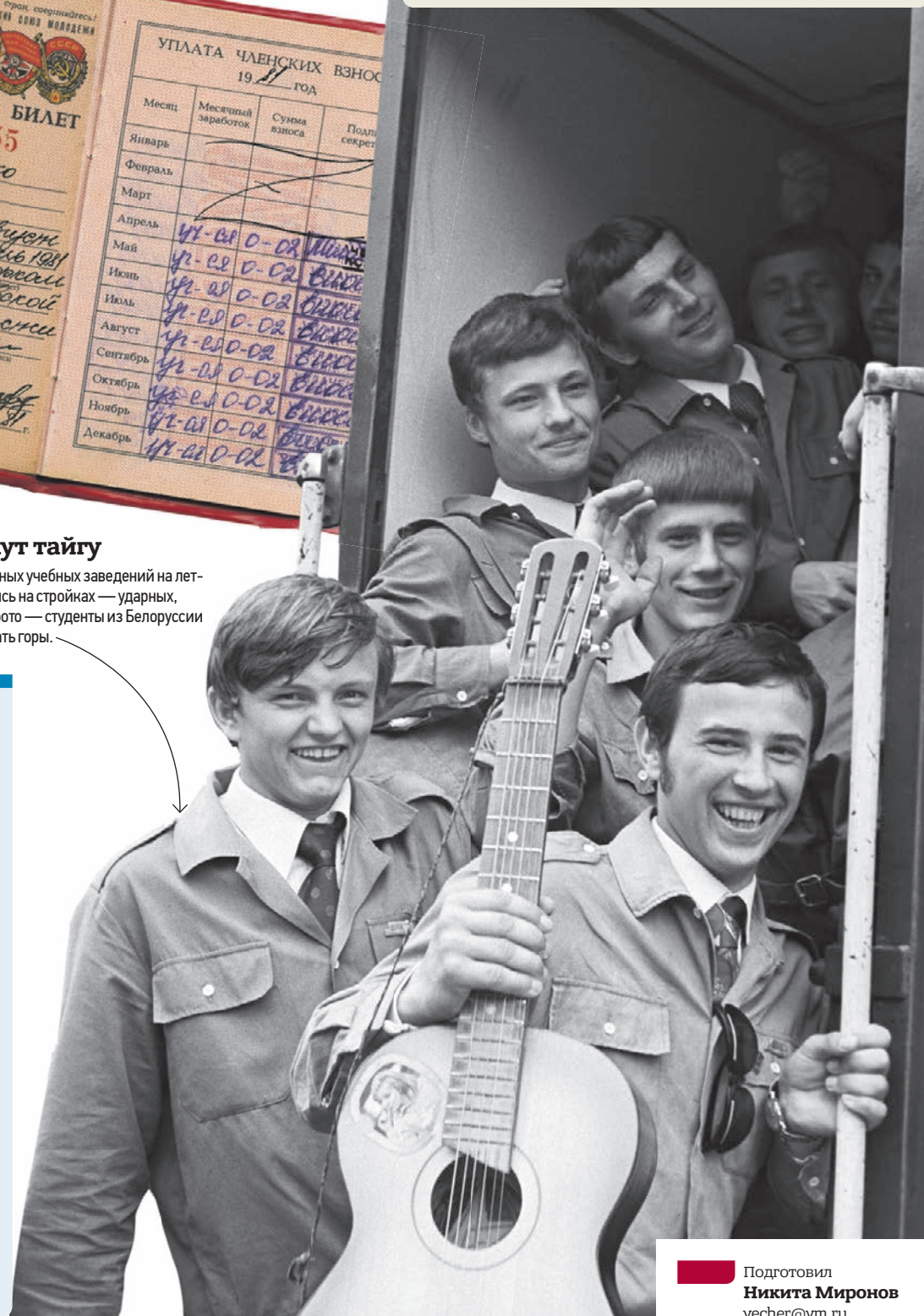
Евгений Коктыш/РИА Новости, Сергей Соловьев/РИА Новости, Иван Шапкин/РИА Новости