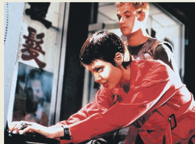
Кадр из фильма «Хакеры» (1995). Его герои — компьютерные преступники

Однако самые опасные хакеры остаются неизвестными: в 2012 году группировка Anonymous совершила атаку на ведомство США, в том числе Белый дом, звукозаписывающие и кинокомпании. Поводом для нападения стало закрытие сайта MegaUpload, на котором размещались пиратские копии медиапродукции. Ущерб от атак киберпреступников был оценен в 3 миллиарда долларов.