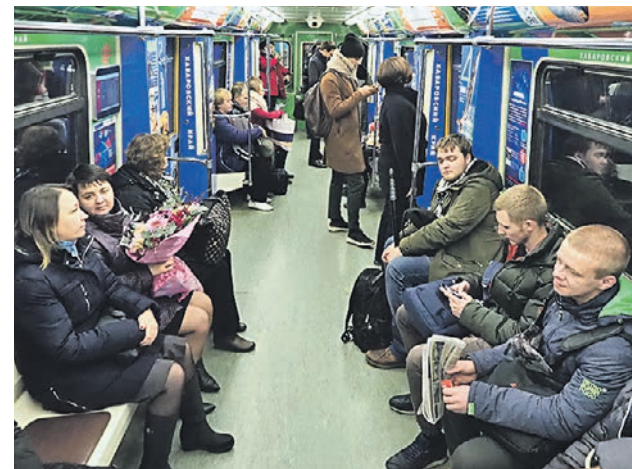
9 ноября 2018 года. Тематический поезд «Дальневосточный экспресс»