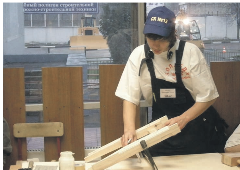
Подготовка кадров для отрасли — еще одна забота профсоюза: учащиеся строительного колледжа № 12 на конкурсе «Московские мастера» WorldSkills Russia борются за звание лучшего столяра

Кстати, в ДСК-1 довольно сильный профком был всегда. Может, потому, что комбинату уже скоро 60 лет, а может, потому, что коллектив там особый. Больше 5 тысяч человек работают слаженно, как часы, все руководители растут на глазах