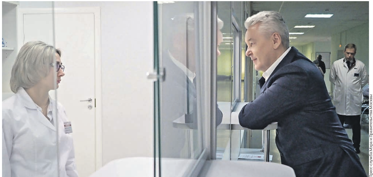
20 ноября 2018 года. Мэр Москвы Сергей Собянин во время посещения диагностического центра № 5 на Abramtsevskaia ulitsy общается с сотрудницей аптечного пункта

■ Вчера мэр Москвы Сергей Собянин посетил диагностический центр № 5 на улице Абрамцевской.