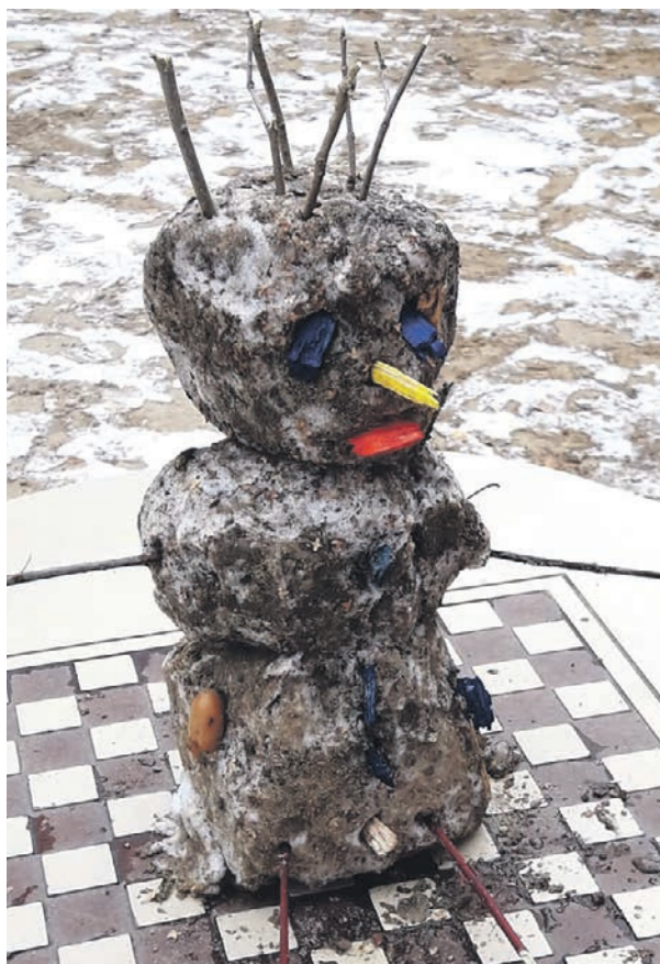
Москва, Бирюлево, дендрарий. Вот он, Грязевичок!

...Когда зима придет, слепите в память о грязевичке снеговика настоящего — белого. Тем более вы так давно не делали этого! С тех пор, как выросли и забыли, как просто иногда стать неожиданно счастливым.