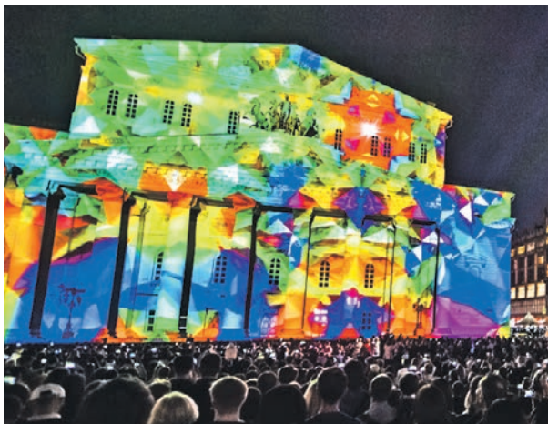
21 сентября 2018 года. Площадка фестиваля «Круг света» на Театральной площади