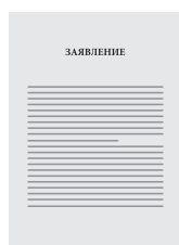
Заявление установленного образца