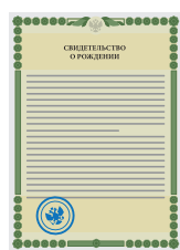
Свидетельства о рождении детей

Сертификат оформляется отделением Пенсионного фонда Российской Федерации по месту жительства, а также в центрах госуслуг. Для этого необходимы следующие документы: