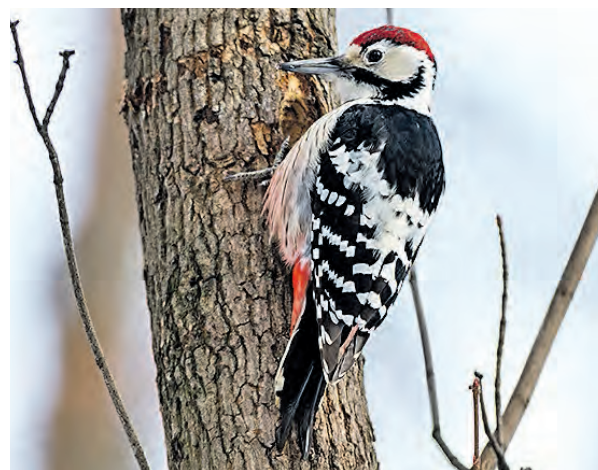
Экологи отмечают странности в поведении дятлов, обитающих в столичных парках