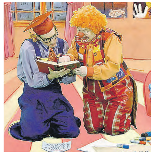
► Кадр из телепередачи «АБВГДейка». Персонажи программы Гоша Пяттеркин (слева) и Клепа читают книгу