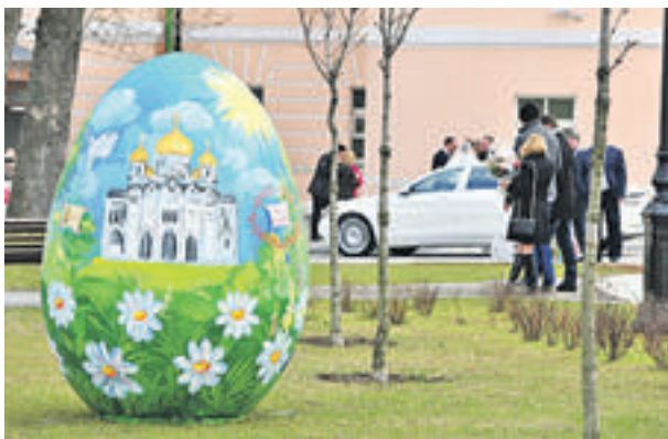
▶ 22 апреля, 14:30. Сейчас в парке разместились выставка гигантских расписных пасхальных яиц

Сейчас в парке разместились выставка гигантских пасхальных яиц. Комплекс зданий на Страстном бульваре — это