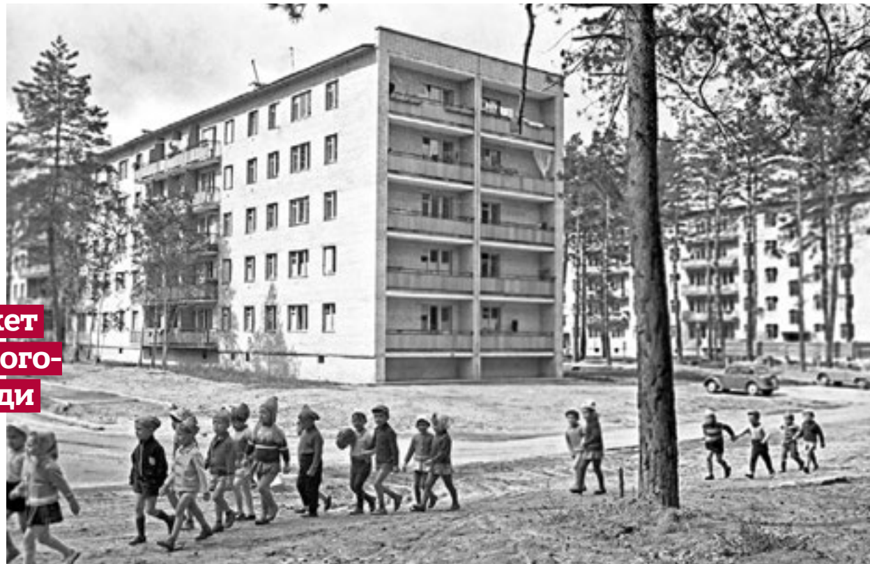
► 1969 год. Когда-то получить квартиру в пятиэтажке было для семьи большим счастьем

Голосование по реновации жилья будет электронным и очным