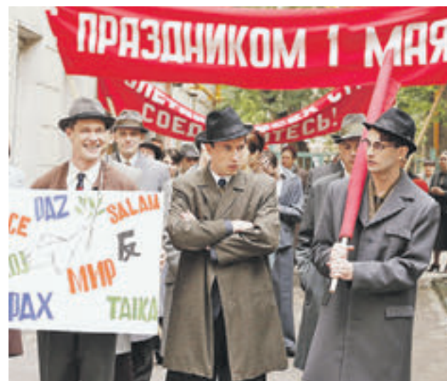
► Отдел Информационно-аналитической группы вышел на демонстрацию 1 мая 1960 года

Итак, 1960-й. Смоленская площадь столицы, неприступный МИД-высотка. Тут работает уникальный отдел — Информационно-аналитическая группа, ИАГ. Ее сотрудники — недавние выпускники МГИМО (тогда — МИМО), и задача этих молодых спецов — находить нетривиальные подходы к решению всех проблем, что возникают во внешней политике СССР. Для Андрея Муратова, Лени Корнеева и Аркадия Голуба дипломатия — страсть и ежедневная тренировка мозга: им нужно обыграть соперников, причем сделать это красиво.