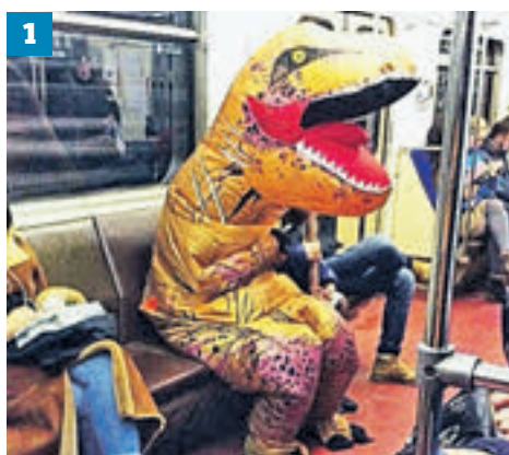
1 ► Динозавр — пассажир вдумчивый (1) Кот и пес, наоборот, готовы веселить всех, кто оказался рядом (2) А к женщине-кошке просто так и не подойдешь (3)