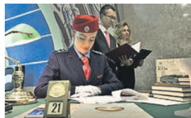
► Московский метрополитен впервые принял участие в акции «Библионочь», которая прошла 21 апреля