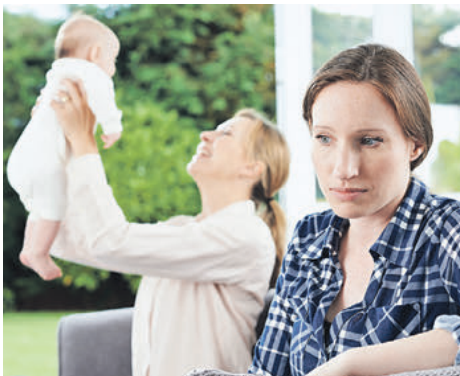
▶ Налог на бездетных людей может вызвать непонимание в обществе и появление лишних бюрократических аппаратов