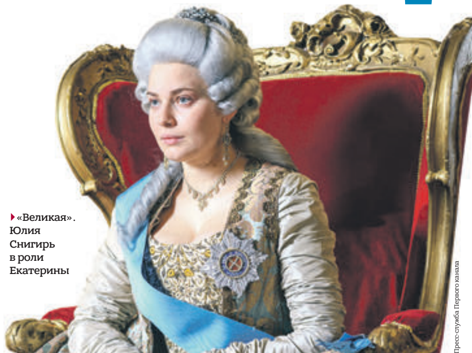
► «Великая». Юлия Снегирь в роли Екатерины