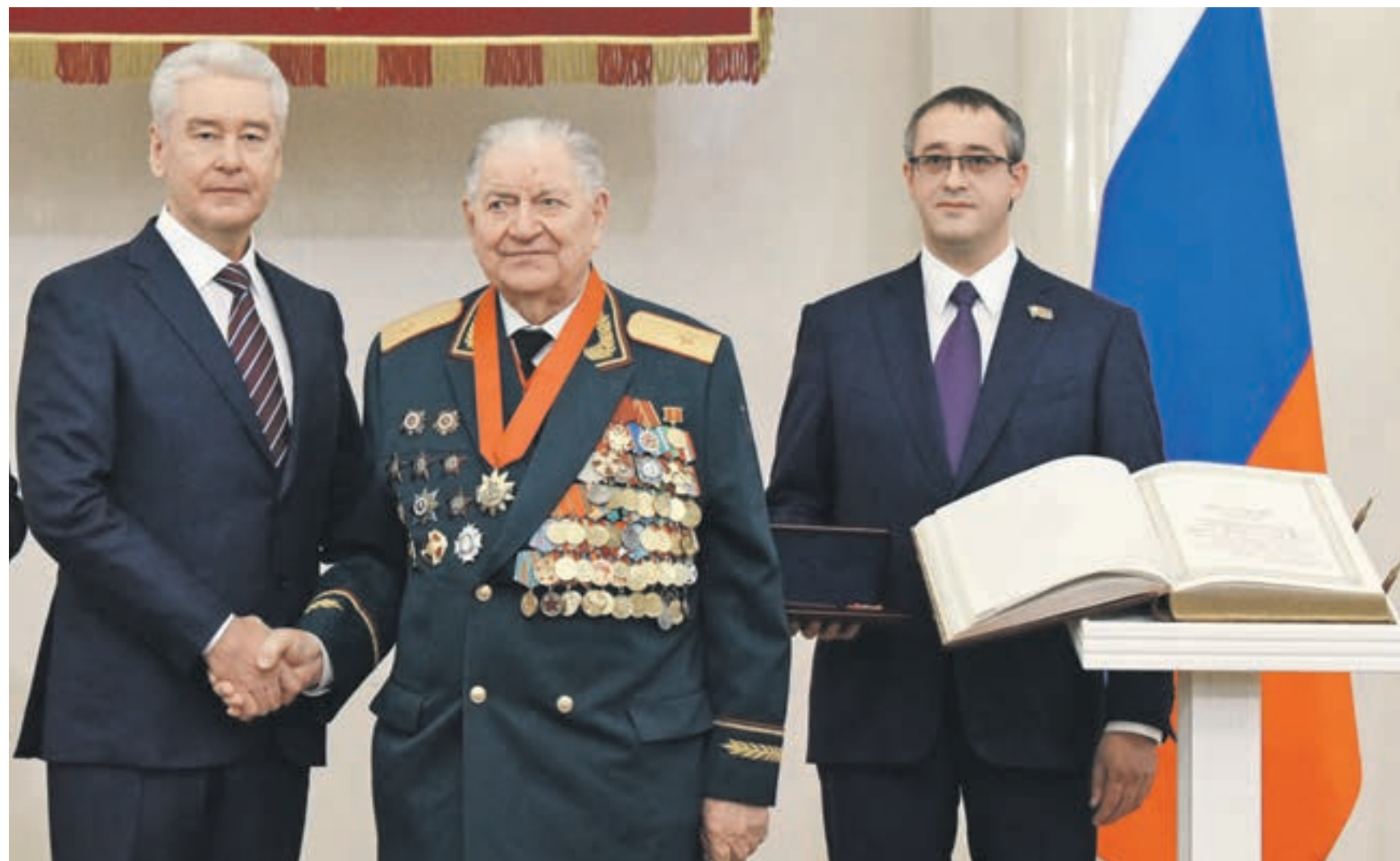
2 декабря 2016 года. 14:03 Мэр столицы Сергей Собянин (слева) и председатель Московской городской думы Алексей Шапошников (справа) поздравляют Ивана Андреевича Слухай (в центре) с присвоением ему звания «Почетный гражданин города Москвы»