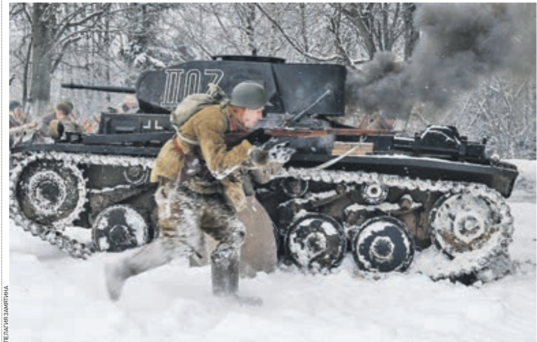
3 декабря 2016 года 12:50 Яхрома. Историческая реконструкция битвы на Перемилловской высоте. Красноармеец бежит в атаку. Рядом польхает подбитый вражеский танк