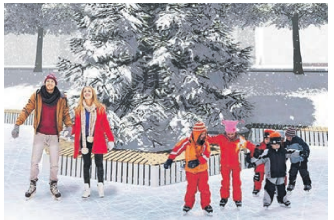
Проект обустройства катка на Патриарших прудах. Елка будет установлена на специальном подиуме