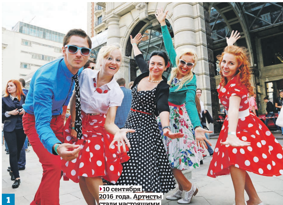
10 сентября 2016 года. Артисты стали настоящими