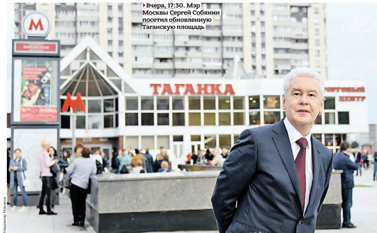
► Вчера, 17:30. Мэр Москвы Сергей Собянин посетил обновленную Таганскую площадь

Еще до начала реализации проекта по обновлению площади у станции метро «Марксистская» архитекторы предлагали отдать пространство пешеходам и общественному транспорту, обустроить тротуары и скверы. Идею воплотили, и теперь на выходе из подземки горожане видят просторную площадь, вымощенную светлой серой плиткой. Пешеходную зону увеличили за счет сокращения проезжей части, а подземный переход у метро реконструировали. На опорах заменили светильники, установив энергоэффективные образцы. Подсветили и пешеходную зону. А между плитками сделали «зеленые островки» — наличие газона еще напомнит москвичам о лете. Но главное, что площадь еще в начале года освободили от безобразных ларьков с шаурмой и ширпотребом.