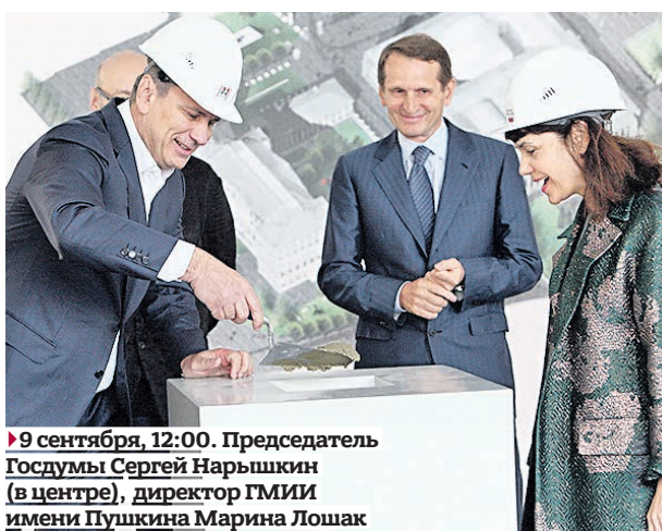
► 9 сентября, 12:00. Председатель Госдумы Сергей Нарышкин (в центре), директор ГМИИ имени Пушкина Марина Лошак и представитель подрядчика закладывают камень в основание Музейного городка

После реконструкции главного здания музея и строительства депозитарно-реставрационного и выставочного центра площадь комплекса вырастет до 105 тысячи квадратов. — Мы ориентированы на максимальное сохранение