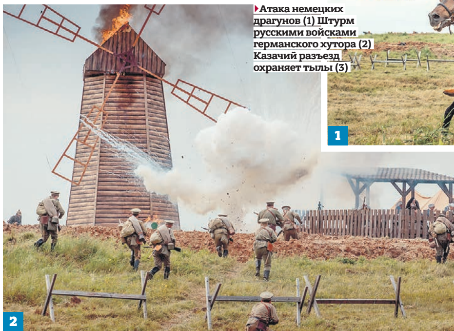
► Атака немецких драгун (1) Штурм русскими войсками германского хутора (2) Казачий разъезд охраняет тылы (3)