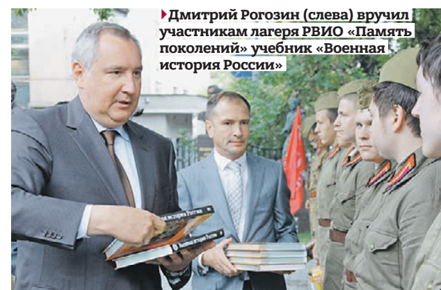
► Дмитрий Rogozin (слева) вручил участникам лагеря РВИО «Память поколений» учебник «Военная история России»