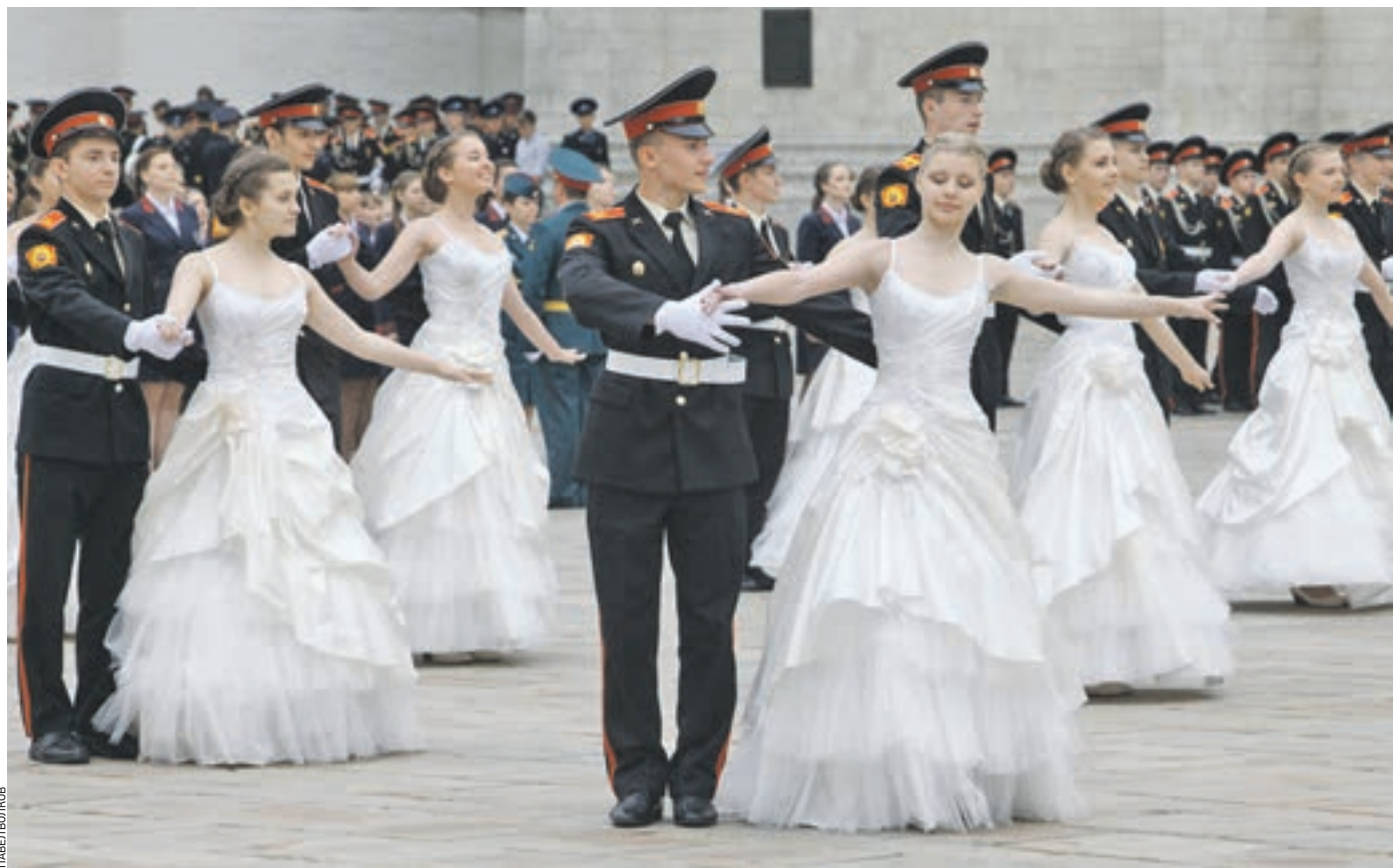
20 июня 11:15 После получения аттестатов выпускники московских военных училищ танцевали на Соборной площади Кремля полонез

— Около 95 процентов наших воспитанников решили посвятить себя военному будущему. Мы делали все, чтобы воспитывать гармонично развитых людей — хорошо образованных, хорошо воспитанных, патриотично настроенных.