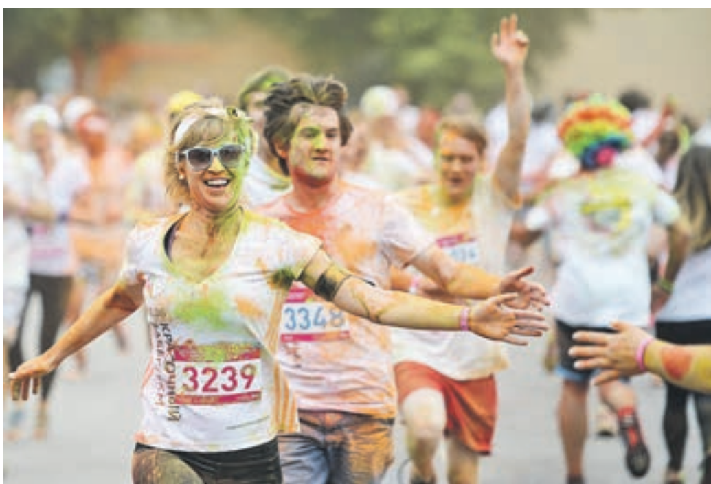
21 июня 11:29 Бегунов третьего этапа подготовки к Московскому марафону на финишной черте встретил красочный салют

20 июня 01:04 У каждого из выпускников, прощавшихся со школой в Парке Горького, была возможность почувствовать себя настоящей звездой, пройдя по красной дорожке. Начинаясь она прямо от главных ворот парка. Поэтому девушки и юноши готовились к этому вечеру серьезно, тщательно выбирая наряды, которые бы отлично смотрелись в объективах фотокамер. В парке отпраздновали выпускной 17 тысяч человек. Выпускные прошли без происшествий