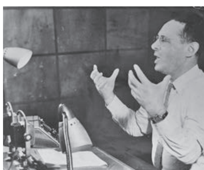
12 апреля 1961 года. Москва. Диктор Всесоюзного радио Юрий Левитан передает сообщение ТАСС о полете человека в космос