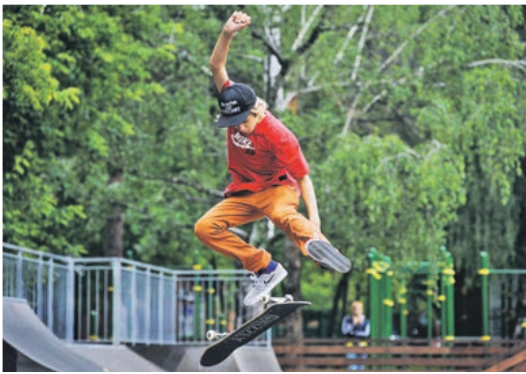
21 июня 11:45 Скейбордингисты освоили пространство парка «Кузьминки», где прошли соревнования по экстремальному натианию на доске