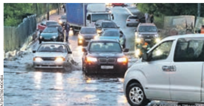
19 июня 14:19 На улице Каспийской подтопило проезжую часть

Прошедшие выходные накрыли столицу проливными дождями. За два дня выпало больше половины месячной нормы осадков, основная часть из которых, по словам синоптиков, припала на субботу. — Наиболее сильные ливни прошли в центре Москвы, на периферии они были значительно слабее, — рассказывает Леонид Старков, ведущий метеоролог Гисметео. — Связаны дожди с распространением влажного воздуха из Турции, на который повлиял теплый атмосферный фронт, прошедший над городом. Результат встречи двух фронтов добавил хлопот столичным коммунальщикам, которым пришлось в увеличенном со-