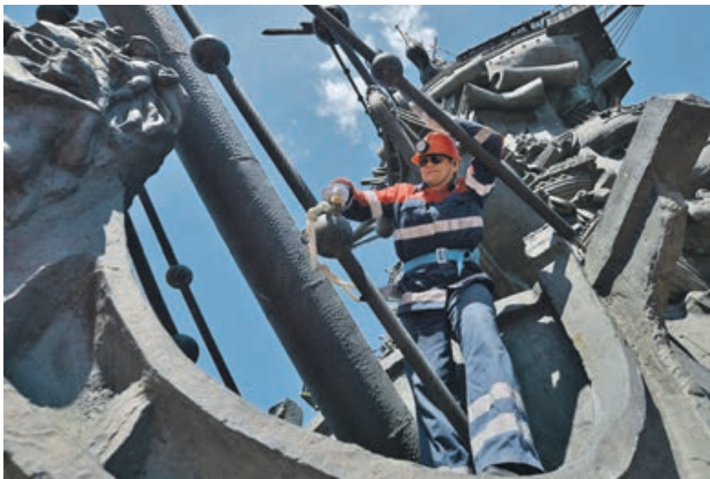
18 июня 10:04 Рабочий ГБУ «Гормост» бережно очищает памятник Петру Первому, высота которого равна 98 метрам

ВИКТОРИЯ ФИЛАТОВА viktoria.filatova@vmdaily.ru