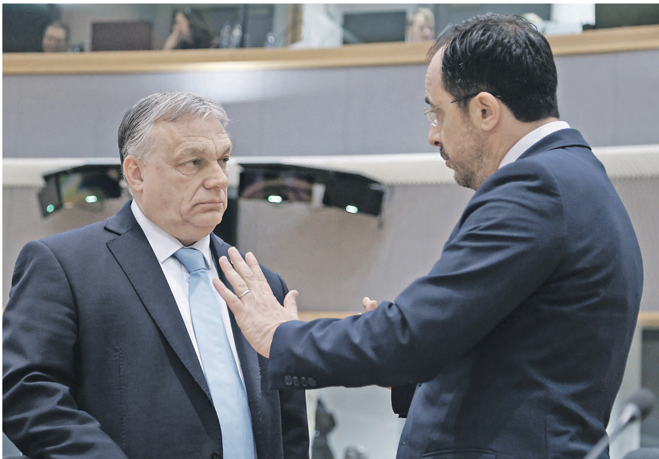
22 марта 2024 года. Саммит лидеров стран Евросоюза в Брюсселе. Премьер-министр Венгрии Виктор Орбан и президент Кипра Никос Христодулидис (слева направо) обсуждают перспективы ЕС

Григорий Савельев согласен: — Сейчас многие забыли, но еще до подрыва «Северных потоков» Германия полностью отказалась от дешевого российского газа — чтобы поддержать американские санкции. И вот результат: падение ВВП страны в 2023 году на 0,3 процента. Многие производства закрылись, выросла безработица. Шольц действует в интересах США, но против Германии. Конечно, многим немцам это не нравится, поэтому растет популярность партии «Альтернатива для Германии». — Германия может выйти из ЕС, если наша партия придет к власти в стране, — заявила сопредседатель фракции «Альтернативы для Германии» в бундестаге Алис Вайдель. — Пример Британии может послужить образцом для Берлина в плане выстраивания по-настоящему суверенной политики.