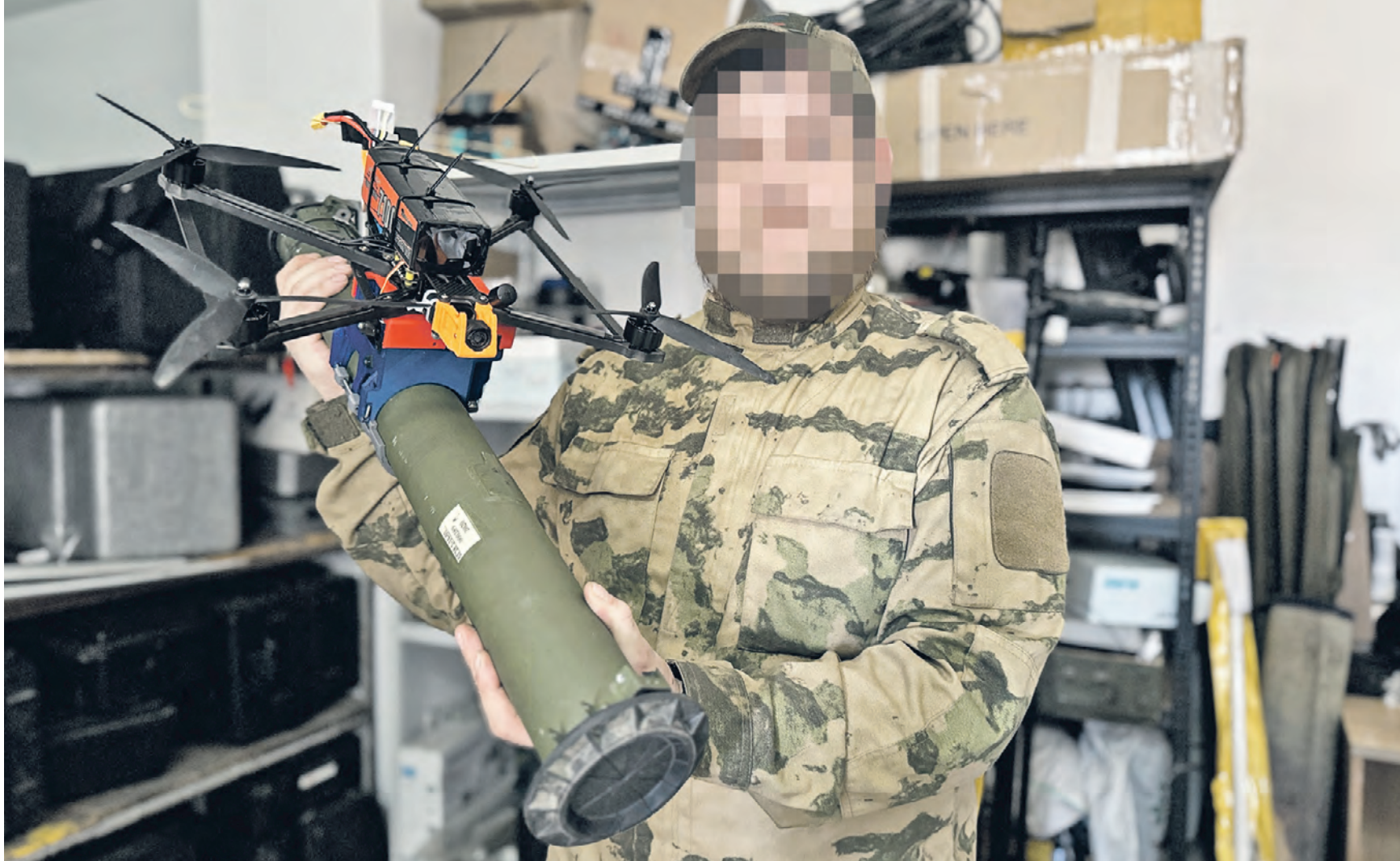
4 апреля. Боец с позывным «Аккорд» показывает усовершенствованный беспилотник, с помощью которого можно сбрасывать боеприпасы.