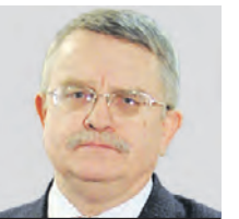
АЛЕКСАНДР ХОЛЛОВ ОБОЗРЕВАТЕЛЬ

Малиновский любил Одессу, и он ее не разрушил. Немцев и румын его солдаты в пух и прах разгромили в Беляевке и Овидиополе — еще на подступах к «красавице у моря». Готовясь к боям за черноморский порт, фашисты выстроили в одесских пригородах четыре рубежа обороны. В самом городе на перекрестках улиц появились доты. Но реального сопротивления наступающим советским войскам враг оказать не смог. Когда вечером 9 апреля 1944 года с севера на вражескую группу армий «Южная Украина» (6-я германская и 3-я румынская армии) пошли в наступление советские 6-я и 8-я гвардейские армии, а с северо-запада в пригород Пересыпь ворвалась 5-я ударная армия, противник получил удар еще и с тыла. Из одесских катакомб вышли скрывавшиеся там во все время оккупации и тревожившие врага дерзкими вылазками партизанские отряды. Бок о бок с ними сражались солдаты словацкой дивизии, которые накануне перешли на сторону Красной армии. В уличных боях партизаны и словаки захватили немецкие доты, а также помешали саперам неприятеля взорвать заминированные портовые объекты, заводы и здание Одесского оперного театра.