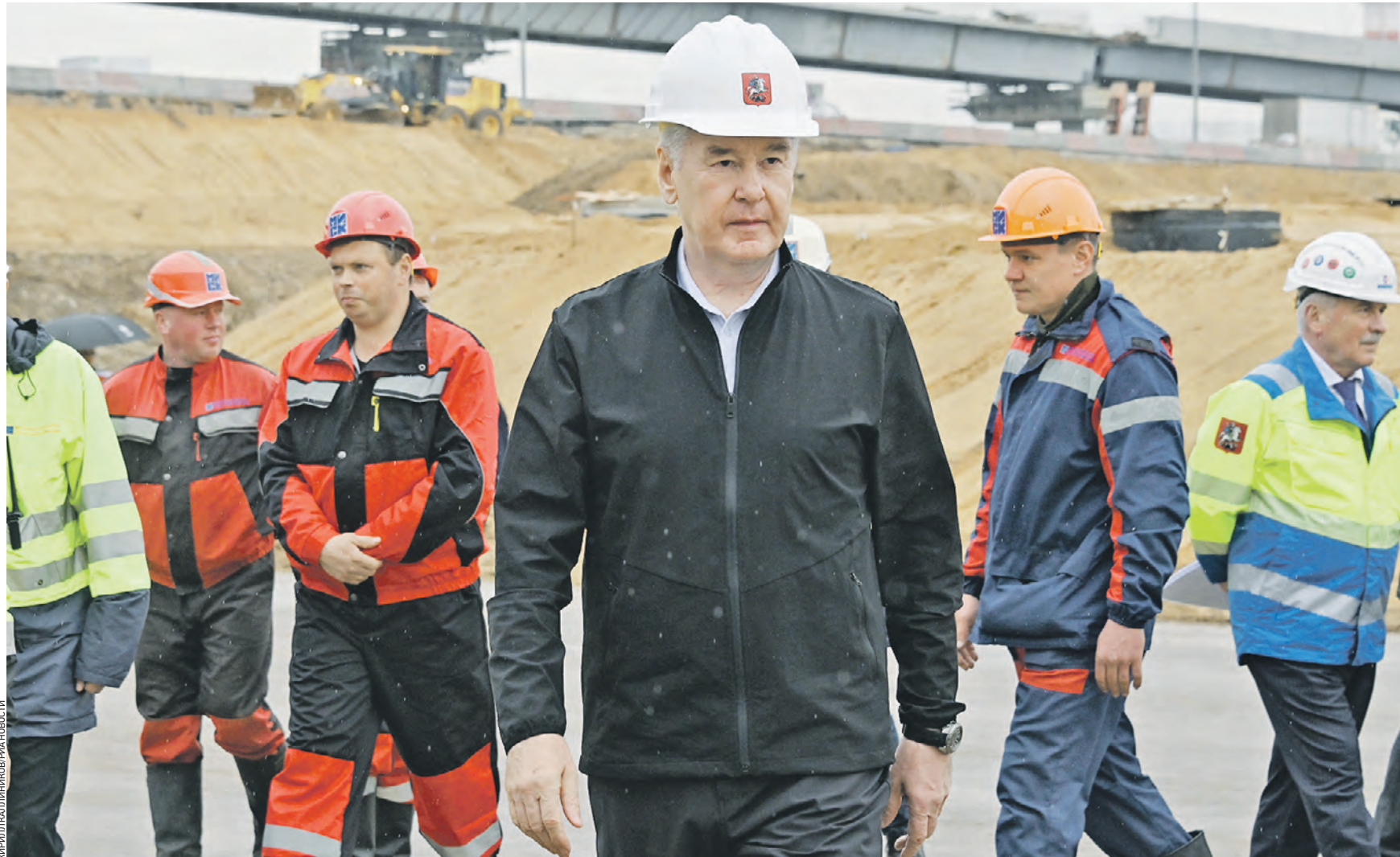
9 апреля. Мэр Москвы Сергей Собянин (в центре) пообщался с рабочими, которые строят дорогу-связку между Московским скоростным диаметром и автомагистралью «Солнцево — Бутово — Варшавское шоссе». Сейчас на объекте задействованы 600 человек, в распоряжении которых 107 единиц техники

Поедем быстрее Всего построят 12,2 километра дорог, включая 3,5 километра прямого хода до автомагистрали Солнцево — Бутово — Варшавское шоссе. — На юге столицы формируем новый дорожный каркас. Идет работа по соединению южного направления Москов-