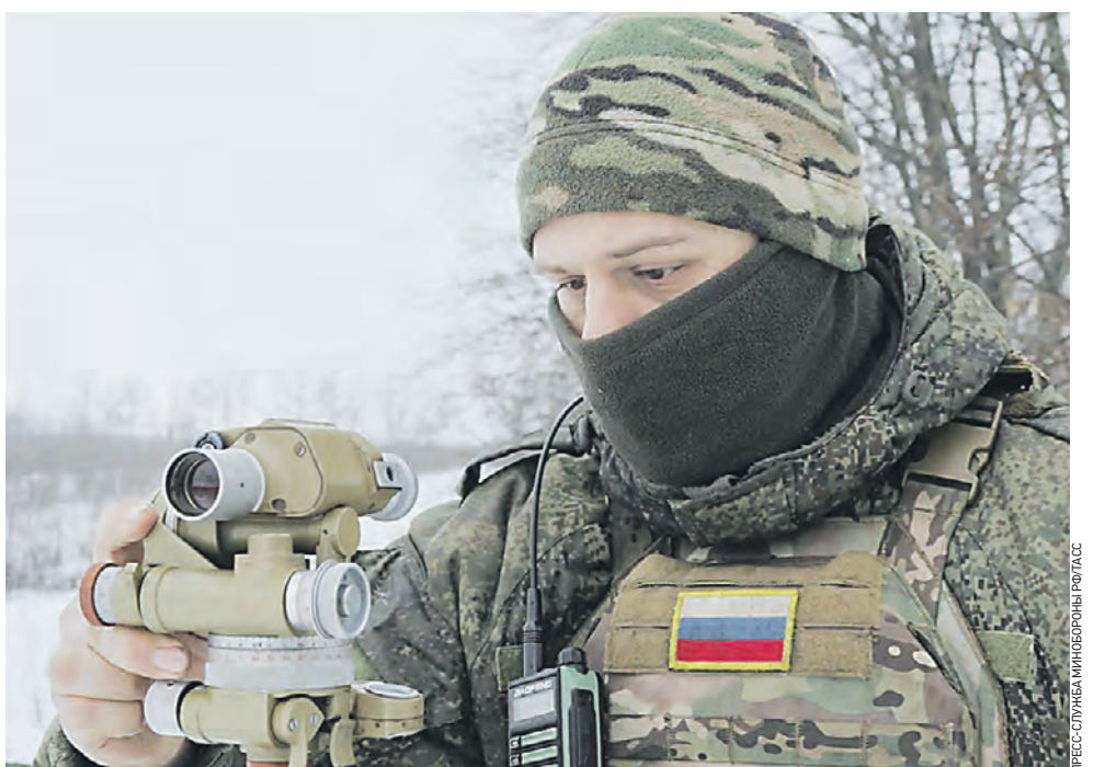
27 февраля. Боец ВС РФ во время работы расчета РСЗО «Град» группировки войск «Запад» на купянском направлении в зоне проведения спецоперации. По данным Министерства обороны РФ, за минувшие сутки российские военнослужащие улучшили тактическое положение и нанесли огневое поражение живой силе и технике ВСУ в районе Синьковки Харьковской области. Потери противника составили до 145 военнослужащих, две боевые машины пехоты и два пикапа.