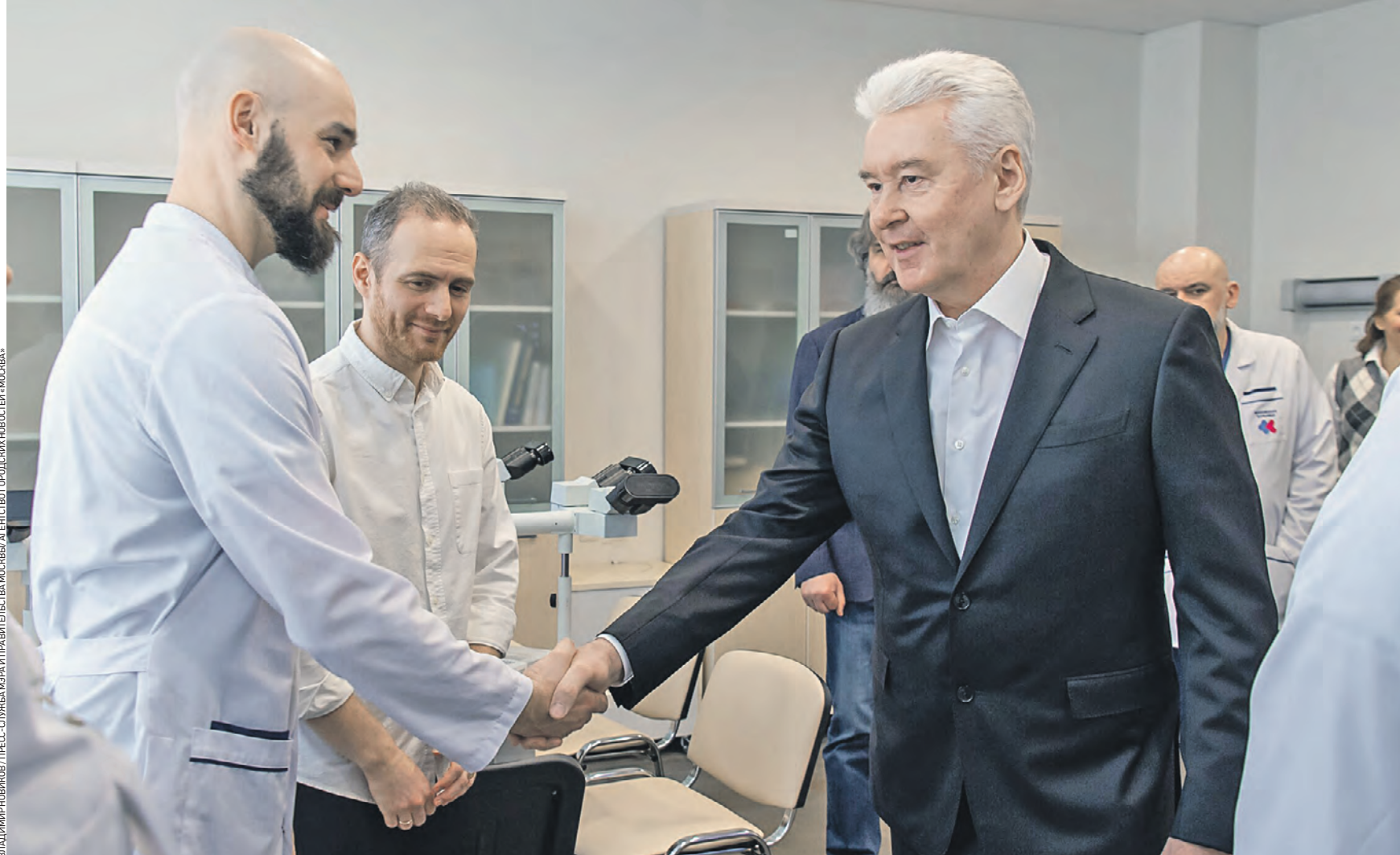
28 февраля. Мэр Москвы Сергей Собянин (справа) поздравил коллектив Московского многопрофильного клинического центра «Коммунарка» с окончанием строительства корпуса лучевой терапии. При больнице уже создана одна из самых современных патоморфологических лабораторий, которая помогает в диагностике онкозаболеваний

— Это самый современный ускоритель, который позволяет с миллиметровой точностью добираться до самых труднодоступных опухолей,