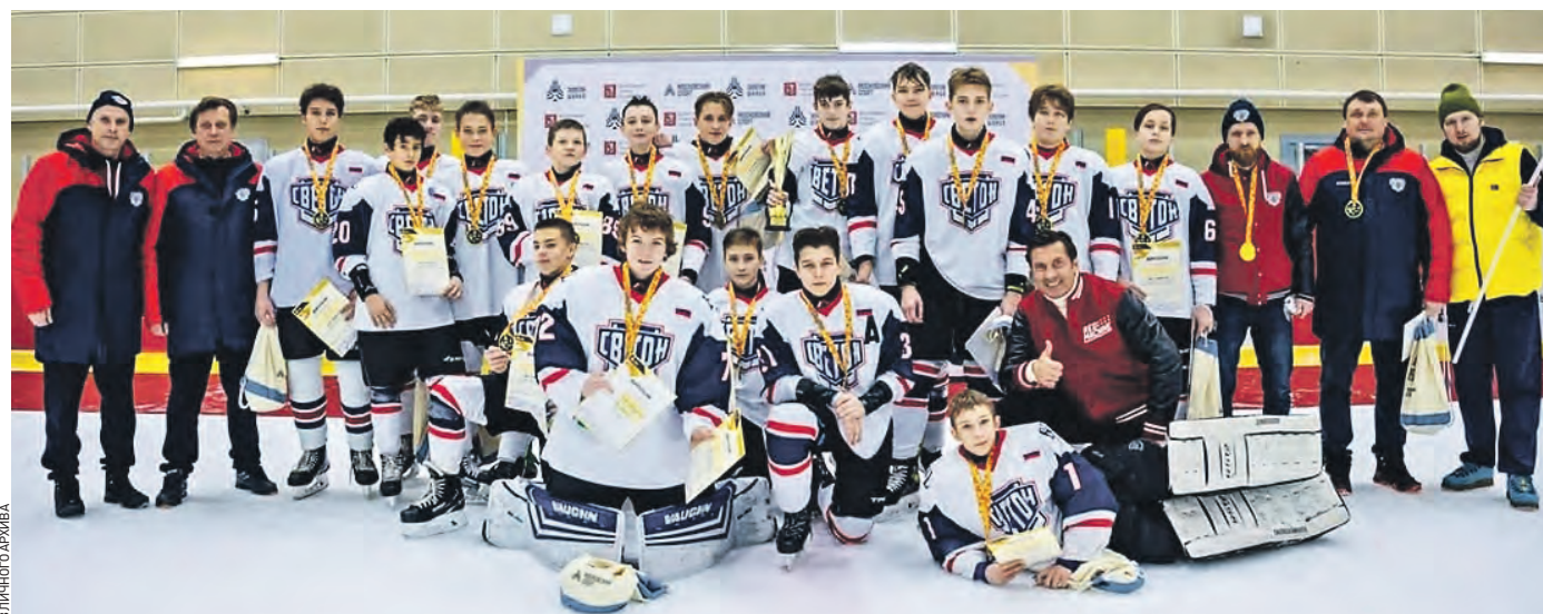
16 февраля. Юные хоккеисты из команды «Светон» 2009–2010 года рождения вместе с тренерским составом после завершения победного матча в турнире «Золотая шайба»