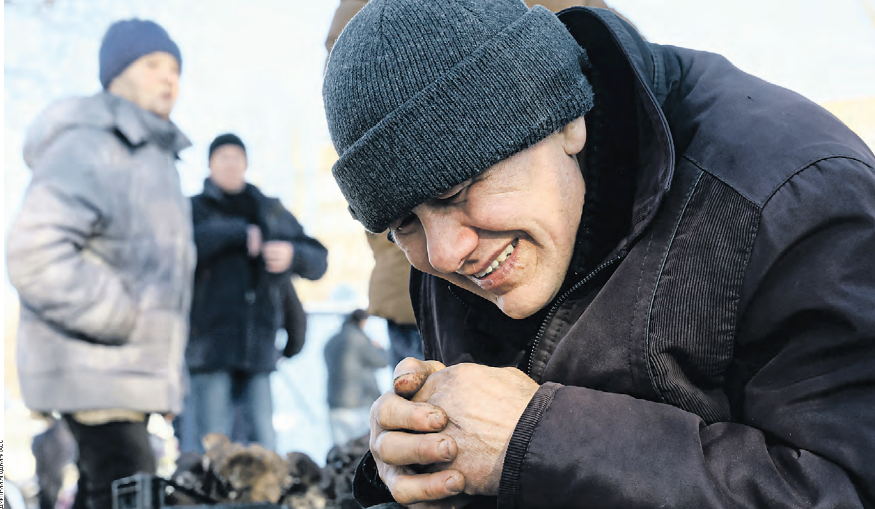
21 января. Донецк. Мужчина на территории рынка «Меркурий» после обстрела со стороны боевиков киевского режима. Они нанесли по мирному кварталу комбинированный артиллерийский удар снарядами калибра 152 и 155 миллиметра