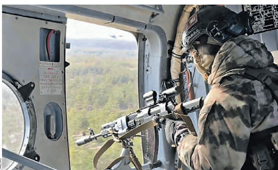
21 января. Военнослужащий ударной группы авиации Воздушно-космических сил России. Наши ВКС поразили скопление живой силы боевиков киевского режима, а также бронетехнику противника на краснолиманском направлении