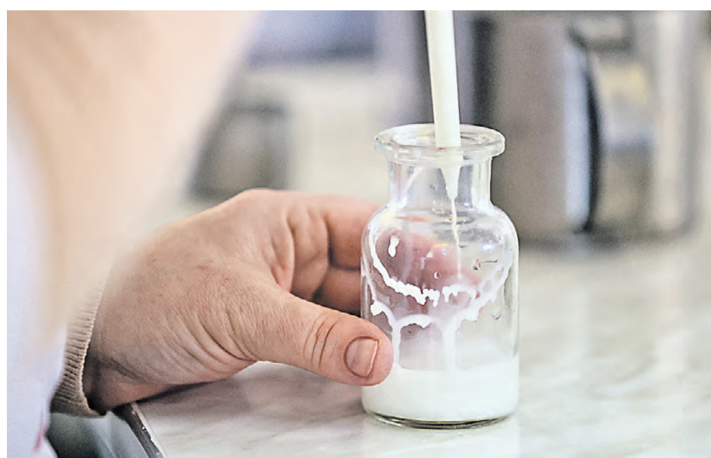
Запорожская область. Мелитополь. Проба молока в лаборатории на территории Мелитопольского молокозавода. Завод модернизирует производство за счет оснащения новым оборудованием