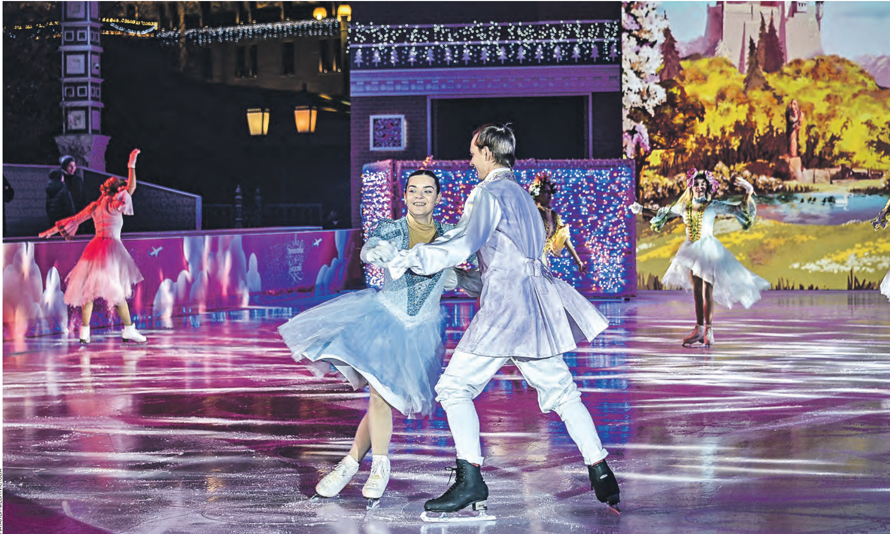
23 декабря. Знаменитая фигуристка Аделина Сотникова (в центре) выступила в главной роли в спектакле «Белоснежка». Постановку представили на катке на площади Революции. Ледовое шоу «Белоснежка» собрало сотни зрителей, подарив им чудесное настроение праздника и волшебства