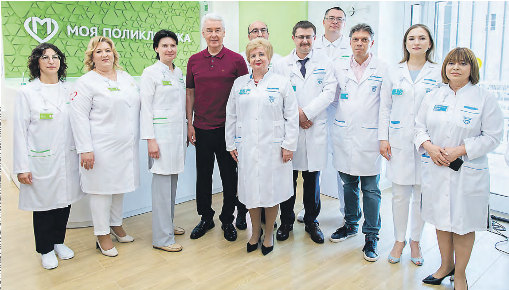
19 июня. Мэр Москвы Сергей Собянин (в центре) с работниками филиала поликлиники № 91, который открылся после капитального ремонта и модернизации. Медицинских учреждений, которые работают по новому московскому стандарту, становится все больше

Глава столицы подчеркнул, что для максимального комфорта пациентов и врачей продумали все до мелочей. В поликлиниках будут приняты все необходимые специалисты, в их распоряжении — медицинское оборудование последнего поколения. Мэр подчеркнул, что больше 50 тысяч горожан получат высококлассную медицинскую помощь и самые современные виды диагностики рядом с домом. Всего в 2023 году в столице открыли 13 новых поликлиник.