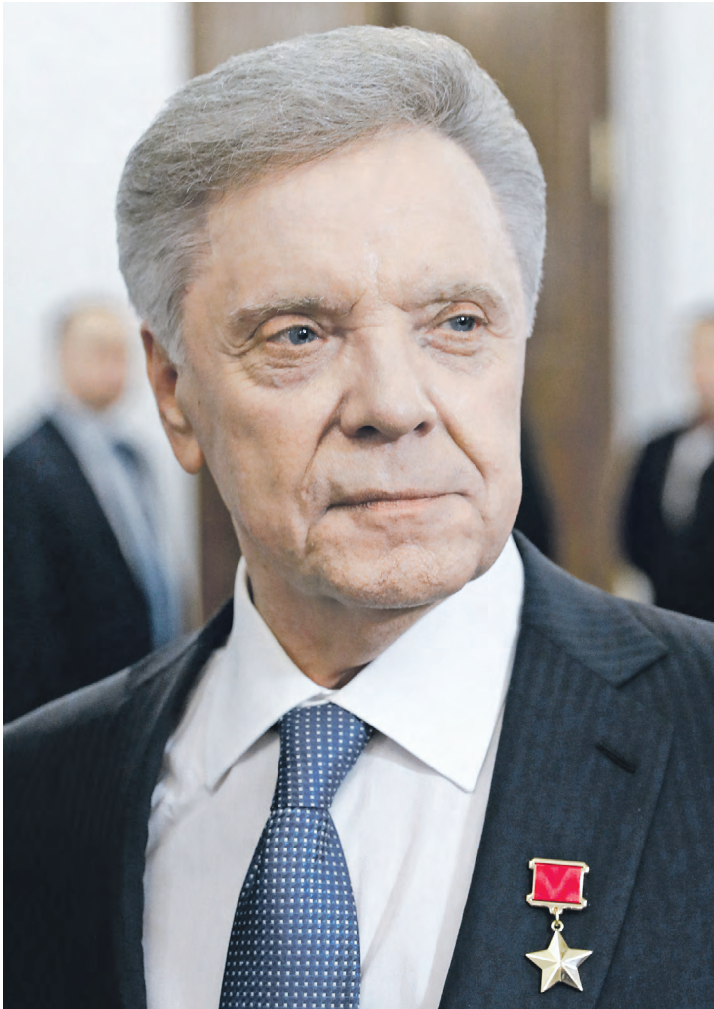
27 ноября 2018 года. Москва, Кремль. Председатель Всероссийской общественной организации «Боевое братство» Борис Громов

Борис Всеволодович, а что на афганской войне было самым трудным лично для вас? Командирская доля тяжела: необходимо принимать решения, от которых зависит жизнь многих людей. В Афганистане любая боевая операция, да и просто отправка в горы колонны, вылет авиагруппы были сопряжены с риском. Штаб 40-й армии тщательно планировал и разрабатывал все мероприятия, но стопроцентно гарантировать безопасность личного состава я не мог. Разные были ситуации, но самым трудным для меня было в тихом кабинете принимать решения, которые потом приходилось в горах и пустынях выполнять моим солдатам.