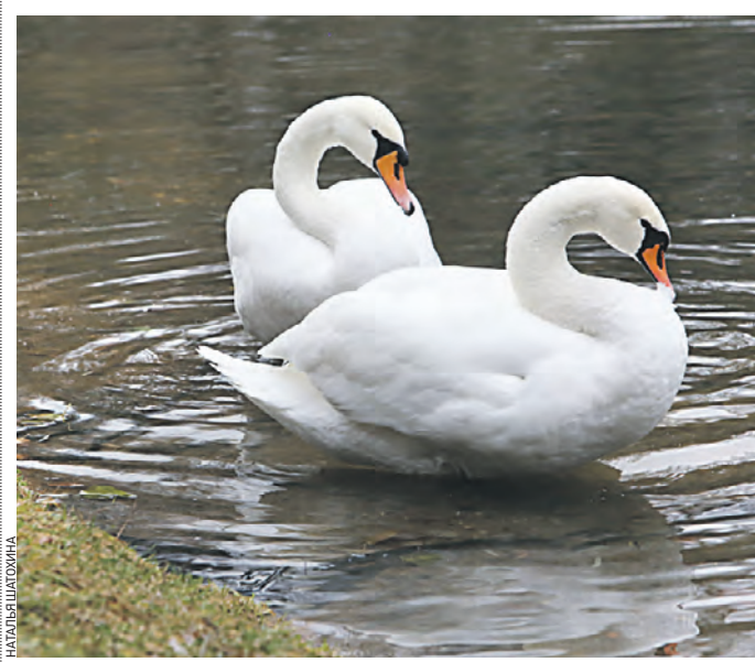
6 ноября. Лебеди Марта и Дусик плавают в Золотом пруду парка культуры и отдыха «Сокольники»