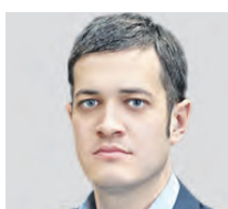
МАКСИМ ЖУКОВСКИЙ СУДЬЯ ТРЕТЬЕГО СУДА РФ

Да хорошо, что времени на первичный прием стало больше — во всяком случае, пациент дольше может собраться с мыслями, чтобы потом взаимодействовать с врачом. Но, на мой взгляд, регламентировать первичный прием у психиатра — это неверно. Ведь люди, которые приходят к специалисту, находятся в измененном психоэмоциональном состоянии. Многие из них долгое время молчат и начинают говорить лишь на 22-й минуте. И что, врач должен смотреть на часы? Я сам закладываю на прием 50 минут. За это время можно как-то текущую ситуацию «подтянуть». Я считаю, что необходимо увеличить количество психиатров.