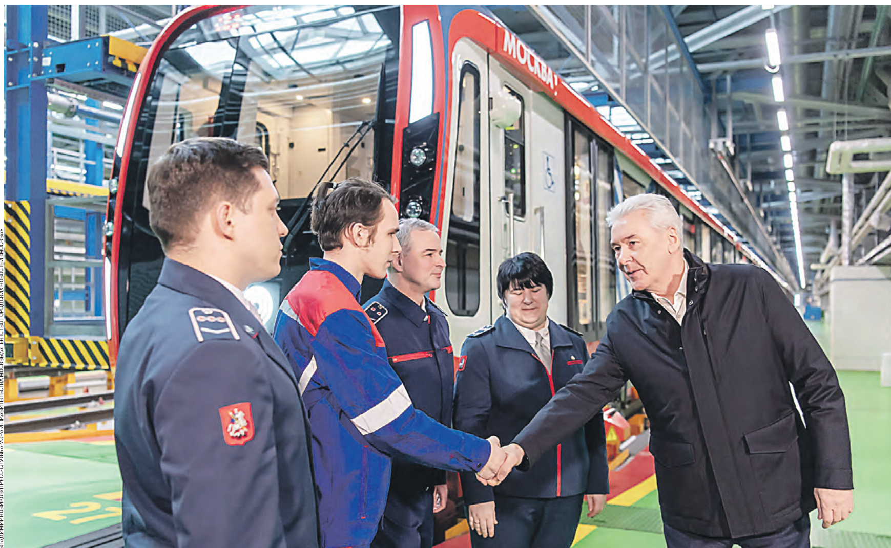
5 апреля 2022 года. Мэр Москвы Сергей Собянин (справа) посетил электродепо «Солнцево», куда поступил 100-й поезд «Москва 2020». Состав нового поколения был создан по заказу городских властей. Теперь их в столичной подземке уже больше 1,1 тысячи. В 2024 году эти поезда запустят и на Замоскворецкой линии метро