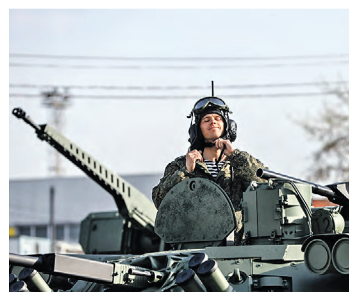
28 апреля 2022 года. Москва. Военнослужащий на боевой машине пехоты БМП-2М с боевым модулем «Бережок»

За разработку этого боевого комплекса для оснащения бронетанковой техники авторский коллектив ученых, конструкторов и инженеров из прославленного Конструкторского бюро приборостроения имени академика А.Г. Шпуннова (КБП) несколько лет назад получил национальную премию «Золотая идея». Награда — подделу: «Бережок» повысил боевую мощь БМП-2 в четыре раза. Обитаемый двухместный боевой модуль Б05Я01 «Бережок» — это классическая башня БМП-2, но с кардинально обновленным комплексом вооружения. Основная огневая мощь боевого отделения «Бережок» — 30-мм автоматическая пушка 2А42. Для точной стрельбы в модуле установлен комбинированный прицел с независимой системой стабилизации линии визирования в двух плоскостях. В нем объединены визуальный оптический, тепловизионный и лазерный дальномер-