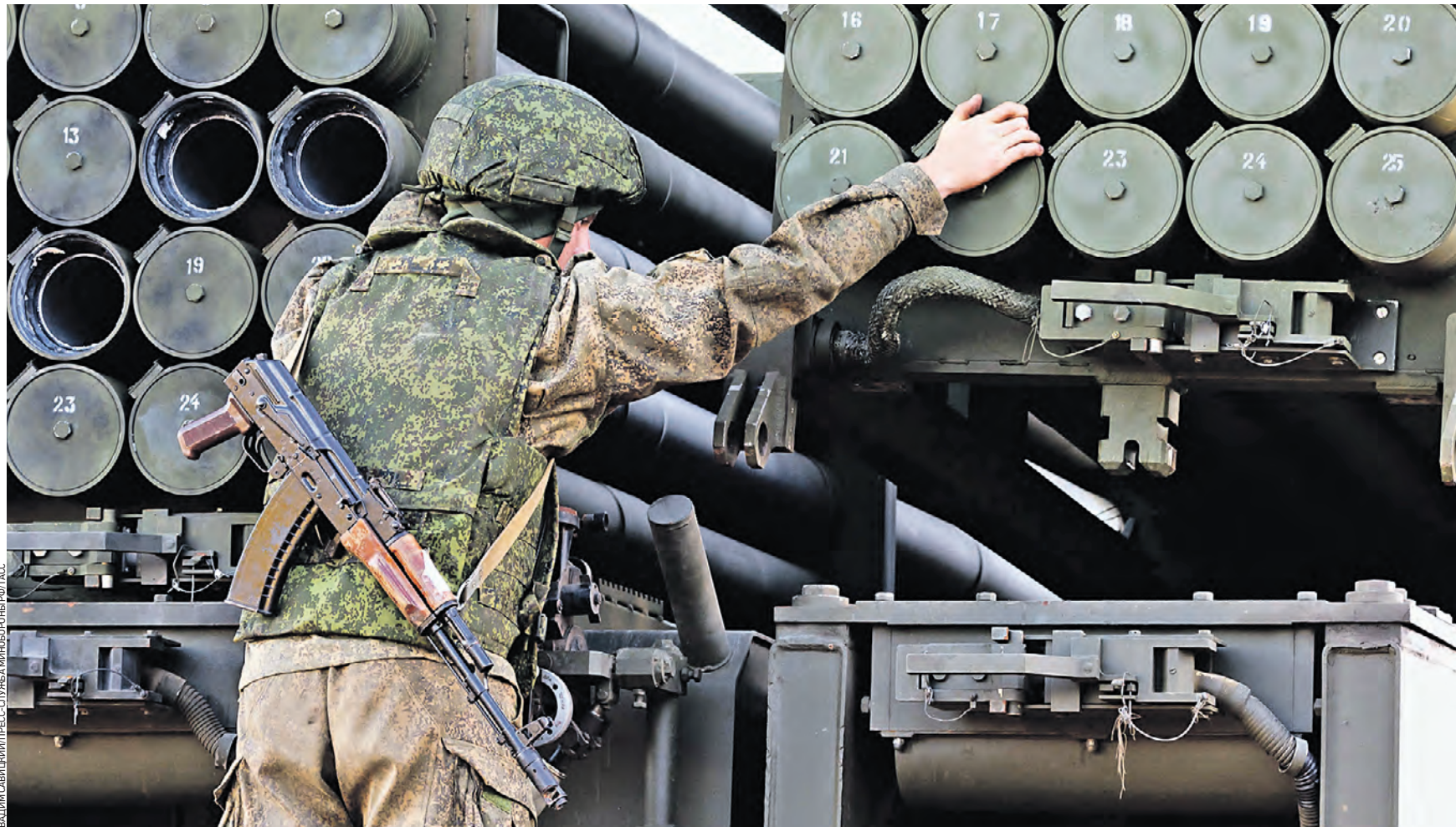
6 сентября 2022 года. Приморский край. Работа ракетной установки во время проведения стратегических командно-штабных учений (СКШУ) «Восток-2022» на полигоне Сергеевский

Начало разгрома врага на запорожском направлении положило первое массированное применение в реальных боях новейших инженерных систем дистанционного минирования (ИСДМ) «Земледелие». Подорвавшиеся на непроходимых минных полях, обезвреженные танки и БМП врага добивали уже наши артиллерия и армейская авиация. ИСДМ разработана специалистами НПО «Сплав» ростеховского холдинга «Технодинамика». Впервые система,