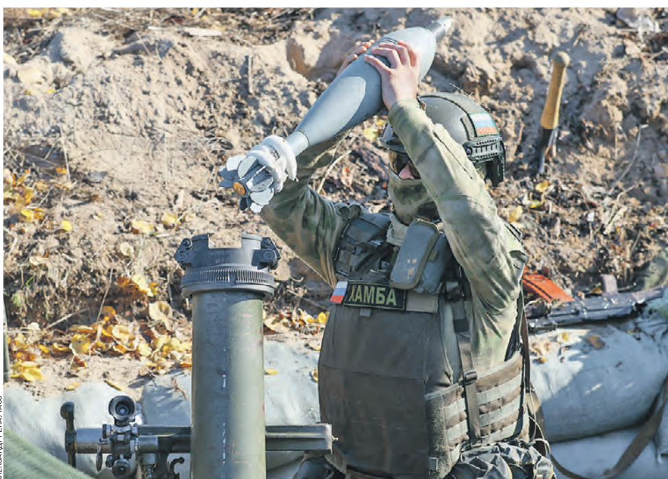
30 октября. Экс-боец ЧВК «Вагнер», который перешел на службу в спецназ «Ахмат», выполняет задачи в зоне специальной военной операции. Глава Чеченской Республики Рамзан Кадыров сообщил, что 170 бойцов ЧВК «Вагнер» вошли в состав «Ахмата». Кадыров подчеркнул, что это люди, имеющие богатый опыт ведения боевых действий как на территории Донбасса и Украины, так и в других горячих точках.