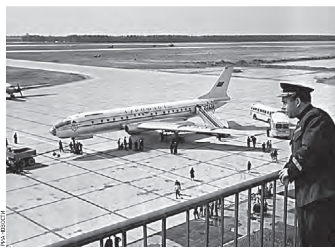
Самолет Ту-104В, прибывший из Ленинграда в Москву, на летном поле аэропорта Шереметьево. Август 1959 года

«Близятся к завершению проводимые Московской научно-реставрационной производственной мастерской работы по восстановлению палат Нарышкиных на Пев-тровке. Это одно из крупнейших сохранившихся в Москве сооружений гражданской архитектуры XVII века». 10 ноября 1960 года В этом году в Москве отреставрировали 205 памятников архитектуры, в том числе объ-екты, входящие в состав Дон-ского монастыря. — Возрождение комплекса Донского монастыря во всей былой красоте и величии — один из самых ярких и мас-