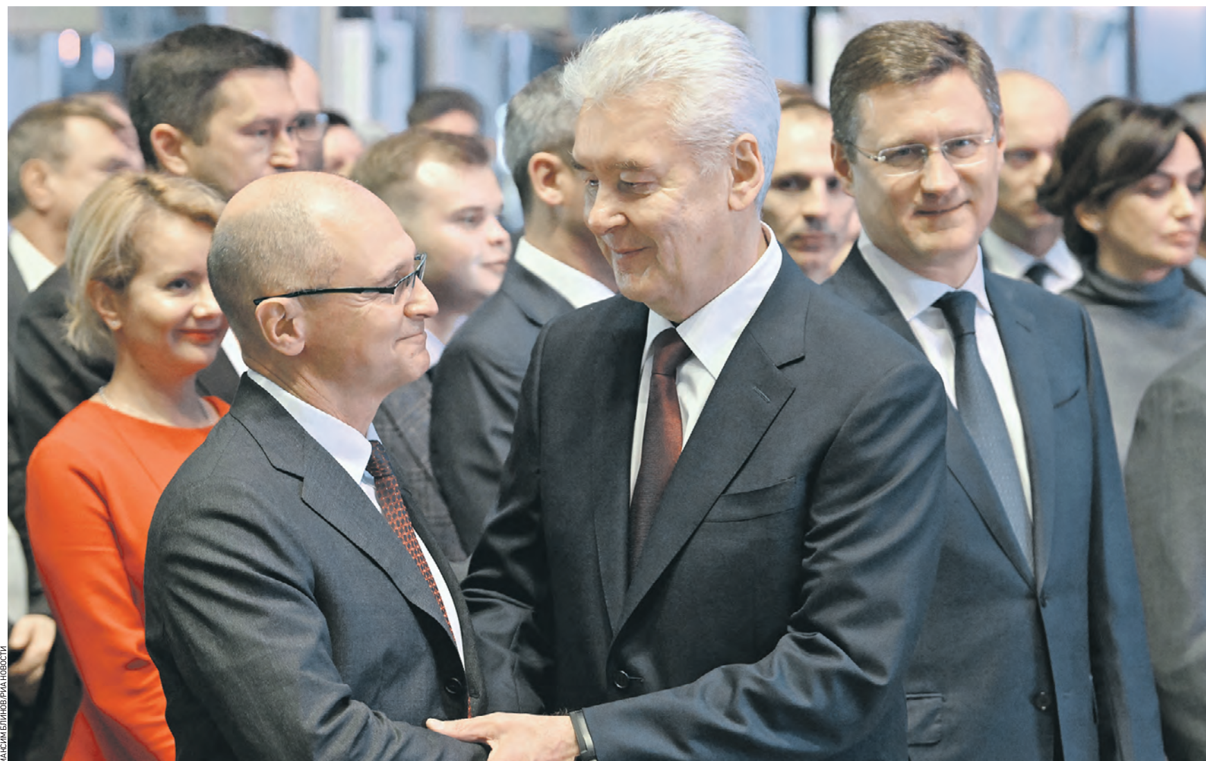
2 ноября. Первый заместитель руководителя администрации президента РФ Сергей Кириенко, мэр Москвы Сергей Собянин и заместитель председателя правительства РФ Александр Новак (слева направо) на церемонии открытия павильона «Атом» на ВДНХ после масштабной реконструкции

Участие в церемонии принял заместитель председателя правительства российского правительства, министр энергетики РФ Александр Новак. Он отметил, что многие годы атомная отрасль была довольно закрытой, о ней мало говорили. — Но сегодня, учитывая роль атомной энергетики, которая используется все больше в разных отраслях экономики, становится важным показать достижения, которые имеются в этой сфере, — сказал Александр Новак. — Атомная отрасль — гордость нашей страны, это история великих открытий, рекордов, научных достижений и великих людей. Он подчеркнул, что атомная отрасль обеспечивает суверенитет и безопасность России, гарантированное снабжение граждан электроэнергией. Павильон «Атом» — настоящий дворец знаний. Здесь по-