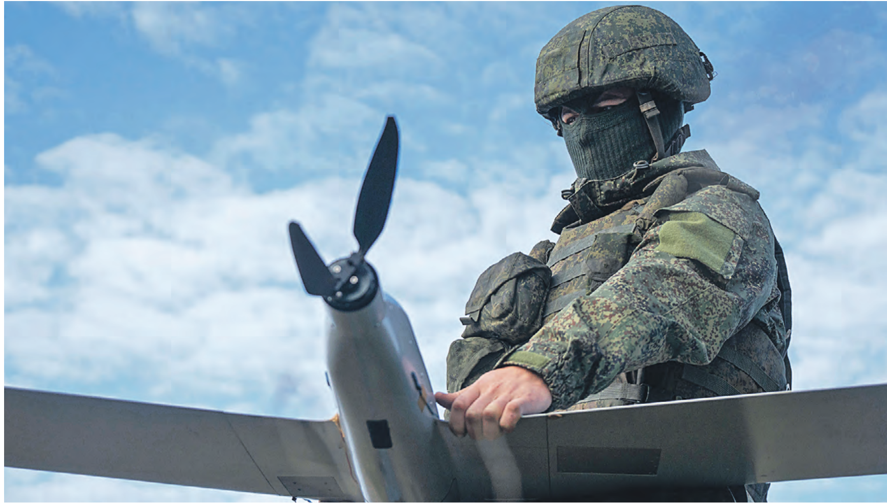
27 октября 2022 года. Военнослужащий Вооруженных сил России запускает разведывательный беспилотный летательный аппарат ZALA на Николаево-Криворожском направлении