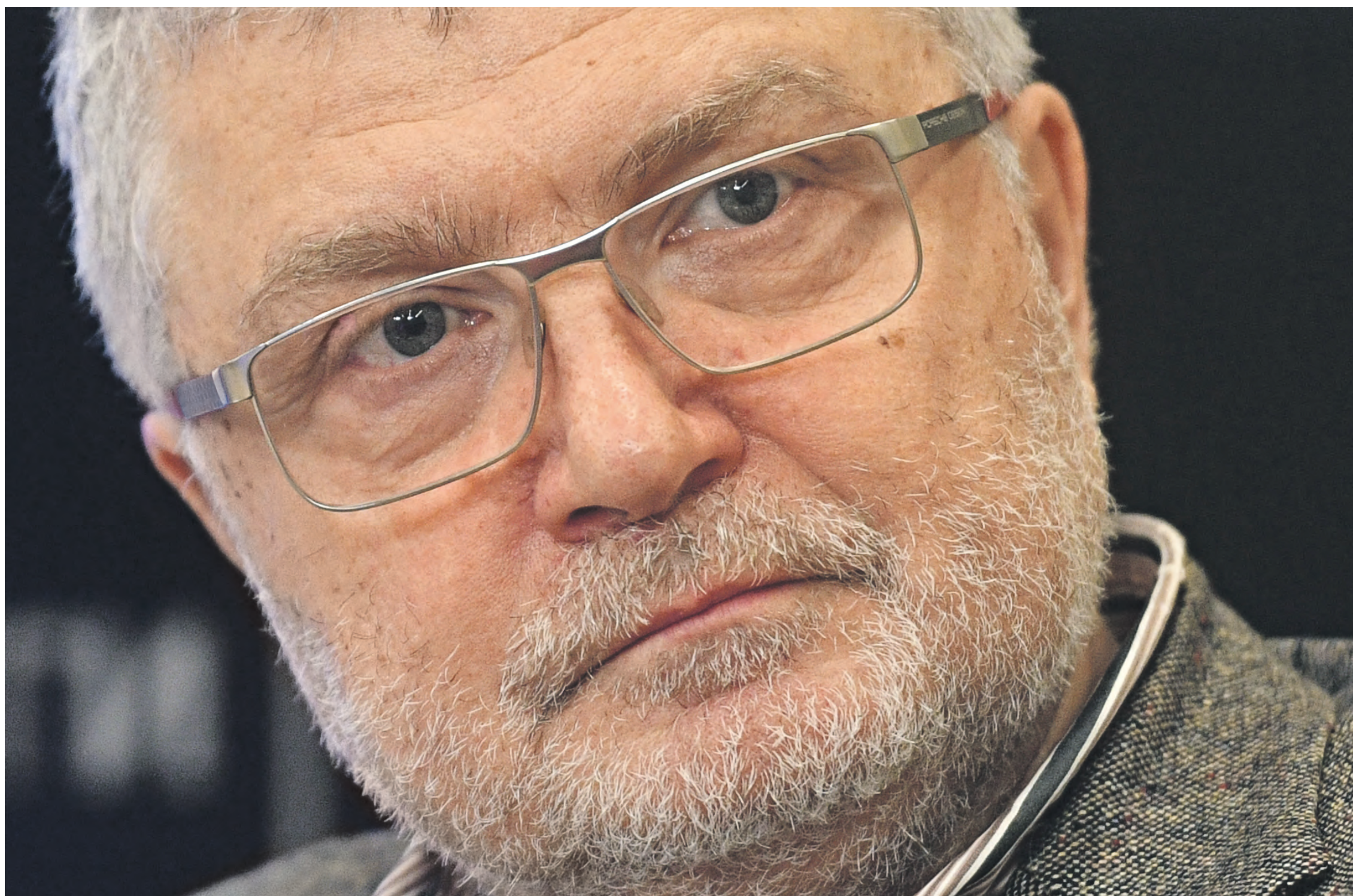
5 ноября 2019 года. Писатель, публицист и общественный деятель Юрий Поляков во время творческой встречи в Международном мультимедийном пресс-центре МИА «Россия сегодня»

А может, наоборот: культура — проекция языка? Если согласиться, что мысль изреченная есть ложь, то мысль, не выраженная словами, попросту не существует. Афоризм промывать невозможно. А жаргонизмы, арготизмы, разного рода сленг, нецензурная лексика всегда были и будут. Вы думаете, кавалергарды не матерились? Еще как! У каждого языкового стиля своя сфера применения. Человек, говоря, всегда играет с языком. Когда-то устойчивый оборот «как у дурака махорки» был смелым тропом, родившимся в разговоре и закрепившимся в силу своего богатого смысла. Есть игра в грамматическое и семантическое непослушание. Когда доктор филологических наук говорит, что ему «нравится» статья оппонента, ясно, что он вкладывает в эту оценку негативный смысл. «На районе» — пример того же ряда. Этот вроде бы неграмотный оборот используется с дополнительным значением некоей незаконности поведения. А вспомните «албанский язык», которым увлекались в 1990-е! Ничего страшного в этих языковых явлениях, по-моему, нет, если при этом норма поддерживается высоким уровнем литературы, театра, кино, телевидения, устной и письменной журналистики. А вот тут у нас — засада... Действительно, языковой за-