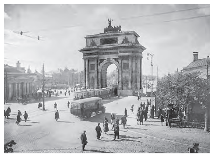
1934 год. Движение трамвая через Триумфальную арку на площади Белорусского вокзала

21 июня 1936 года Каждый год в Москве появляется около 300 новых пешеходных переходов. Порой нанесения разметки недостаточно, чтобы обеспечить пешеходов безопасностью. — Иногда, проанализировав обстановку на одной из улиц, мы приходим к выводу, что