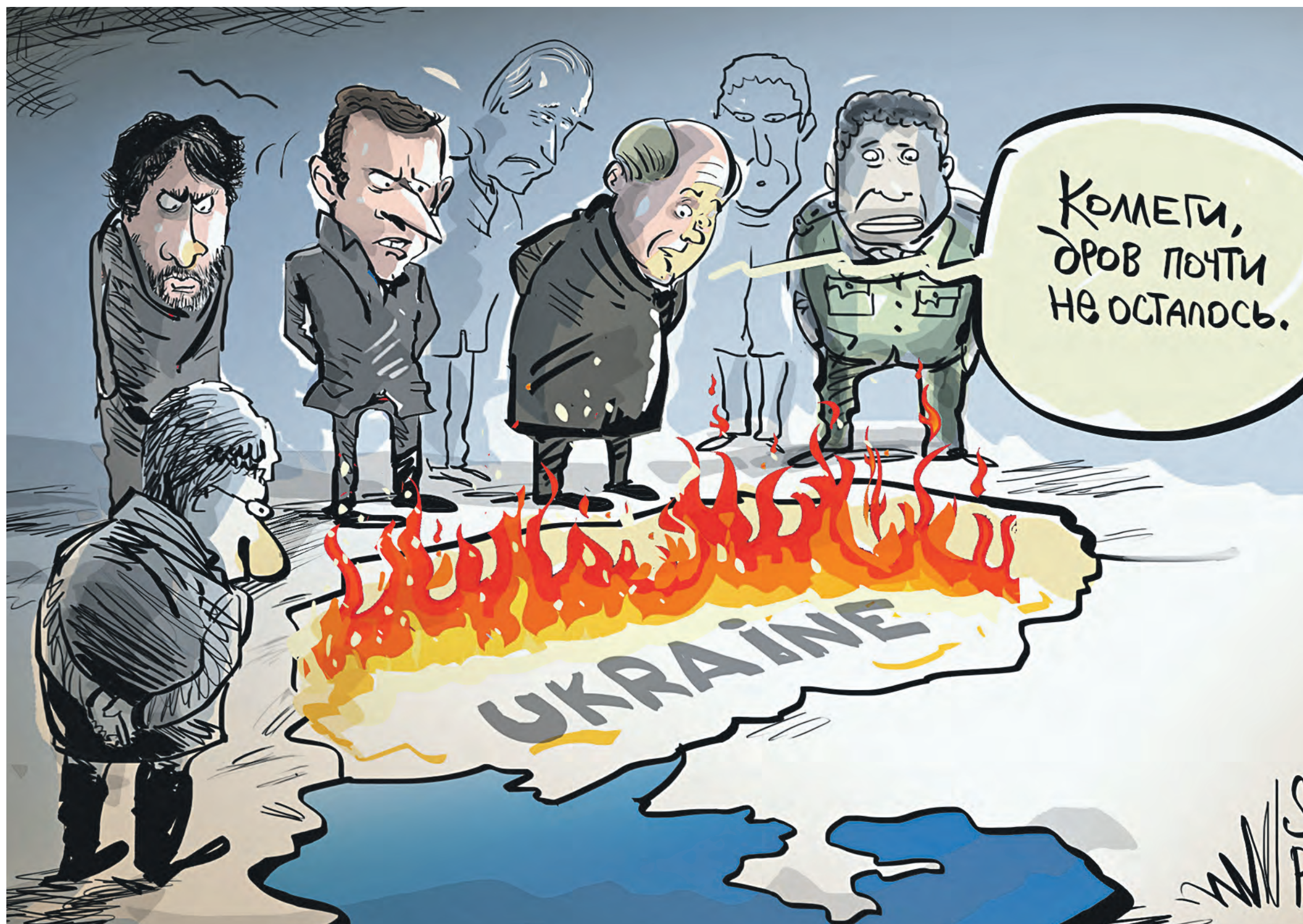
Провальное наступление ВСУ может стать для коллективного Запада поводом для начала переговоров с Россией. США заинтересованы в продолжении конфликта, но Европа хотела бы его прекратить: слишком дорого обходится

Запад выдохся и подталкивает нас к переговорам