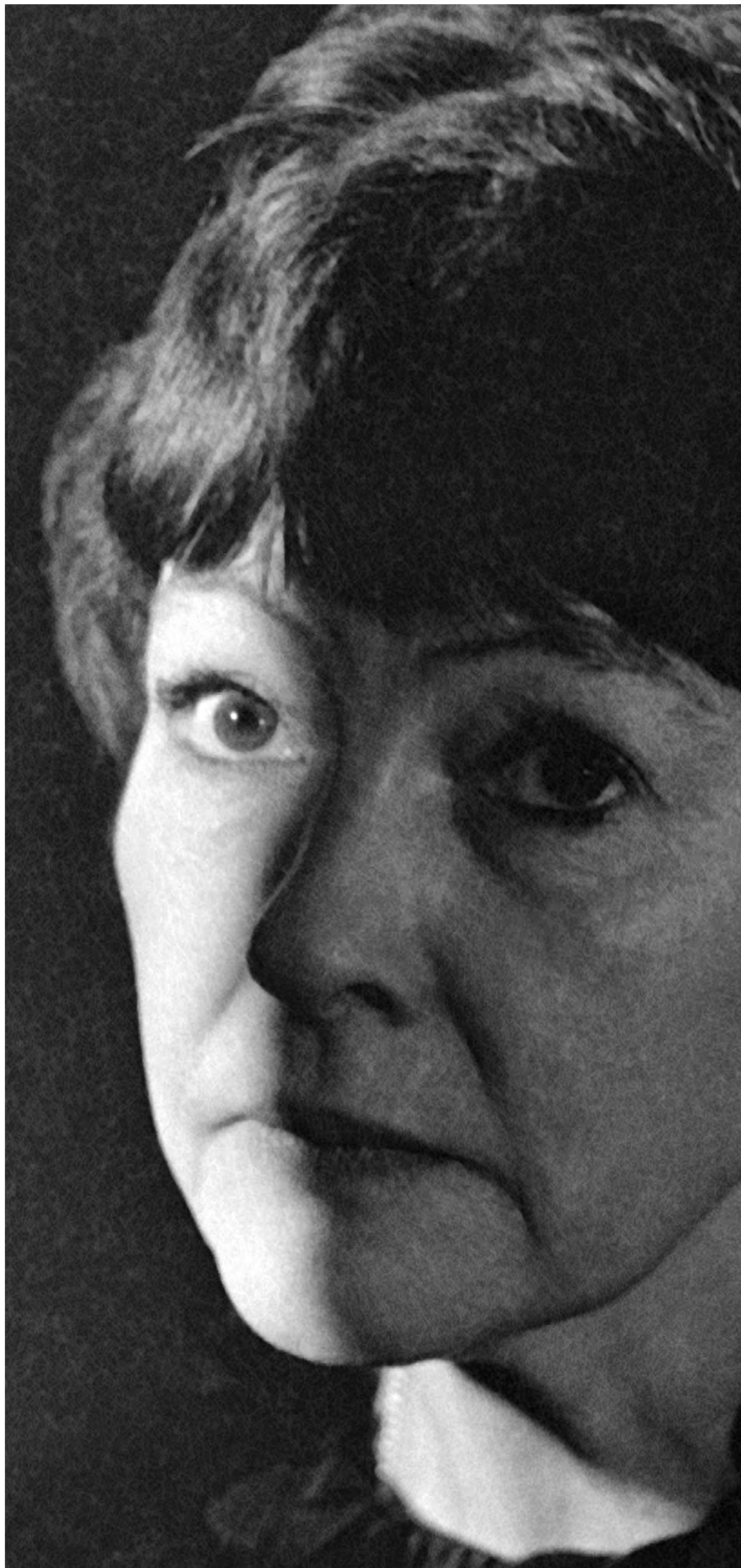
Белла Ахмадулина в Тбилиси, дата съемки — 13 декабря 1984 года

Письмо против Пастернака она не подписала («Велели — отречься от него. Но какое счастье: не иметь выбора, не уметь отречься — не было у меня такой возможности») и, чтоб отстали, перестала появляться в Литинституте.