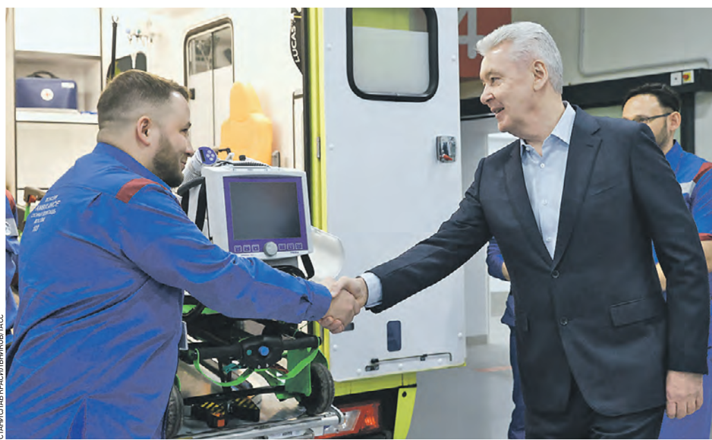
17 января 2023 года. Мэр Москвы Сергей Собянин (справа) на открытии флагманского центра на территории НИИ скорой помощи им. Н. В. Склифосовского

— Проведено более 7,5 тысячи операций, в том числе в гибридных операционных с участием хирургов разных специализаций, — поделился мэр. — Порядка 40 процентов пациентов — инфаркты, инсульты и другие сердечно-сосудистые заболевания. Примерно треть — аппендицит, холецистит, панкреатит и другие хирургические патологии. Чуть больше 15 процентов — травмы и отравления. Кроме того, добавил глава города, примерно каждый пятый пациент — 18 процентов — был направлен по «красному» потоку, то есть врачи приступали к борьбе за