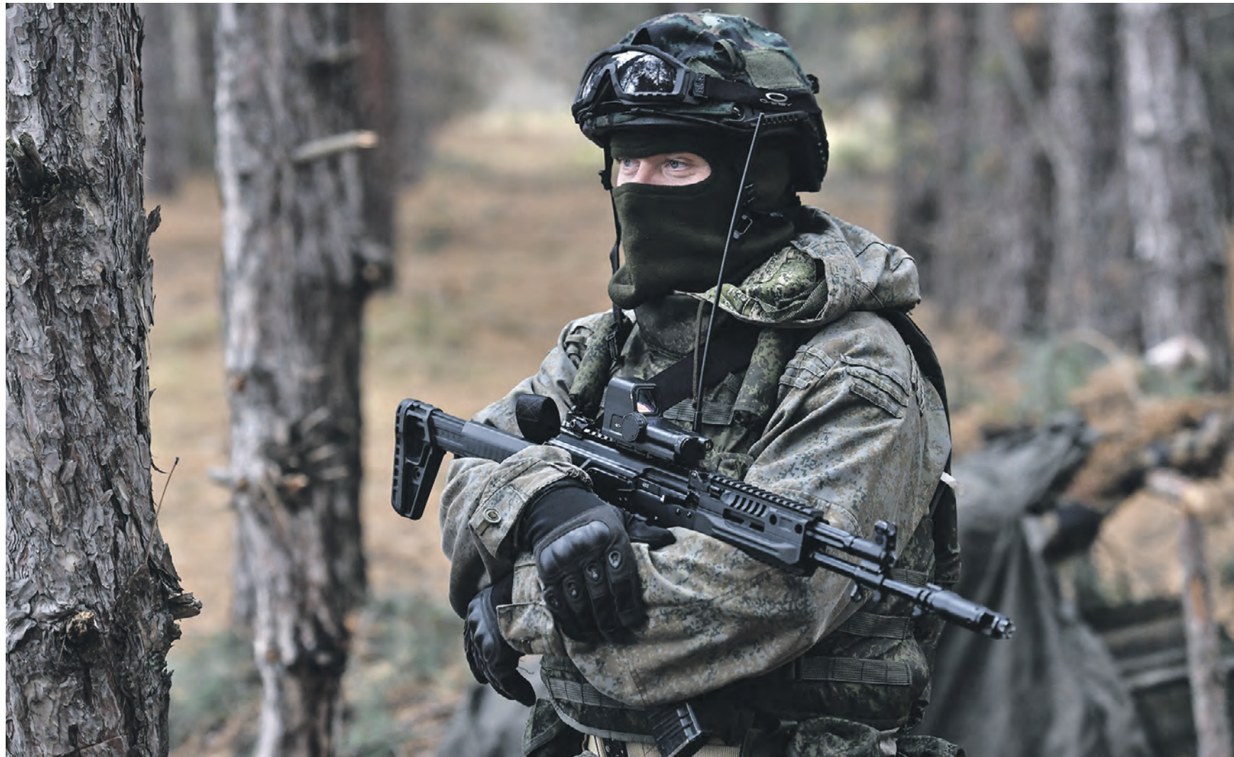
24 ноября 12:29 Военнослужащий морской пехоты Черноморского флота на позиции на Херсонском направлении. Он и его боевые товарищи находятся в постоянной готовности противостоять любым вражеским действиям