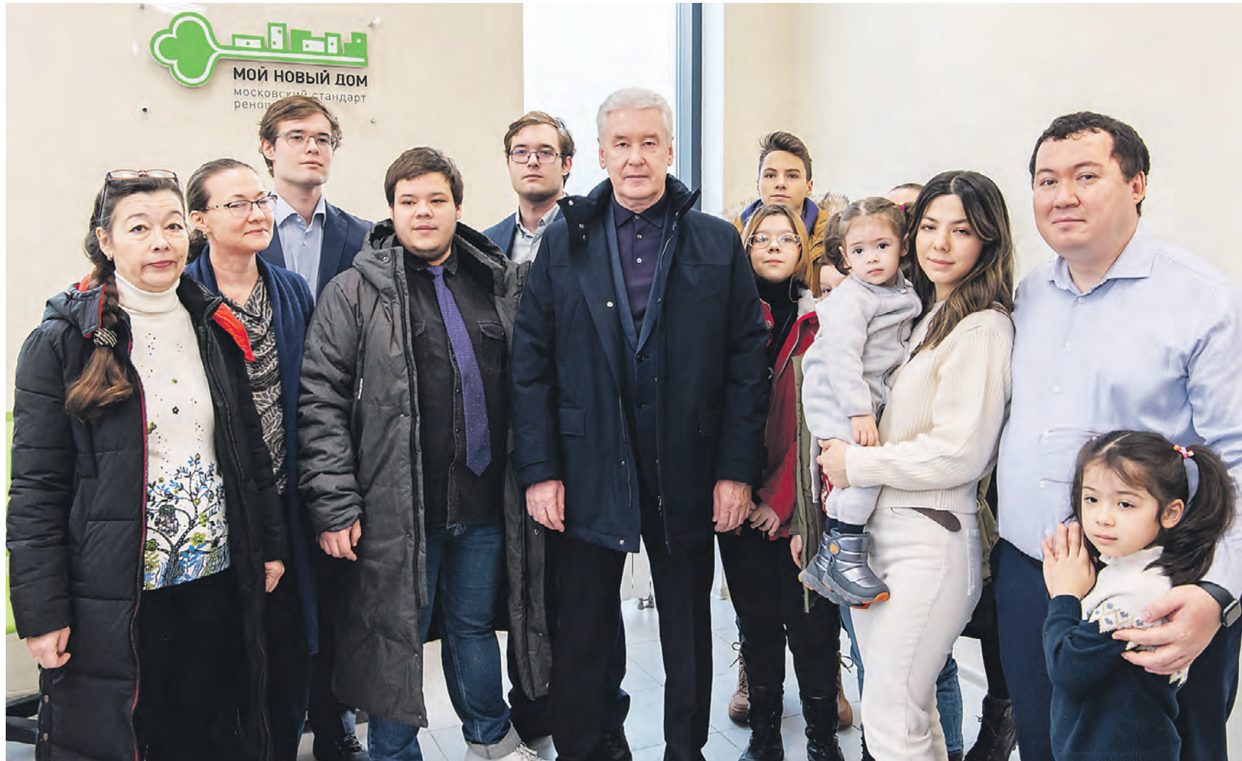
Вчера 13:06 Мэр Москвы Сергей Собянин (в центре) пообщался с жителями Таганского района, которые переезжают по программе реновации в новостройку на улице Мельникова. Все квартиры — с улучшенной отделкой, на первых нежилых этажах со временем откроются магазины, кружки и секции для детей

— Много слухов ходит, что очень сложная ситуация, программа реновации остановится, — ничего подобного! — подчеркнул Сергей Собянин. — Мы работаем, сдаем дома строго по графику. Всего в новые квартиры переедут около миллиона жителей, или каждый десятый москвич. Как добавил мэр, всем желающим город помогает перевезти вещи. По вопросам переселения москвичи могут обратиться в специальные центры информирования. Консультации проведут представители Департамента городского имущества, Московского фонда реновации, префектуры, управляющей компании и генподрядчика. В Таганском районе в программу реновации вошли 16 домов, жители пяти из них уже получили ключи от квартир с улучшенной отделкой. — Насколько я знаю, отказов практически нет, — сказал Собянин. — Почти 95 процентов семей уже согласились и пере-