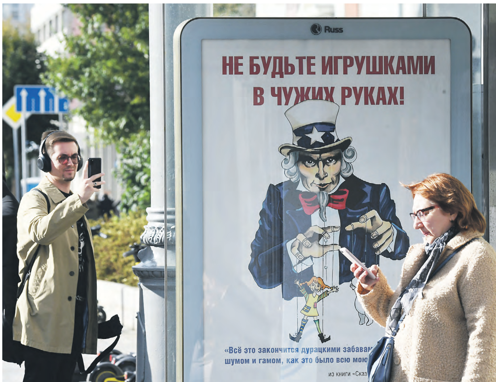
17 сентября 2022 года. В объектив камеры попали прохожие с телефонами в руках, не замечающие плаката с предупреждением: «Не будьте игрушками в чужих руках!»