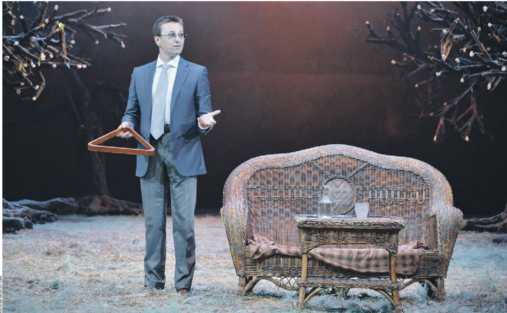
Вчера 14:43 Художественный руководитель Московского Губернского театра, народный артист России Сергей Безруков на собрании труппы по случаю старта нового театрального сезона рассказал про изменения в работе учреждения и о планах творческого коллектива