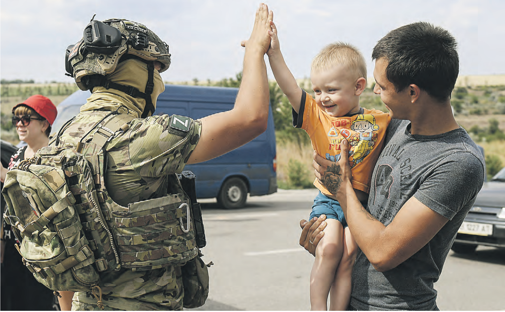
10 августа 16:43 Российский военнослужащий общается с мальчиком возле КПП «Васильевка» на границе Запорожской области. Через этот пункт пропуска тысячи людей приезжают на освобожденные от националистов территории

Сотрудники МЧС ДНР оперативно ликвидировали аварию. — Сейчас предельно допустимая концентрация аммиака в окружающей среде в пределах нормы, — заявили в ведомстве. Однако во время обстрела на территории завода находилось 32 человека. В результате один сотрудник завода погиб, еще четверо ранены. Тем временем в ДНР 38 мирных граждан подорвались на противопехотных минах «Лепестки», которые разбрасывают солдаты ВСУ. — Двое из них — дети. К сожалению, 12-летней малышка подорвалась на «Лепестке» се-