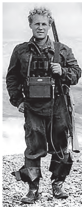
1957 год. Олег Куваев на Чукотке