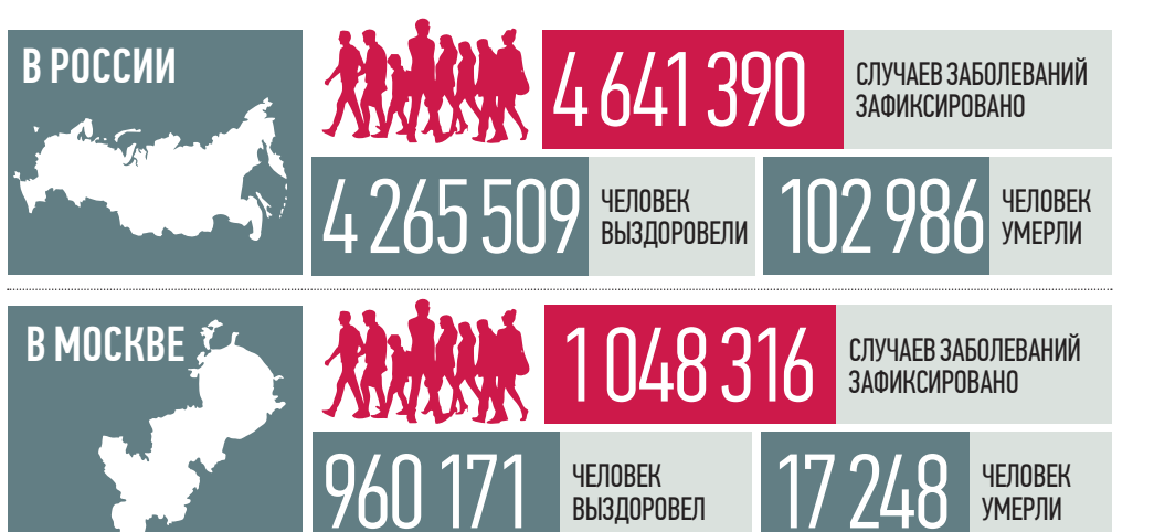
По данным стопкоронавирус.рф и mos.ru на 19:00 11 апреля

Мужчины старше 35 лет в два раза чаще женщин этого же возраста имеют осложнения после коронавируса и попадают в реанимацию, заявил в минувшую субботу министр здравоохранения России Михаил Мурашко. Он отметил, что необходимо помнить об этих рисках при принятии решения о вакцинации от коронавируса.