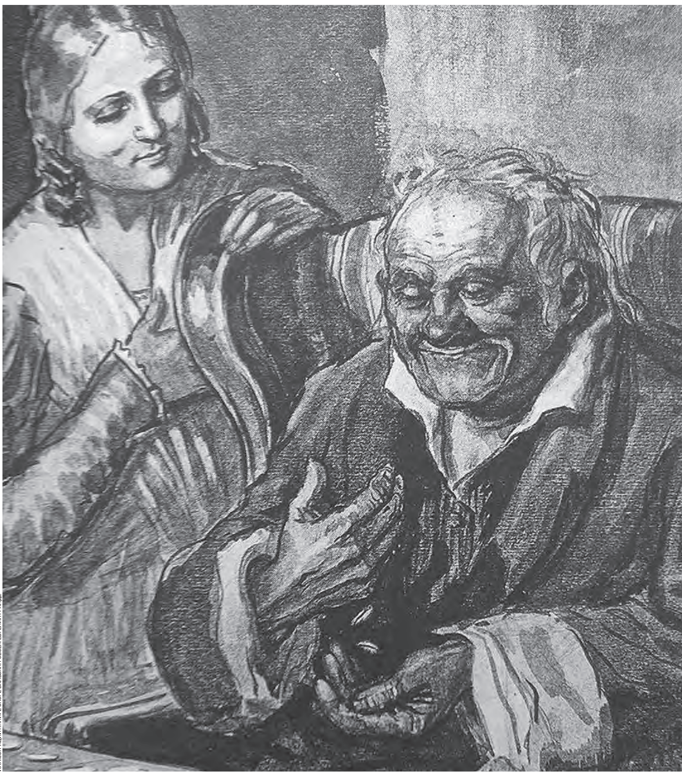
ИЛЛЮСТРАЦИЯ: НИКОЛА СЕРВЕВ. АКСАНДР ГОБЕК (СЕРВЕ) В СЕРИИ ГРАВЕ

Имя Гобсека, описанного Бальзаком в одноименном произведении, с 1830 года стало нарицательным для всех ростовщиков. Из-за скуности и жестности Гобсека называли «кекселем», хотя Бальзак и не отказывал ему в человечности полностью. Но современные ростовщики напрочь лишены сентиментальности.