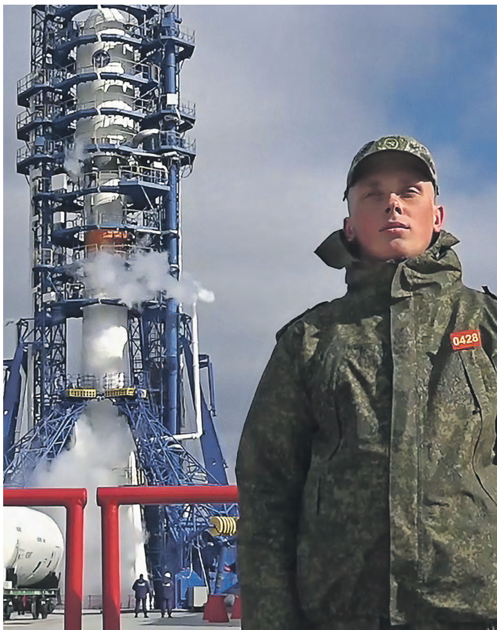
25 мая 2020 года. Ракета-носитель «Союз-2.1б» с космическим аппаратом Минобороны РФ перед запуском с космодрома Плесецк