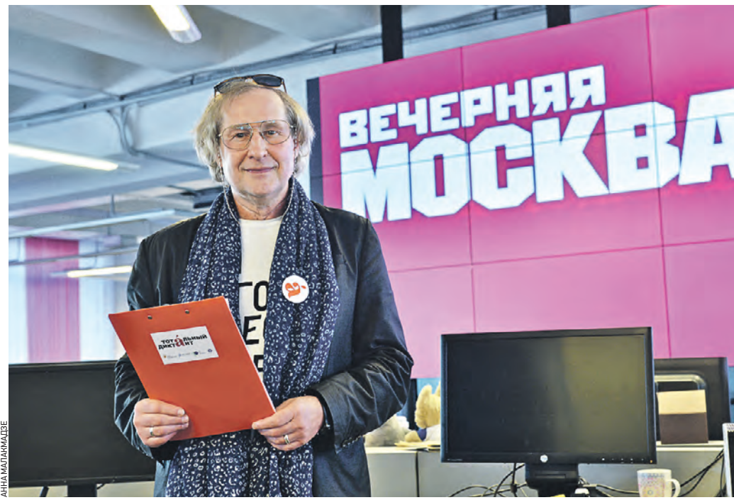
10 апреля 15:29 Народный артист России Андрей Житинкин продиктовал текст для участников «Тотального диктанта» в редакции «Вечерней Москвы»

В 2021 году, помимо офлайн-площадок, диктант можно было написать дистанционно. Текст на разных площадках читали на русском и английском языках. В день акции работали 1100 площадок по всему миру. В России диктант написали в 708 населенных пунктах, а за рубежом по проекту присоединились 200 городов из 59 стран.