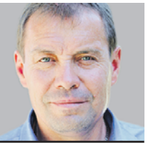
ВЯЧЕСЛАВ ЕКИМОВ ТРЕХКРАТНЫЙ ОЛИМПИЙСКИЙ ЧЕМПИОН ПО ВЕЛОСПОРТУ

Мой главный секрет в том, что Господь дал мне талант, а я не поленился его раскрыть. Талант мой, спасибо маме и отцу, был виден еще в детстве, когда я, десятилетний мальчишка, бегал по 25 километров в день. Из легкой атлетики я попал в велоспорт, который тогда больше напоминал забег с велосипедом по грязи. И в этом деле у меня было большое преимущество