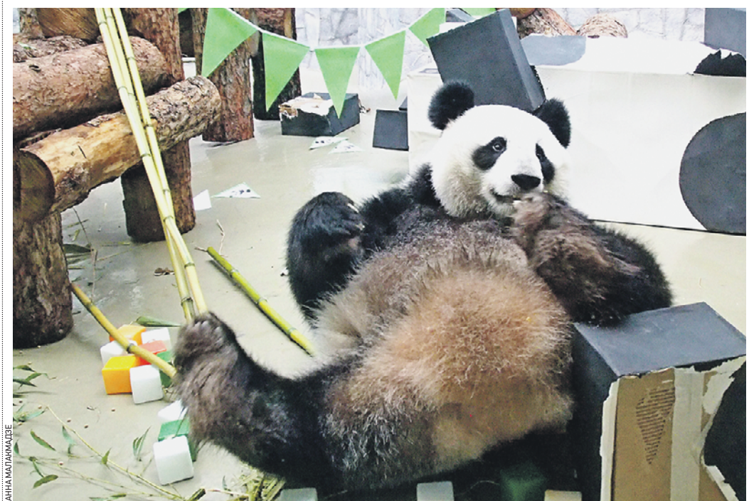
Вчера 15:04 Бамбуковый медведь Жуи, живущий в Московском зоопарке, отпраздновал День панд. Его вольер украсили флажками, а в подарок принесли угощения

18 марта 2020 года в китайском Национальном центре по разведению больших панд родились два детеныша бамбукового медведя. Это было нежданно, так как животные редко приносят потомство весной. Всего в мире насчитывается более 600 панд, обитающих в неволе. В зоопарках и питомниках они живут дольше, чем в дикой природе. На воле эти медведи доживают до 15–20 лет, а в зоопарке — почти до 40 лет.