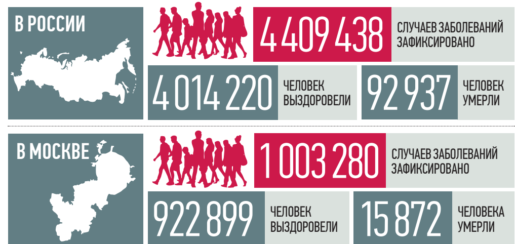
По данным стопкоронавирус.рф и mos.ru на 19:00 16 марта

Вчера на расширенном заседании комитета Госдумы по охране здоровья министр здравоохранения Российской Федерации Михаил Мурашко сообщил, что в России зарегистрирована тест-система для выявления ряда штаммов коронавируса, в том числе британского.