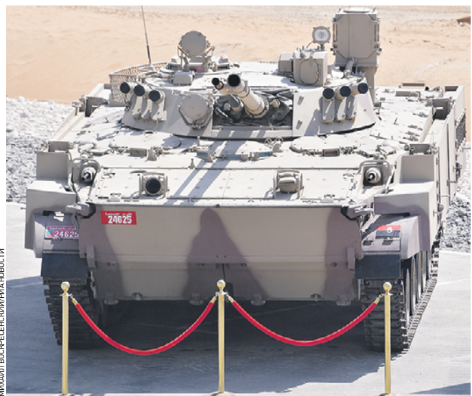
22 января 14:20 Российская боевая машина пехоты БМП-3 на выставке оборонной промышленности IDEX-2021

Он способен доставить на берег 14 полностью экипированных десантников. Двигатель мощностью 500 л.с. обеспечивает скорость движения по шоссе 70 км/ч и скорость плавания 10 км/ч. У нас еще продолжают госиспытания этой боевой машины, а к ней уже внимательно присматриваются за рубежом. Поэтому и было решено вывести БТ-3Ф в «большой свет». Плавающий гусеничный бронетранспортер создан на базе боевой машины пехоты БМП-3. Применение в конструкции БТ-3Ф серийно выпускаемых узлов и агрегатов существенно повышает его надежность, позволяет провести запуск боевой машины для морской пехоты в серийное производство в кратчайшие сроки. Простота конструкции бронетранспортера способствует быстрому освоению работы с ним экипажем практически любой квалификации. При этом созданный на «Курганмашзаводе», входящем