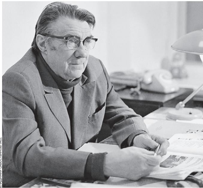
15 февраля 1978 года. На столе перед Борисом Полевым — гранки очередного номера журнала «Юность»