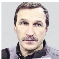
ГЕОРГИЙ БОБТ ОБОЗРЕВАТЕЛЬ

С другой стороны, на фоне экономической полустagnaции наметились меры, стимулирующие предпринимательство. Хотя и тут можно двинуть в противоположном направлении — в сторону ужесточения госрегулирования и увеличения прямых и косвенных налогов. В ближайшее время предстоит рассмотреть проект нового бюджета. Уже известно, что одной из главных статей расходов станут затраты на национальную безопасность и правоохранительную деятельность. Также будет увеличена помощь малому и среднему бизнесу, финансирование дорожного строительства. Расходы на образование и науку составят более триллиона рублей в год. Это внушительная сумма. Однако отставание в долях ВВП по этой статье (как и по статьям здравоохранения) от ведущих стран мира будет не сокращаться, а увеличиваться. Главное, что бюджет в ближайшие три года предусмотрено держать профицитным. Значит, сохраняются основные параметры экономполитики. И хотя по отдельным направлениям социальной политики (поддержка семей с детьми, прежде всего) ассигнования будут увеличены, в целом сам по себе факт бюджетного профицита не предполагает масштабного разворачивания как программ социальной поддержки населения, так и стимулирования экономики по той модели, которая пока преобладает в западных странах. Ключевое слово тут «стабильность» и избегание рисков больших кризисов. Собственно, за стабильность россияне и проголосовали.