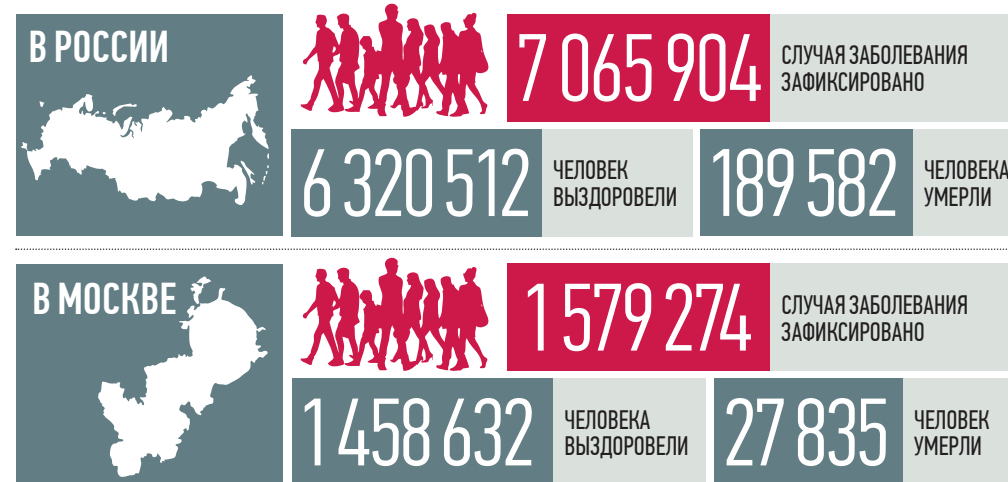
По данным стопкоронавирус.рф и mos.ru на 19:00 8 сентября

Дальнейшая эпидситуация в стране будет зависеть от отношения людей к вакцинации от коронавируса и формирования коллективного иммунитета, заявил вчера главврач больницы № 40 в Коммунарке Денис Проценко, напомнив, что прививка минимизирует риски попадания в госпитали при заболевании ковидом.