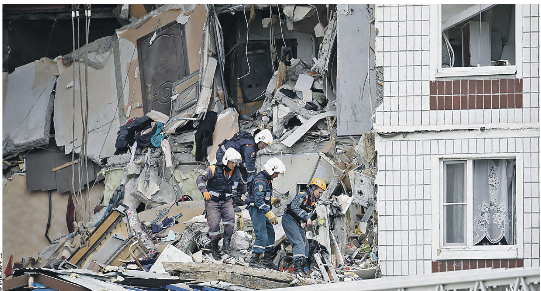
Вчера 10:11 Сотрудники МЧС России работают на месте происшествия в Ногинске. Там в девятиэтажном жилом доме произошел мощный хлопок газа. Спасатели разбирают завалы и ищут людей, которые могут находиться под ними

Момент происшествия попал в поле зрения городских камер видеонаблюдения. На кадрах видно, как часть жилого дома «вылетает» на тротуар. Обломки здания задели припаркованные рядом автомобили. — Рано утром я гуляла в парке «Волхонка» за километр от дома. И вдруг услышала грохот, — рассказывает Ольга Ганжара, председатель совета многоквартирного дома № 9а по улице 28 Июня, в котором случилось происшествие. — Когда прибежала к месту, увидела: четыре квартиры буквально вывалились, с торцевой стороны дома выпала стена. МЧС и скорая помощь, по словам Ольги Ганжары, были на месте спустя 10 минут. Они сразу начали спасать постра-