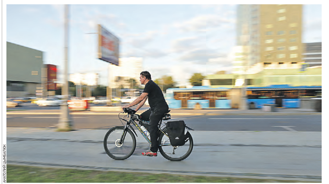
22 августа 19:17 Все больше москвичей, ответственно относящихся к природе, используют в качестве личного транспортного средства велосипеды и самокаты