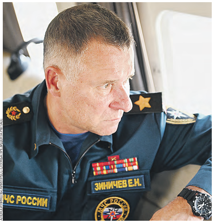
6 августа 16:18 Глава МЧС России Евгений Зиничев во время облета Челябинской области

РЕДАКЦИЯ «ВЕЧЕРНЕЙ МОСКВЫ» ВЫРАЖАЕТ СОБЛЕЗОВАНИЯ РОДНЫМ И БЛИЗКИМ ЕВГЕНИЯ НИКОЛАЕВИЧА ЗИНИЧЕВА И АЛЕКСАНДРА ВЛАДИМИРОВИЧА МЕЛЬНИКА.