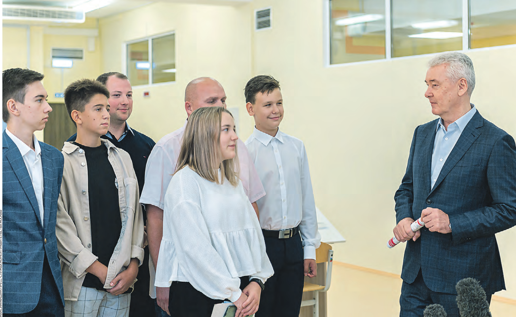
Вчера 12:05 Мэр Москвы Сергей Собянин (справа) пообщался с родителями и учениками новой школы, которую построили в Щербинке. Корпус рассчитан на учеников 6–11-х классов. Здесь есть большая аудитория для лекций, а кабинет информационных технологий можно превратить в IT-полигон

Всего в учебном заведении четыре этажа. В кабинетах физики, химии и биологии оборудованы пространства для проведения практических занятий. Кроме того, лекции по естественно-научным предметам будут проходить в специальной аудитории. Возможности класса информационных технологий позволяют на его базе развернуть IT-полигон. Также в школе есть два спортивных зала, кабинеты технического черчения и моделирования, иностранного языка и другие. Подготовиться к урокам ребята всегда смогут в библиотеке-медиацентре с читальным залом.