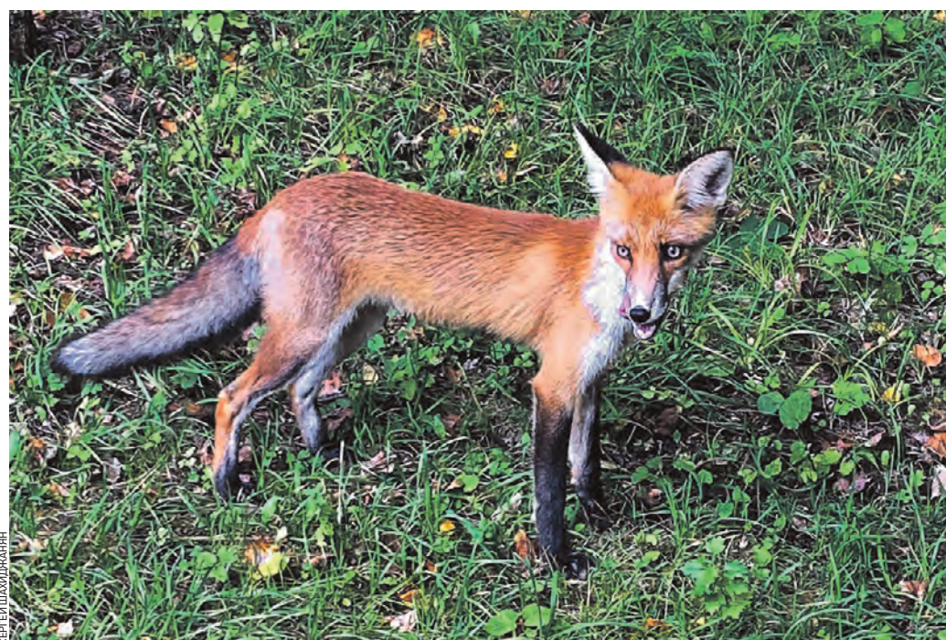
20 августа 15:54 В Измайловском парке москвичи заметили лису. Она уверенно обходит облюбованную ею территорию и совершенно не боится людей