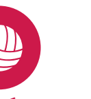
кеды и бутсы

Год назад ни одному из столичных клубов не удалось завоевать трофей турнира. На этот раз перед каждым из участников стоит именно такая задача. Расширилась география участников. В турнире сыграют две команды с Востока: хабаровский «Амур» и «Куньлунь» из Китая. Учитывая новую систему проведения турнира (две группы по три команды), возможен вариант, что впервые в истории мы не увидим, пожалуй, самое принципиальное дерби между ЦСКА и «Спартаком».