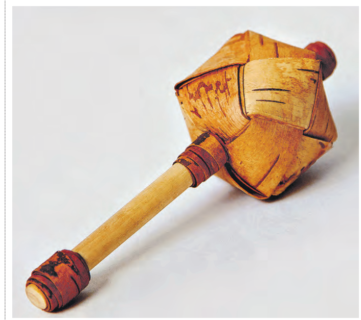
Такой шаркунок по аналогии с древней игрушкой народные умельцы плетут из бересты в наши дни