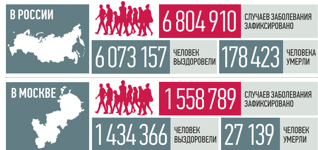
По данным стопкоронавирус.рф и mos.ru на 19:00 25 августа