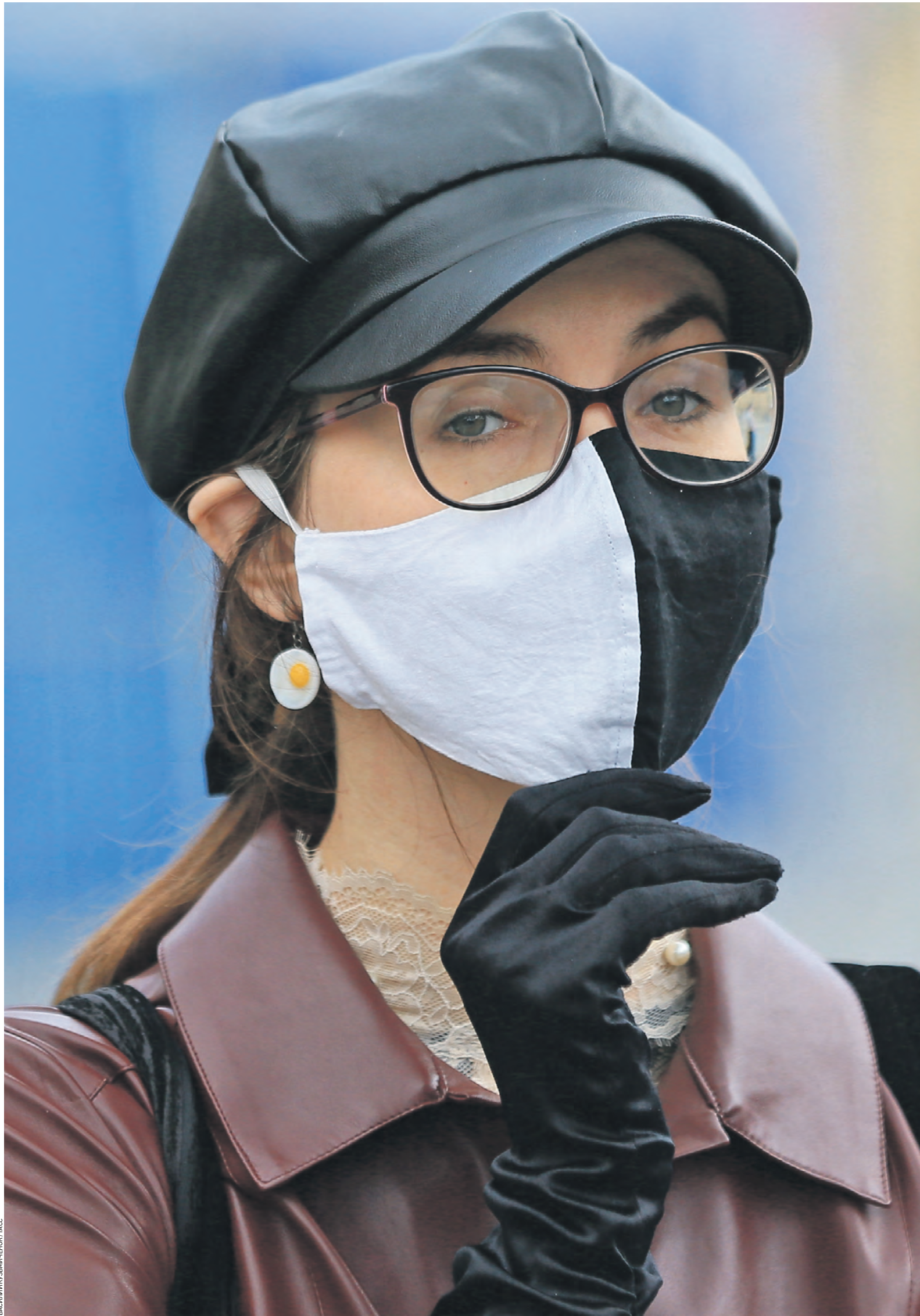
6 июня 2020 года. Девушка в маске «с претензиями» на фестивале «Красная площадь». Что может быть проще этого средства защиты? Но поиграли и с ним...