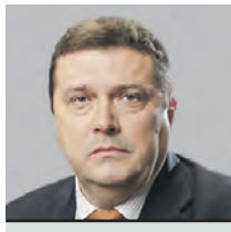
ВЛАДИМИР СОЛОВЬЕВ ПРЕДСЕДАТЕЛЬ СОЮЗА ЖУРНАЛИСТОВ РОССИИ

Я уверен, что по крайней мере при нашей жизни печатная пресса останется, несмотря на то, что повсюду наступает цифровизация. Конечно, сегодня сложно представить себе печатную газету без интернет-версии. Речь идет об издании любого уровня. Тем не менее печатные средства массовой информации — наша опора. В более отдаленной перспективе они, возможно, станут чем-то более элитарным. Ведь есть люди, которые привыкли начинать утро с чашки кофе и любимой газеты. Еще печатные СМИ очень востребованы в районном формате. Тиражи таких газет во многих странах мира растут. Потому что чем выше уровень жизни, тем более интересны горожанам события, которые происходят вокруг. Останутся, конечно, и газеты бесплатного формата — с программой телевидения, рекламой и обзорами. Очевидно, что печатным СМИ не угнаться за интернетом в плане оперативности. Поэтому многие издания перешли на еженедельный формат работы. Газеты и журналы в 2020 году пережили очень тяжелые времена. Несколько серьезных изданий даже временно приостановили выпуск печатной версии. Но этот кризис мы преодолели.