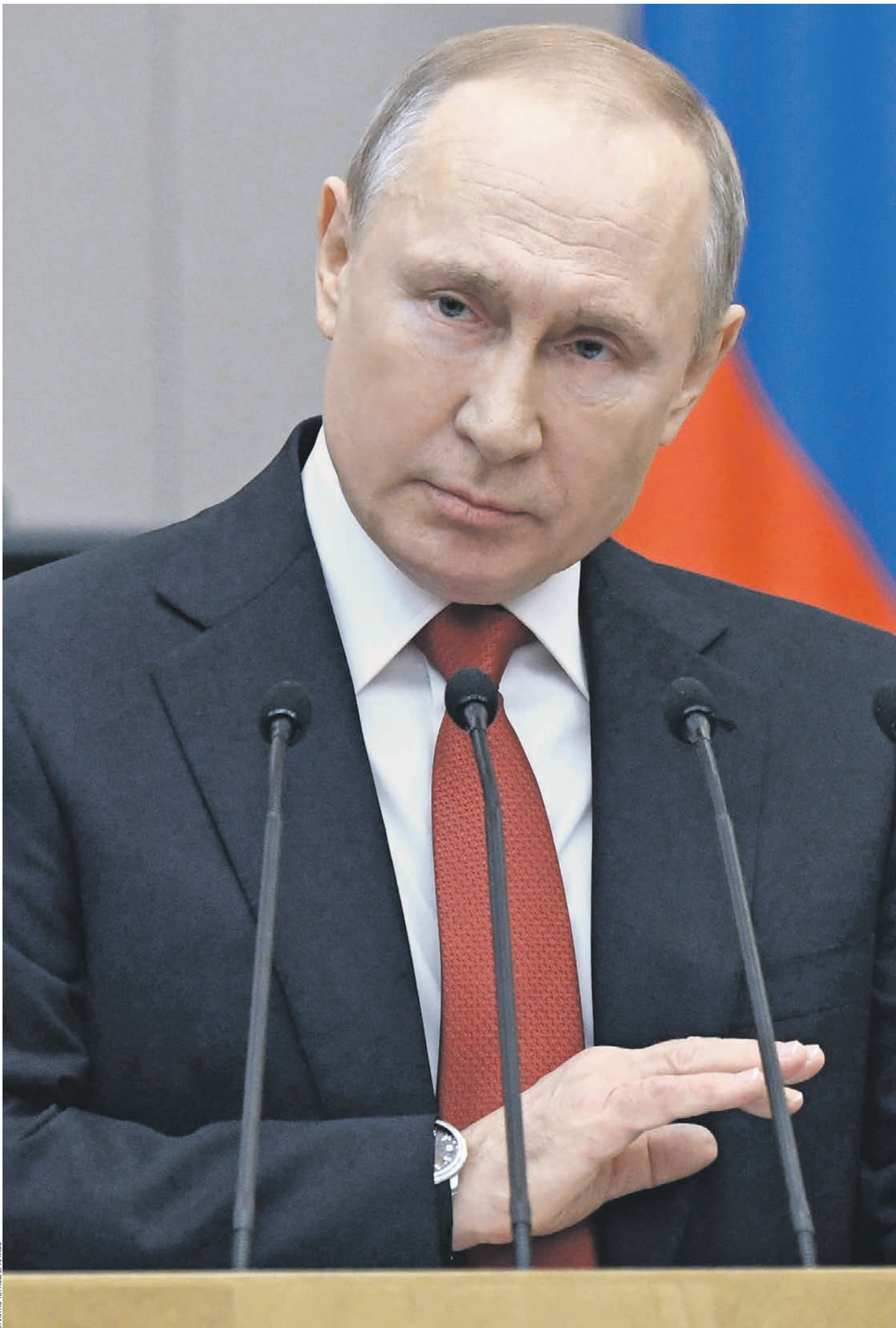
10 марта 2020 года. Президент Владимир Путин во время выступления в Госдуме, на котором состоялось второе чтение поправок в Конституцию

рачительно. Вот здесь он работает, а вот тут уже нет. И это, повторю, опасно. Это не преступление, это хуже. Это ошибка. Георгий Бовт уверен: