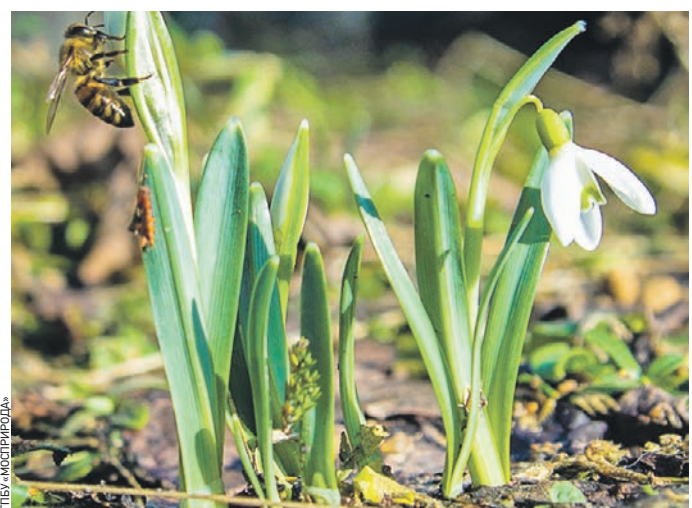
Вчера 12:30 В парке «Лосиный Остров» уже можно увидеть подснежники и другие первоцветы