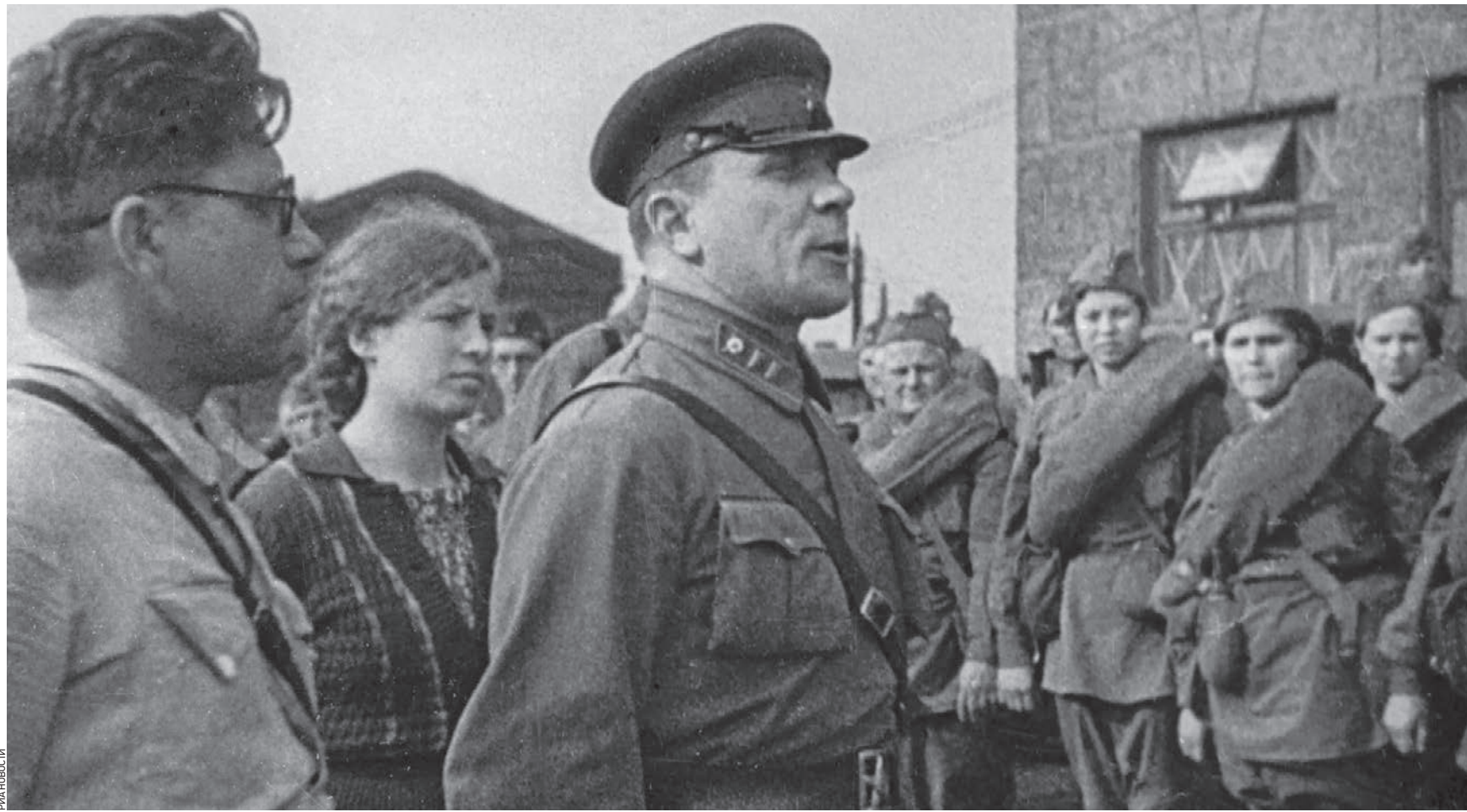
1 сентября 1941 года. Кадр из документального фильма «Москвичи в 1941 году». Командир выступает с речью перед ополченцами, перед тем как бойцы отправятся на фронт защищать Родину