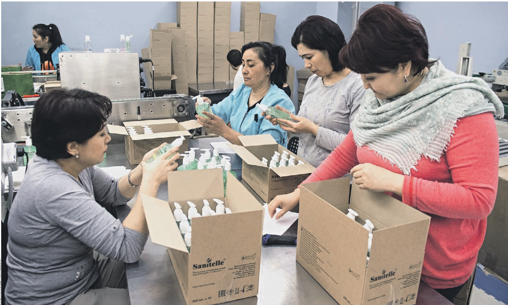
23 марта 14:45 Упаковщицы антисептического средства на производственной линии на предприятии в Москве. На данный момент эта продукция пользуется повышенным спросом у покупателей, поэтому производственные мощности предприятия не снижаются, а, наоборот, увеличиваются

Оперативный штаб по мониторингу работы промпредприятий создан при Департаменте инвестиционной и промышленной политики Мос квы. Сотрудники штаба теперь отслеживают проблемы с поставками и запасами сырья на предприятиях, средств индивидуальной защиты и дезинфекции для обеспечения безопасности сотрудников. Они также мониторят угрозы, которые могут вести к приостановке деятельности завода или снижению объемов производства. Корреспонденты «ВМ» обратились к ряду глав столичных предприятий, выяснив, какие изменения затронули их коллективы. — Мы в соответствии с указом мэра города ввели температурный контроль в компании, при малейших подозрениях на какие-то заболевания в виде ОРВИ или недомогания отправляем сотрудников домой и снабжаем их всем необходимым, чтобы они могли работать удаленно, — рассказывает Андрей Добродеев, генеральный директор завода по производству насосного