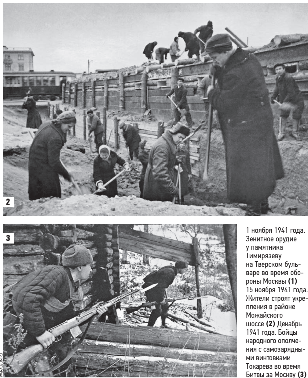
1 ноября 1941 года. Зенитное орудие у памятника Тимирязеву на Тверском бульваре во время обороны Москвы (1) 15 ноября 1941 года. Жители строят укрепления в районе Можайского шоссе (2) Декабрь 1941 года. Бойцы народного ополчения с самозарядными винтовками Токарева во время Битвы за Москву (3)