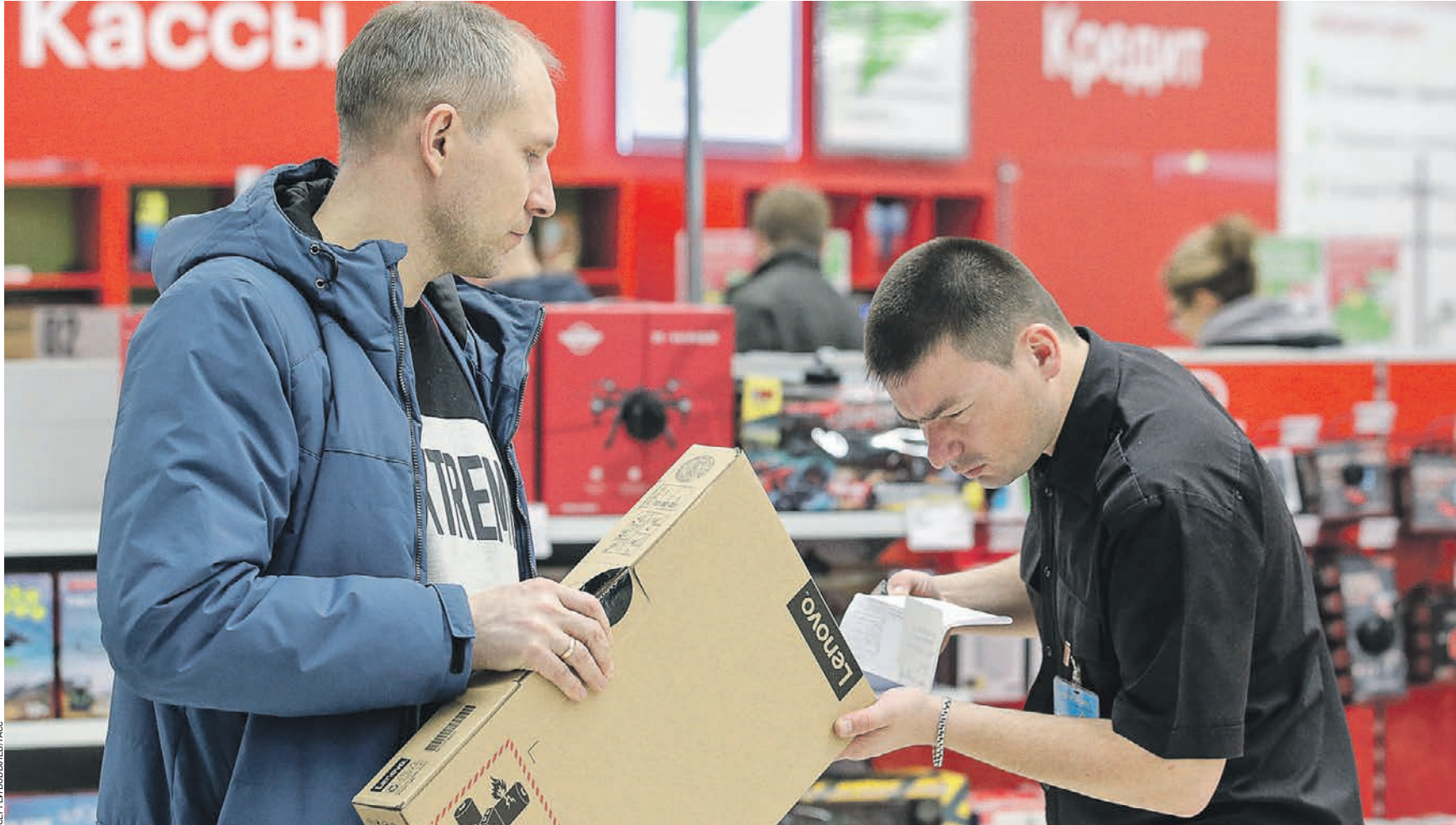
20 марта 11:00 Житель Москвы выбирает себе новый ноутбук в магазине бытовой техники и электроники. Его работодатель, как и многие другие, перевел подчиненных на удаленный режим работы. Продавцы довольны: в последние дни они отмечают повышенный покупательский спрос именно на эту категорию товаров

ажитаж Поставщики техники предупредили о возможном дефиците ноутбуков и морозильных камер. Как обстоят дела на самом деле, разобралась «ВМ».