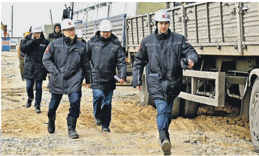
21 марта 10:43 Заммэра Москвы по вопросам градостроительной политики и строительства (слева) Андрей Бочкарев на площадке будущего инфекционного центра

Вчера строители приступили к монтажу внутренних инженерных систем и отделочным работам в корпусах коронавирусного инфекционного центра, который сейчас возводится в Новомосковском округе столицы.