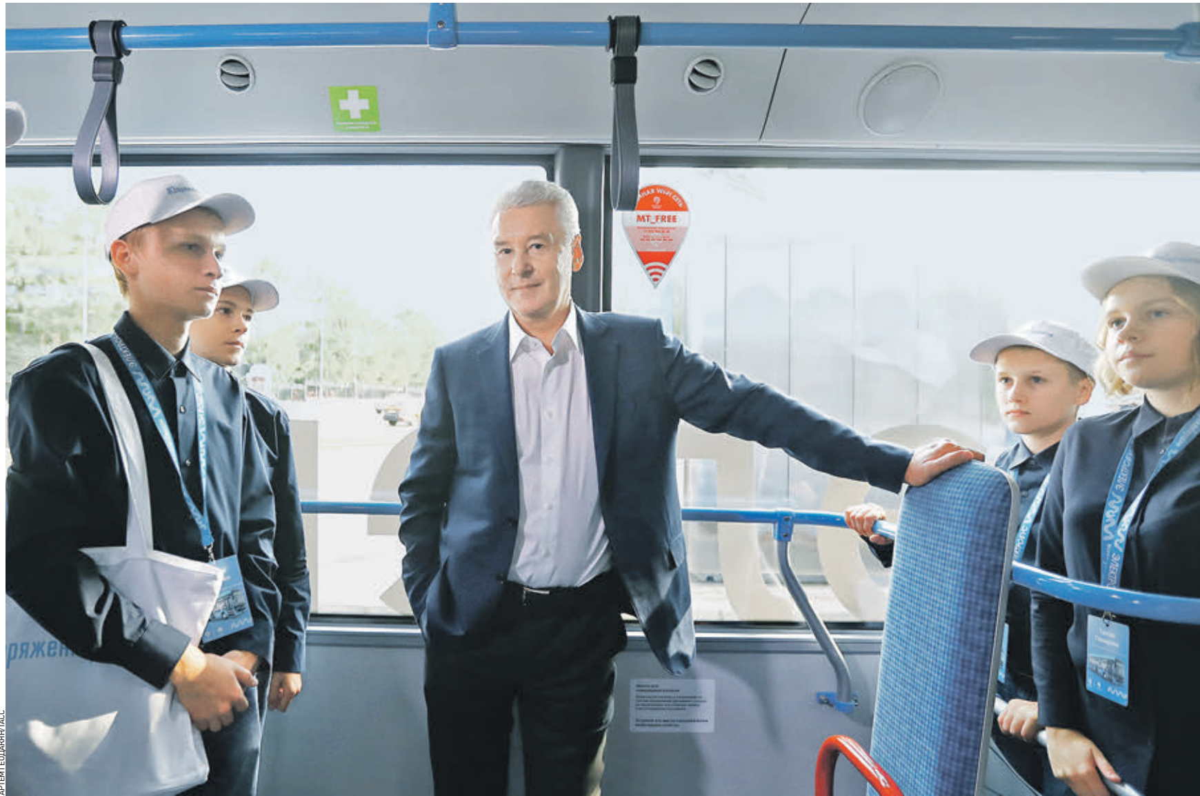
1 сентября 2018 года. Мэр Москвы Сергей Собянин (в центре) во время тестового запуска первого электробуса на ВДНХ, который курсирует по маршруту «6-й микрорайон Бибирева» — «ВДНХ (южный вестибюль)»

Мэр столицы также рассказал, что в Москве на сегодняшний день самый молодой в Европе парк автобусов. Приобрести власти планируют еще 1541 автобус экологического класса Евро-5.