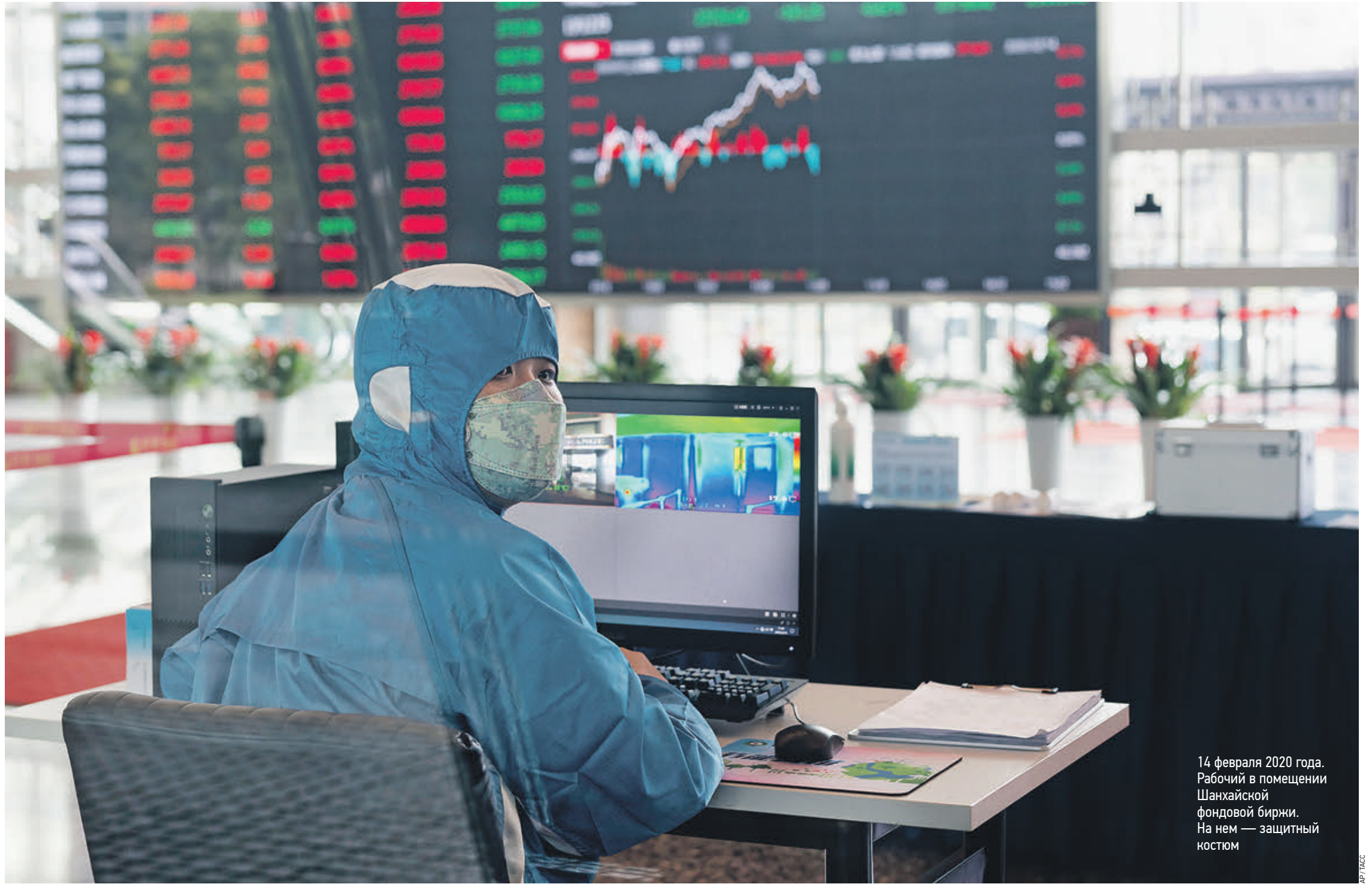
14 февраля 2020 года. Рабочий в помещении фондовой биржи. На нем — защитный костюм

Другое дело — испытание вакцины, ее последующее тестирование. Оно необходимо, чтобы проверить ее безопасность и эффективность. Как правило, тестирование на животных занимает длительный период времени — от полутора и более. Ведь сначала нужно провакцинировать животных, а потом заразить их этим вирусом, чтобы понять, насколько эффективна и безопасна созданная вакцина: понять схему вакцинации, определить, не вызывает ли она каких-либо поздних осложнений, и так далее. Сама новость о том, что вакцина придумана, прекрасна. Но есть высокая вероятность, что к тому моменту, когда ее запустят в производство и смогут применять, вспышки заболевания сойдут на нет. По прогнозам, вспышки коронавируса прекратятся. Учитывая летальность заболевания, которая составляет 2 процента числа заболевших, может встать вопрос об актуальности этой вакцины. Да, 2 процента тоже немало, но по сравнению с тем же самым гриппом, от которого ежегодно умирают десятки тысяч людей даже при наличии эффективной вакцины, в актуальности вакцины от коронавируса к тому времени могут возникнуть сомнения. Предыдущие типы коронавируса по летальности были еще серьезнее, но даже они не были такими серьезными, как грипп.