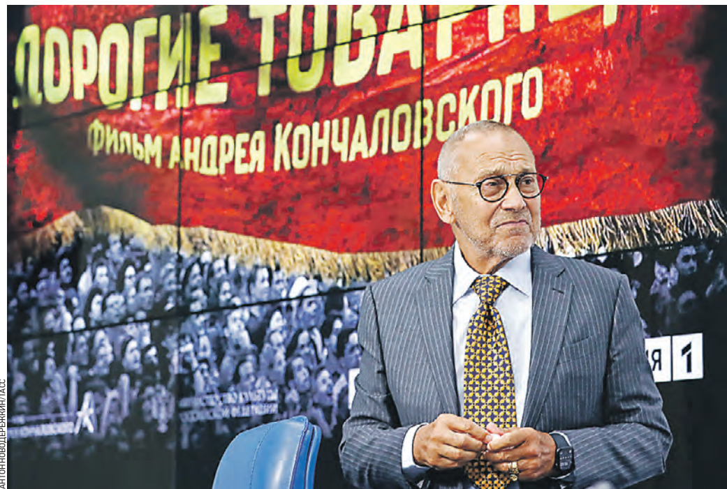
Вчера 15:42 Режиссер, продюсер и сценарист Андрей Кончаловский на пресс-конференции представил фильм «Дорогие товарищи!», который выйдет в прокат 12 ноября

Первый показ фильма состоялся в рамках 77-го Венецианского кинофестиваля. Картина удостоилась специального приза. Фильм «Дорогие товарищи!» также оценили на 56-м Международном кинофестивале в Чинго, где он получил награду «Серебряный Хьюго» за лучшую режиссуру.