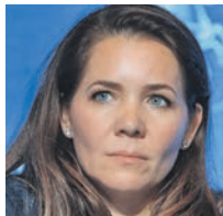
АНАСТАСИЯ РАКОВА ЗАМЕСТИТЕЛЬ МЭРА МОСКВЫ ПО ВОПРОСАМ СОЦИАЛЬНОГО РАЗВИТИЯ

Продолжается масштабное тестирование горожан, причем всеми доступными способами. За счет этого мы имеем возможность определить долю заболевших. Мы используем как ПЦР, так и ИФА-диагностику. На сегодняшний день мы сделали 2,8 миллиона ПЦР-тестов и 600 тысяч исследований на антитела. И могу сказать, что в течение месяца доля заболевших по этим двум видам тестирования стала уменьшаться. Если изначально по ПЦР-диагностике было 2,4 процента заболевших, то сегодня этот показатель составляет 1,8 процента. По методике на основании иммуноглобулинов изначально у нас было 3,9 процента заболевших, сейчас — 3,6 процента. Разница между значениями в этих двух системах объясняется тем, что по ПЦР-диагностике мы определяем наличие вируса, как правило, на первом этапе, а на основании антител захватываем более длительный период, поэтому увеличивается количество заболевших. Отмечу, что мы запустили вместе с работодателями проект, согласно которому они могут выбрать любую модернизацию, заключить с ней договор о проведении исследования, которое будет осуществлено полностью за счет средств города. Этот сервис уже доступен на сайте Департамента здравоохранения.