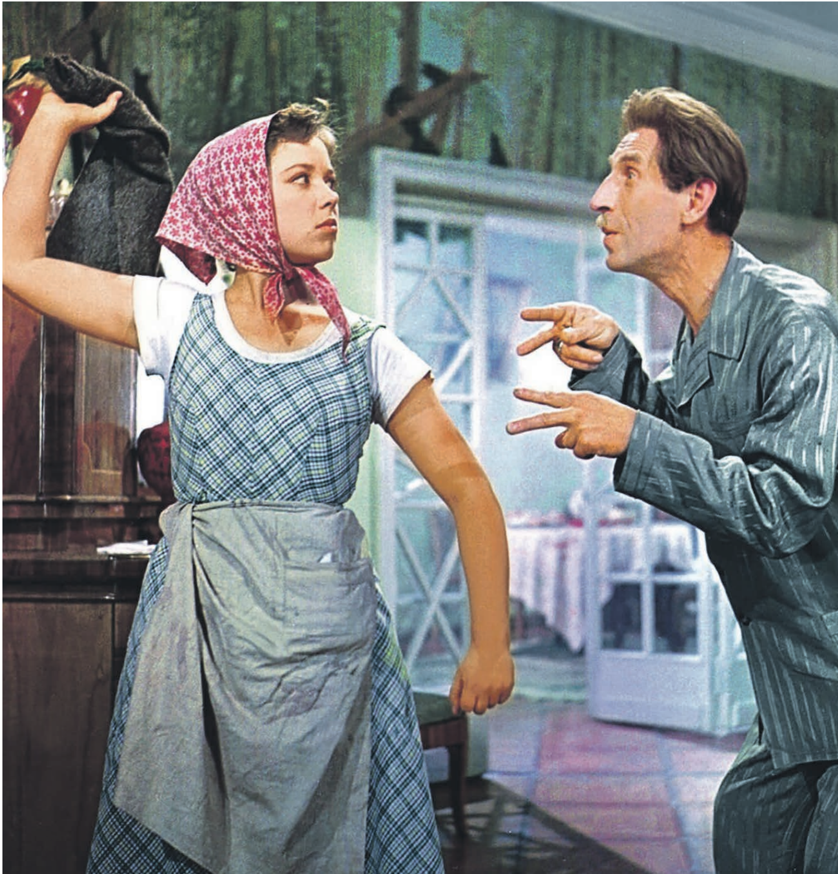
Кадр из фильма Эльдара Рязанова «Девушка без адреса» (1957 год). Светлана Карпинская в роли Кати Ивановой и Сергей Филиппов в роли Масина, начальника строительной конторы Василия Никодимича Номаринского

вич. — Но человек, не поддавшийся гордыне, не будет делать вид, что незнаком с бывшим коллегой после пересаживания в «высокое кресло». Он может общаться с ним меньше в силу занятости, нового круга обязанностей, но перестановка не поменяет его качественно, не превратит в высокомерного и чванливого «гуса». Важно понимать — ставший заложником гордыни человек не понимает, как заметны для окружающих перемены в его поведении и насколько они смешны.