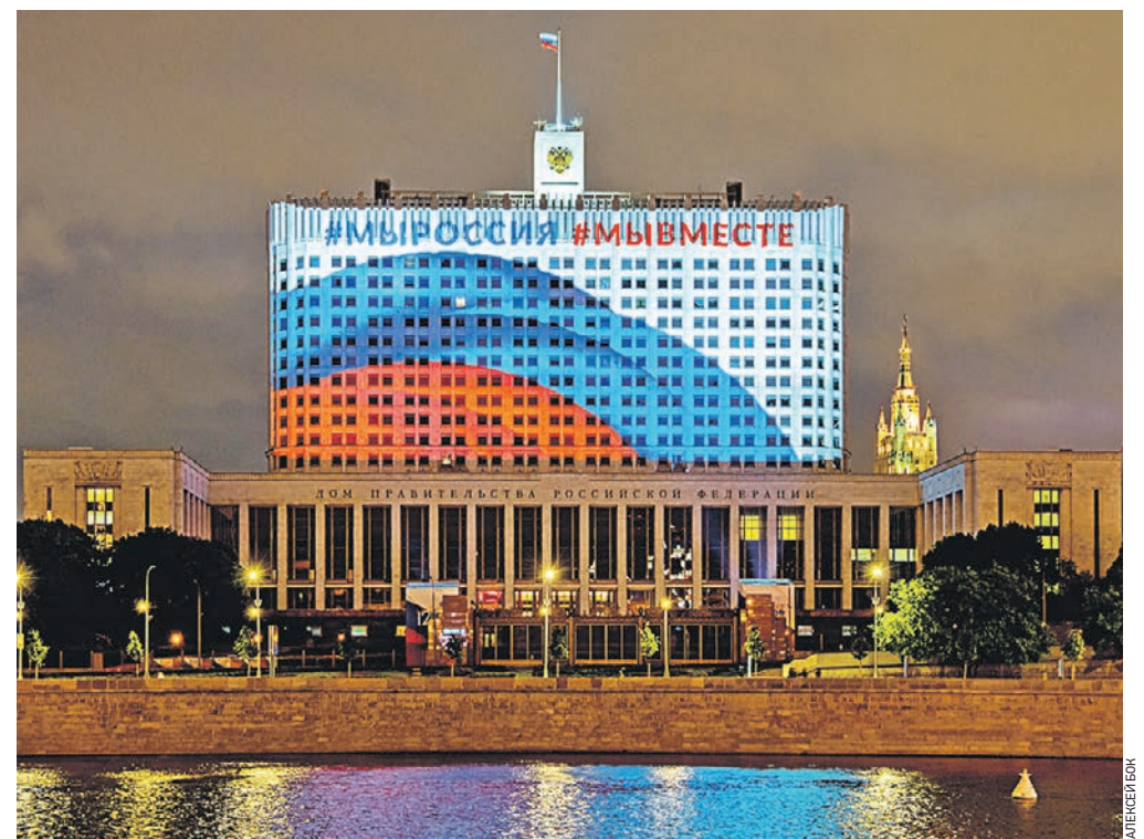
12 июня 22:15 Осад здания правительства РФ на Краснопресненской набережной украсили изображением российского триколора

ПАВЕЛ КРАСНОРУЦКИЙ ПРЕДСЕДАТЕЛЬ РОССИЙСКОГО СОЮЗА МОЛОДЕЖИ 12 июня мы чествуем страну с тысячелетней историей и уникальным наследием — нашу Родину, Россию! В своих произведениях ее воспевали поэты, музыканты, художники. Именно Россия подарила миру большое количество великих людей, которые навсегда изменили ход мировой истории. Это сильная держава, которая соединяет большое количество народов с разными традициями и культурами. И величие страны складывается из успехов каждого из нас.