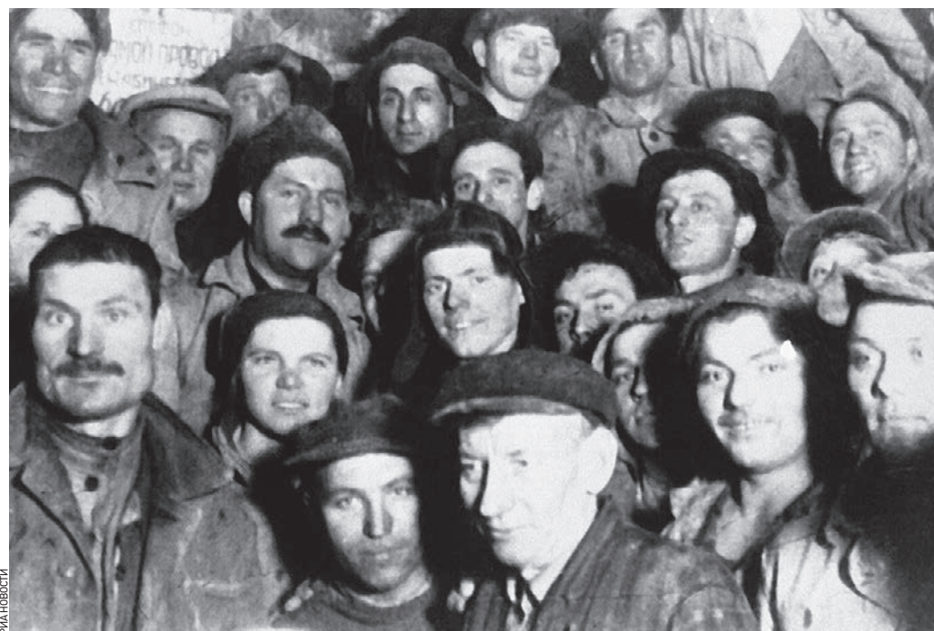
15 февраля 1934 года. Председатель комиссии партконтроля Лазарь Каганович (третий слева в верхнем ряду) и первый секретарь МКГ Никита Хрущев (второй слева в верхнем ряду) среди метростроителей

КОНСТАНТИН ЧЕРКАССКИЙ ДИРЕКТОР НАРОДНОГО МУЗЕЯ МОСКОВСКОГО МЕТРОПОЛИТЕНА Центр Москвы в начале 30-х годов прошлого века был очень непохож на то, что мы видим сегодня. Перед Большим театром ходили трамваи. Это были настоящие поезда, состоявшие из трех вагонов, поскольку двух было очень мало, чтобы развезти всех пассажиров. В центре города был настоящий транспортный хаос.