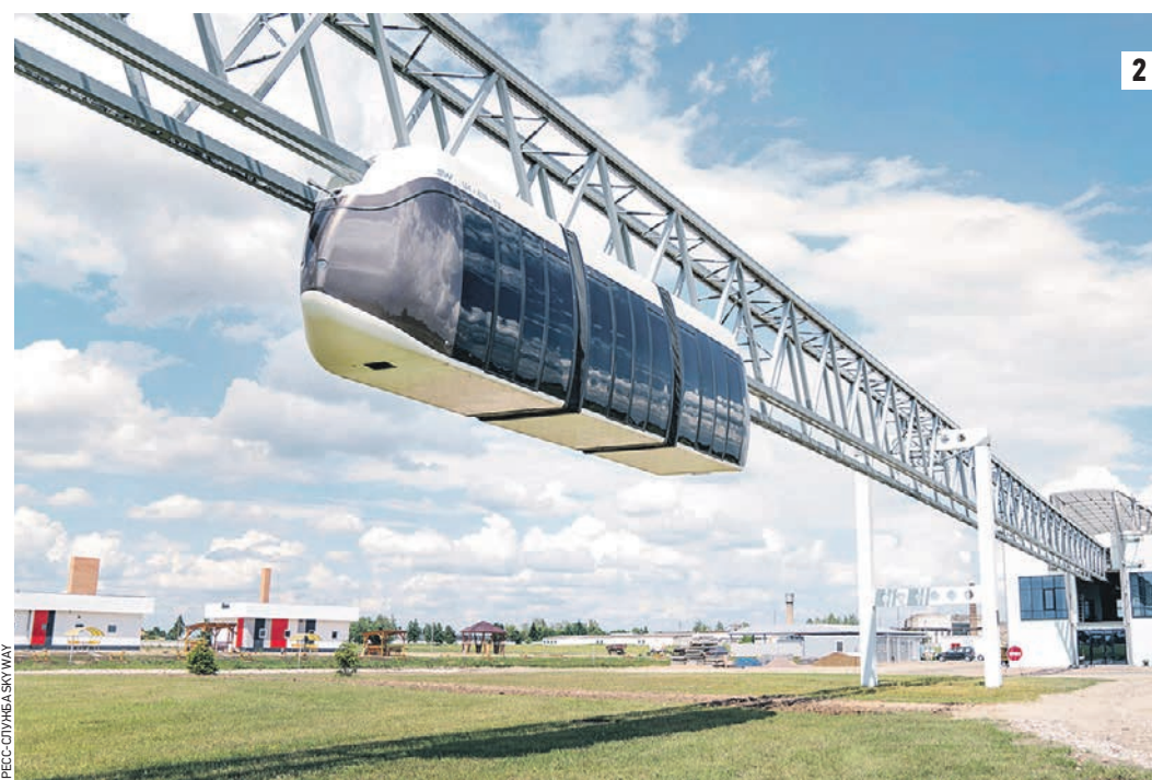
2019 год. Анатолий Юницкий (1) Так будет выглядеть транспортная система, которую разрабатывает российский инженер: уже спроектировано 11 типов машин, идея струнного транспорта продолжает развиваться (2)

Анатолий Юницкий (родился 16 апреля 1949 года) — советский, белорусский и российский инженер (с 1972 года), изобретатель (с 1977 года) и предприниматель (с 1988 года). Автор более 140 изобретений (половина из них сделана в советское время, во многих случаях — в соавторстве с другими инженерами, 30 из которых реализовано в народном хозяйстве СССР с суммарным экономическим эффектом, превышающим 100 миллионов советских рублей), 18 научных монографий и более 200 научных работ. Разработчик проекта Струнного транспорта Юницкого (СТЮ). Автор концепции нерасчетной транспортной системы (с 1977 года) для освоения околоземного космического пространства — Общепланетарного транспортного средства (ОПС). Член Федерации космонавтики СССР (с 1986 года). Член общественной организации Российской академии естественных наук (с 2000 года). Автор более 200 патентов на изобретения, в том числе за рубежом.