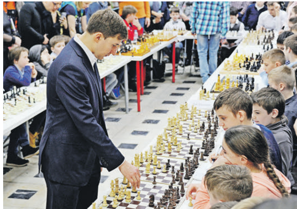
Вчера 16:34 Гроссмейстер Сергей Карякин в Московском доме книги провел с юными шахматистами сеанс одновременной игры

Эксперимент по электронному голосованию в Москве — это революция в избирательных технологиях. Мы даем москвичам право проголосовать электронно, если они будут на дачах, в командировках, на отдыхе в других регионах и странах. Удаленное голосование позволит полностью обеспечить право избирателей на волеизъявление. Уверен, эксперимент пройдет успешно.