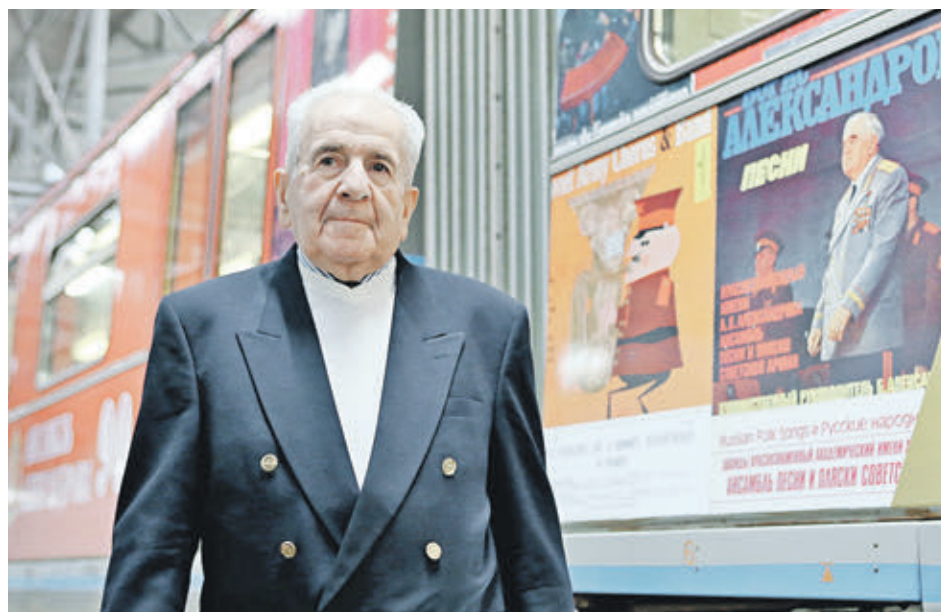
Вчера 15:41 Заслуженный артист России, ветеран ансамбля песни и пляски Российской армии имени Александра Александровича Кадникова на церемонии запуска именной линии Московского метрополитена, посвященной 90-летию творческого коллектива.