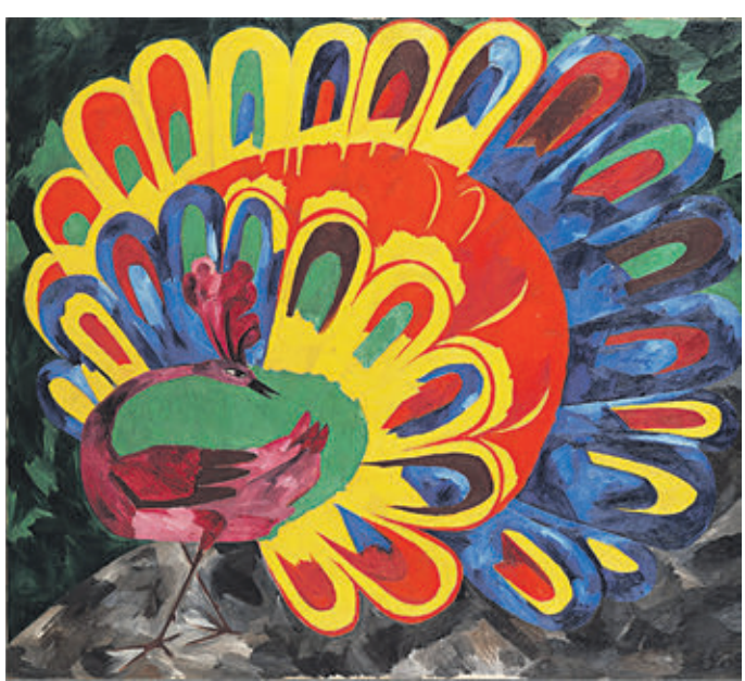
Картина Натальи Гончаровой «Павлин под ярким солнцем (стиль египетский)»