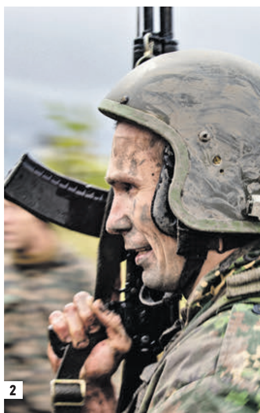
1 марта 2014 года. Жители Симферополя фотографируются с военнослужащим (1) 5 октября 2018 года. Сотрудник ФСИН во время испытаний на право ношения крапового берета (2)