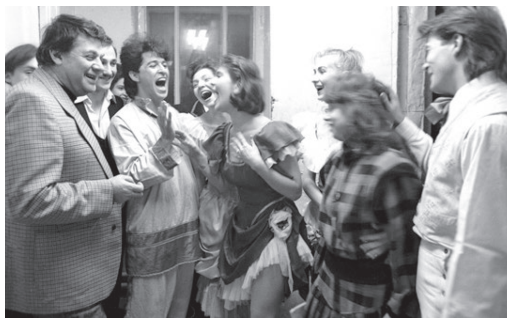
1 февраля 1990 года. Народный артист РСФСР Александр Ширвиндт (крайний слева) со студентами театрального училища имени Бориса Щукина перед началом спектакля

Вчера в Театральном училище имени Б. В. Щукина по случаю его юбилея прошел праздничный концерт. На него по традиции приглашали выпускников и почетных гостей.