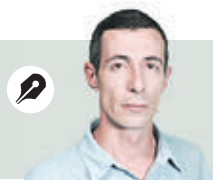
МИХАИЛ ВИНОГРАДОВ специальный корреспондент

Специальные части в структуре Вооруженных сил РФ занимают численно не такое уж и большое место. Так, военнослужащих ВДВ всего около 45 тысяч человек. «Черных волков» во всех пяти бригадах и батальонах морской пехоты всего чуть более восьми тысяч человек. Чуть большее число служит в пограничных частях ФСБ России — около 100 тысяч человек. С учетом, что они стерегут 60 тысяч километров сухопутной и морской границы, это не так много.