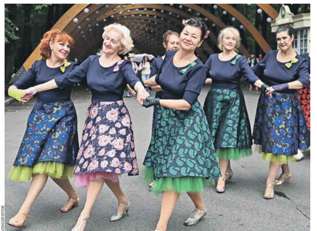
25 июля 12:10 Участники программы «Московское долголетие» принимают участие в танцевальном марафоне в парке «Сокольники»