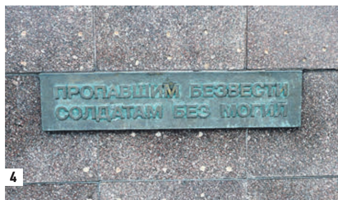
1 июля 2014. Памятник «Прощание славянки» у здания Белорусского вокзала (1) 22 сентября 2017 года. Фрагмент памятника «Прощание славянки» у Белорусского вокзала (3) 5 сентября 2014 года. Ошибка на бронзовой табличке памятника солдатам, пропавшим без вести, который установлен на Поклонной горе (4)

при незначительном утяжелении памятника электроцепь не разомкнулась. Ай да немцы, обеспечили защиту «вождю»! А вот от стараний горе-реставраторов в приамурском селе и простые сельчане схватились за голову. На железном щите мемориала героям Великой Отечественной после реставрации появились солдаты НАТО с американскими автоматами. Картинку скачали из интернета. Вскоре фальшивые «декорации» запыжились. Воинствующий непрофессионализм проявился во всем. О том, что с нашим образованием творится странное, говорит давно. «История» вызывает самые ярые споры. — Из социальных сетей школьники черпают необходимую им информацию, — рассказывает Наталья Ра-