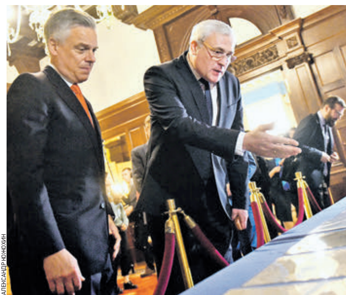
Вчера 15:53 Замруководителя Росархива Андрей Юрасов (справа) рассматривает возвращенные документы с послом США в России Джоном Хантсманом

— В 2014 году мы получили информацию от Министерства культуры России, что документы исторической важности были выставлены на аукционе в США, — рассказала Кэти Бей. — Выяснилось, что 16 указов за подписью Николая II были похищены из Российского государственного исторического архива в Санкт-Петербурге в 1994 году. Разграбленные культурные ценности являются одной из старейших форм трансграничной организованной преступности. Благодаря взаимодействию с российской стороной нам