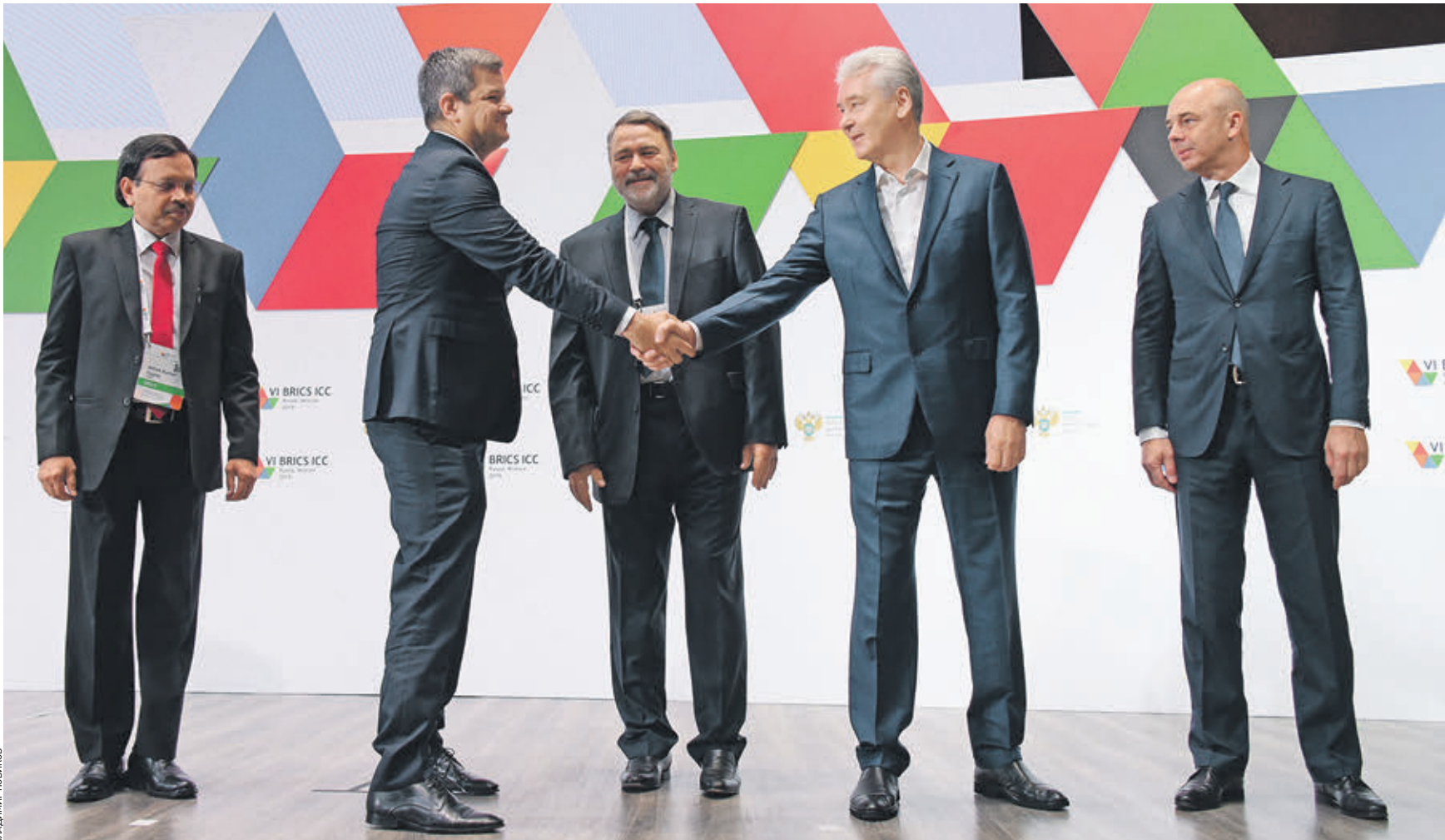
Вчера 10:07 Участники VI Конференции по конкуренции под эгидой БРИКС (слева направо): руководитель комиссии по конкуренции Индии Ашок Кумар Гупта, президент Административного совета по экономической защите Бразилии Александре Баррето де Соуза, руководитель Федеральной антимонопольной службы РФ Игорь Артемьев, мэр Москвы Сергей Собянин и первый заместитель председателя правительства России, министр финансов Антон Силуанов на церемонии открытия

Необходимо развитие Москва является конкурентной площадкой, насыщенной инфраструктурой, кадрами, материальными, финансовыми ресурсами. Сергей Собянин отметил, что в странах БРИКС мегаполисы являются драйверами экономики, науки, образования. — В ближайшие годы крупнейшие города мира будут обеспечивать половину валового экономического продукта — это требует развития городов, серьезного осмысления, — сказал мэр Москвы. Глава города поблагодарил руководителя Федеральной антимонопольной службы России Игоря Артемьева за вклад в создание современного законодательства в об-