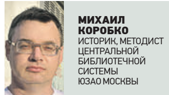
НЕ МОГУ МОЛЧАТЬ

Кстати, в Москве закон, обязывающий установку памятников согласовывать со специальной комиссией, существует. Но несмотря на него, возникает масса случаев, когда памятники появляются на наших улицах в обход этой комиссии. Если даже комиссия не дает разрешение на установку памятника, предприимчивые люди устанавливают его в рамках работ по благоустройству того же двора, прилегающей к нему улицы. У метро «Академическая» есть такой ужасный дворик, где стоит памятник Тютчеву. Или еще один такой пример — памятник генералу Ермолову в районе Коньково. По-моему, очень низкого качества. Скульптуру причисляют к садово-парковому комплексу. Многие местные чиновники, главы управ считают себя полноправными хозяевами подведомственных территорий. С другой стороны, ряд владельцев зданий, арендаторов тоже считают себя вправе устанавливать на придомовой территории все, что им вздумается, ни с кем не согласовывая. Бывают и хорошие идеи. Например, в санатории «Узкое» поставили памятник ветеранам. Но место выбрали неудачное, партер усадебного парка. Согласования опять не было. Пока ряд органов, ответственных организаций и структур не начнут жестко пресекать подобное самоуправство, порядка не будет.