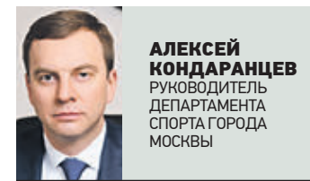
АЛЕКСЕЙ КОНДАРАНЦЕВ РУКОВОДИТЕЛЬ ДЕПАРТАМЕНТА СПОРТА ГОРОДА МОСКВЫ

Замечу, что Московский марафон — это не просто обычный забег. Я бы назвал его настоящим забегом-экскурсией. Впору в следующем году привлечь к нему профессиональных гидов. Дело в том, что, стартуя в «Лужниках», марафон пройдет по историческим местам центра столицы — Бульварному кольцу, Тверской улице, набережным Москвы-реки. Таким образом, благодаря трассе марафона участники забега смогут увидеть самые знаковые достопримечательности столицы. Разумеется, все улицы, вошедшие в состав трассы забега, будут перекрыты и свободны от движения общественного транспорта и автомобилей. При этом наш принцип — в таком мегаполисе, как Москва, должно быть комфортно всем — нарушен не будет.