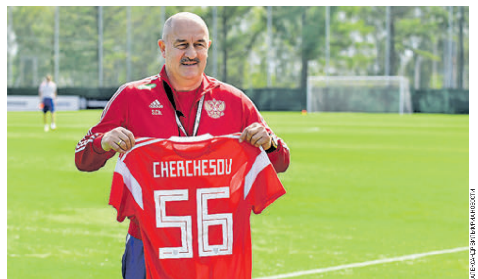
Вчера 12:30 Главному тренеру сборной России по футболу Станиславу Черчесову исполнилось 56 лет. В честь дня рождения своего наставника игроки команды подарили ему футболку с символическим номером. Напомним, что 6 сентября спортсменам предстоит матч со сборной Шотландии.

РЕДАКЦИЯ «ВМ» ПОЗДРАВЛЯЕТ СТАНИСЛАВА САЛАМОВИЧА С ДНЕМ РОЖДЕНИЯ И ЖЕЛАЕТ НОВЫХ ПОБЕД!