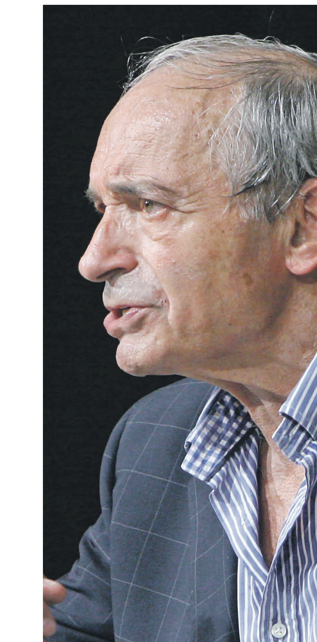
25 августа 2007 года. Творческий вечер советского и российского актера театра и кино, театрального режиссера, поэта и писателя, народного артиста РСФСР Валентина Гафта