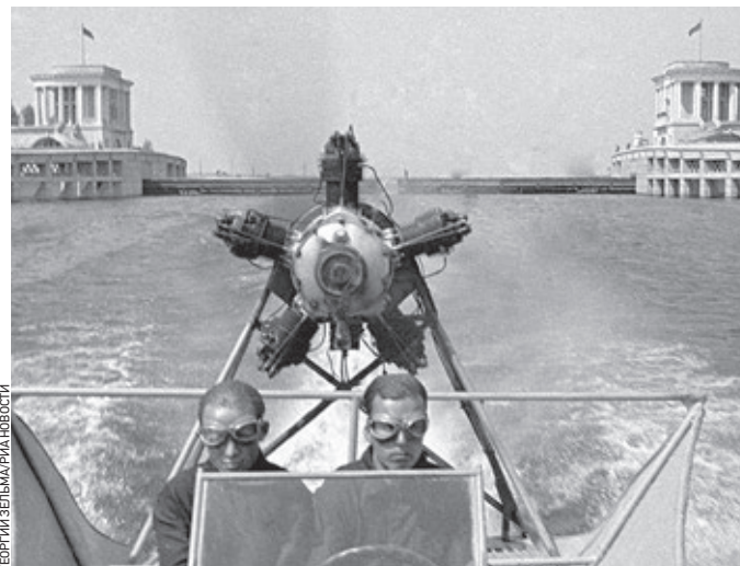
18 июля 1937 года. Специалисты проводят испытания первого глиссера (быстроходное судно) на канале Москва — Волга

Решение о строительстве было принято в 1931 году на Пленуме ЦК ВКП(б) после доклада Лазаря Кагановича. Канал имени Москвы — самый крупный источник воды для столицы, он обеспечивает 60 процентов потребляемой городом питьевой и промышленной воды. Канал строили заключенные. 200 тысяч человек были собраны в Дмитлаг в городе Дмитрове, где сейчас построена часовня Новомучеников в земле Российской просиявших. Одним из заков был Сергей Извеков, будущий Патриарх всея Руси Пимен (1971–1990). Видным руководителем стройки был последний генерал-губернатор Финляндии и министр путей сообщения Временного правительства Николай Некрасов,