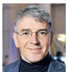
(на фото). Субсидии также помогут возместить проценты по кредитам: до 7,25 процента в пределах ключевой ставки при приобретении иностранного оборудования и до 12,25 процента — отечественного.