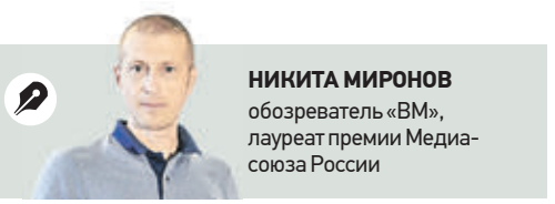
НИКИТА МИРОНОВ обозреватель «ВМ», лауреат премии Медиа-союза России