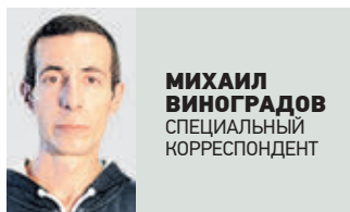
НЕ МОГУ МОЛЧАТЬ

МАТЕРИАЛ О МЕРОПРИЯТИЯХ, ПОСВЯЩЕННЫХ ДНЮ СОЛИДАРНОСТИ В БОРЬБЕ С ТЕРРОРИЗМОМ, ЧИТАЙТЕ В СЛЕДУЮЩЕМ НОМЕРЕ