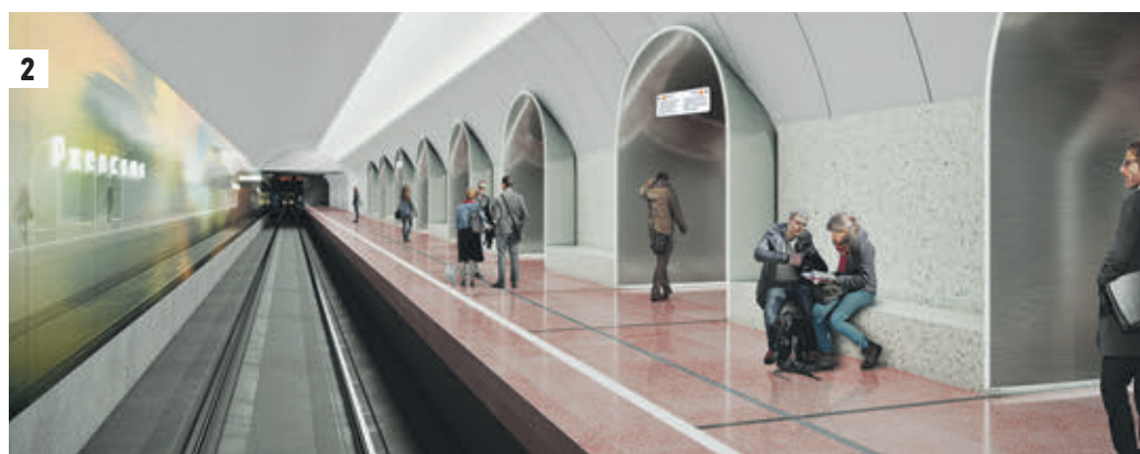
Дизайн-проекты архитектурно-художественного оформления перехода (1) и платформы (2) станции «Ржевская» Большой кольцевой линии Московского метрополитена

что оба объекта будут перекликаться. Выход к скверу Рижского вокзала мы планируем сделать ярким и расположить там мультимедийную стену, имитирующую расписание поездов, — это еще одна ассоциация с вокзалом. Путевые стены станции будут украшены принтами с изображениями, напоминающими размытый пейзаж, который мы видим из окна быстро едущего поезда или автомобиля: природа, улицы, люди. Мы постарались сделать дизайн станции комфортным, лаконичным