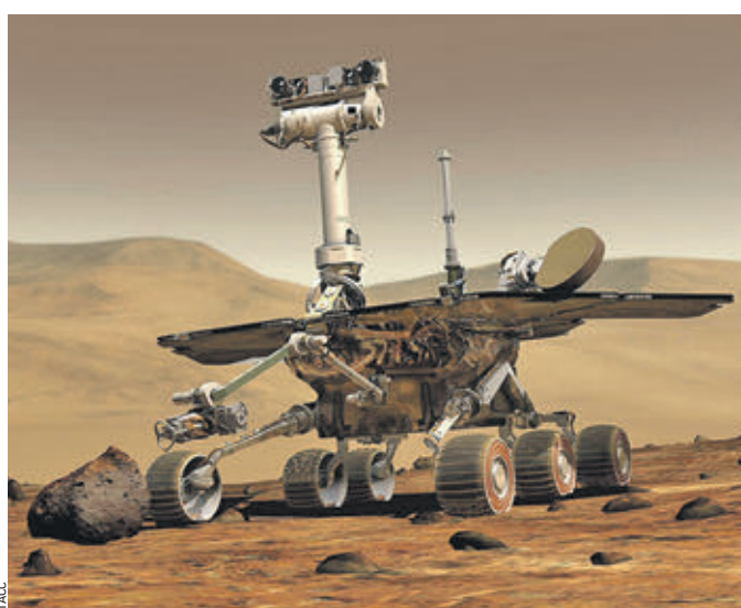
Марсоход, принадлежащий НАСА, 23 июня 2019 года вновь обнаружил признаки жизни на поверхности Марса

Эксперт отметил, что каждые два дня на земную поверхность попадают по несколько тонн осколков небесных тел.