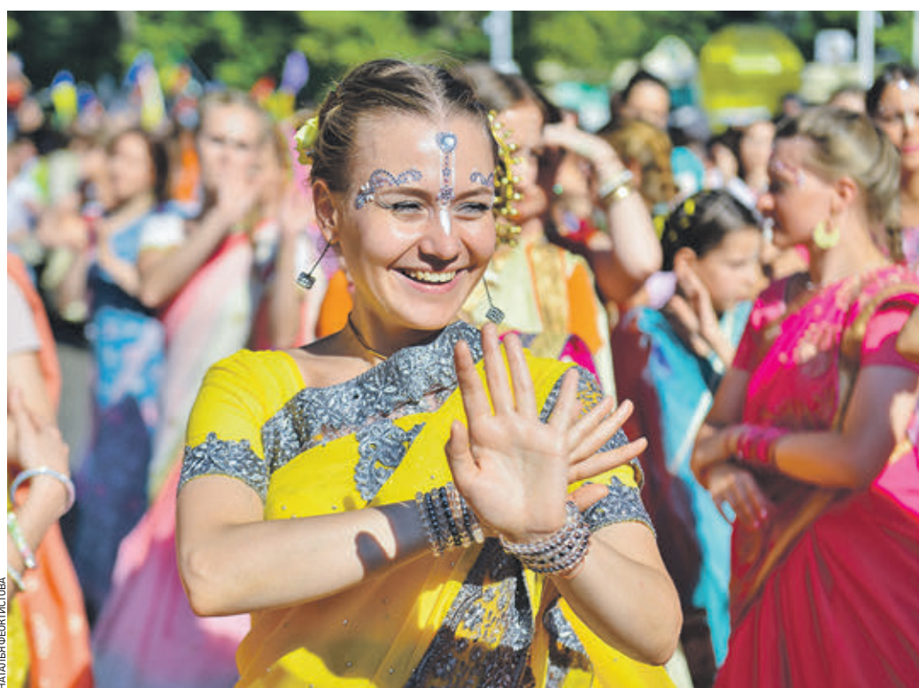
13 августа 2017 года. Фестиваль «День Индии» каждый год радует гостей яркими танцами и увлекательной программой мероприятий

Вчера организаторы ежегодного фестиваля «День Индии», который откроется 9 августа в парке «Сокольники», рассказали подробности развлекательной программы.