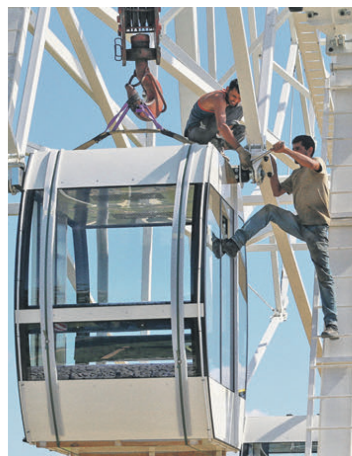
9 августа 2016 года 14:11 Монтаж в парке «Спазза» кабинки нового колеса обозрения, которое работает на солнечных батареях

Он отметил, что в столице разрабатывается несколько таких проектов. — Вопрос зеленой энергетики активно обсуждается на мировой арене. Для Москвы эта тема тоже является достаточно важной. Наши эксперты изучают новые технологии преобразования солнечной энергии, разрабатывают пилотные проекты, — сказал Степан Орлов. Ранее тему развития зеленой энергетики специалисты различных областей обсудили во время круглого стола сетевого вещания «ВМ». По мнению вице-президента Российского союза химиков Игоря Кукушкина, в России на сегодняшний день энергию добывают с помощью химической промышленности. — В Череповце одна из компаний перевела избыточное тепло в электроэнергию. Таким образом, завод перешел на полный цикл производства. Он вырабатывает не только определенную продукцию, но и энергию. Сейчас эта технология не является уникальной. Она масштабирована и используется на других предприятиях. Если говорить, насколько это выгодно, то пилотный проект достаточно быстро окупается. На это потребуются всего два года, — пояснил Игорь Кукушкин. — Это значит, что энергия вырабатывается за счет холода. Этот способ достаточно непростой, но тоже имеет свои перспективы. Главное — вой-