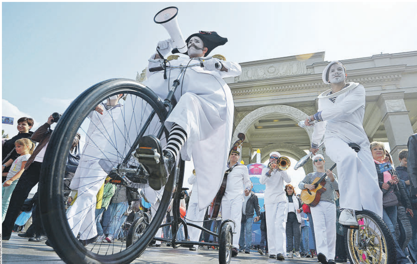
5 августа. Главная арка ВДНХ. Парад «Москвариума» возглавляют артисты театра «Высокие братья», обладатели Гран-при Международного фестиваля пантомимы и клоунады COMEDIADA 2019 и лауреаты Международного фестиваля клоунады в Москве