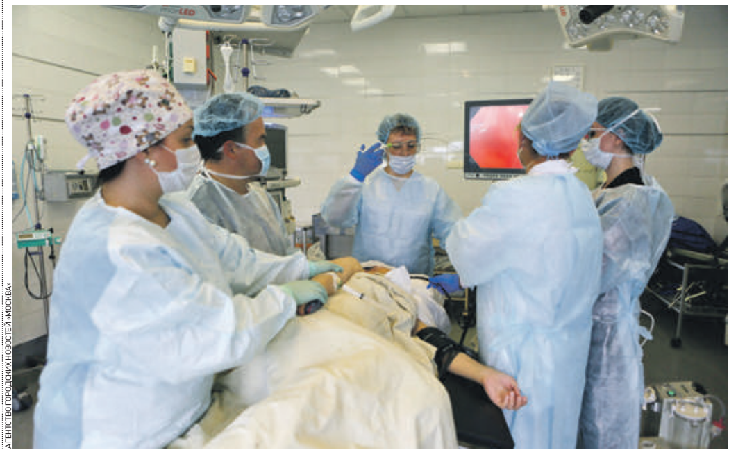
2 августа 12:54 Хирурги Городской клинической больницы имени Ерамишанцева проводят высокотехнологичную операцию. В больнице действует единственное в России отделение портальной гипертензии для пациентов с тяжелой патологией печени