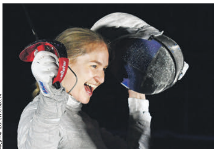
13 мая 2018 года. Софья Великая радуется победе в турнире по фехтованию «Московская сабля — 2018»