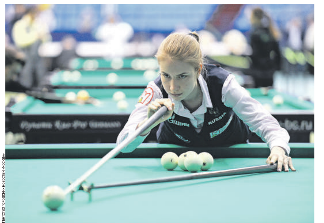
16 мая 2018 года. Чемпионка России 2017 года Мария Карпова выступает на VII Международном турнире по бильярдному спорту «Кубок мэра Москвы» в составе сборной России

Проведение в Москве крупных международных мероприятий по видам спорта направлено в первую очередь на привлечение внимания жителей и гостей столицы к демонстрации возможностей занятий видами спорта в учреждениях города, что в свою очередь привлекает детей и молодежь в спортивные школы. В Москве создаются равно максимально возможные ус-