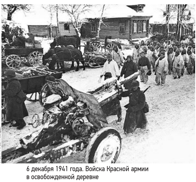
6 декабря 1941 года. Войска Красной армии в освобожденной деревне

Выставка фотографий Битвы за Москву 1941 года наполнена снимками из трех хранилищ — частного архива, фондов ТАСС и самого музея. По ним можно проследить за одними из самых трагических страниц в истории столицы.