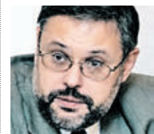
МИХАИЛ ХАЗИН ПРЕЗИДЕНТ ФОНДА ЭКОНОМИЧЕСКИХ ИССЛЕДОВАНИЙ

Я очень скептически отношусь к прогнозам валют. Считаю, что хранить деньги нужно в разных валютах и уж точно не в рублях. Наша валюта — одна из самых нестабильных в мире.