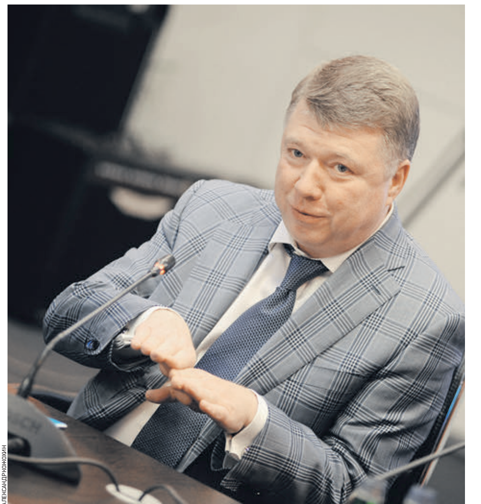
7 июня 2017 года. Министр правительства — начальник Департамента региональной безопасности и противодействия коррупции Владимир Черников в редакции «ВМ»