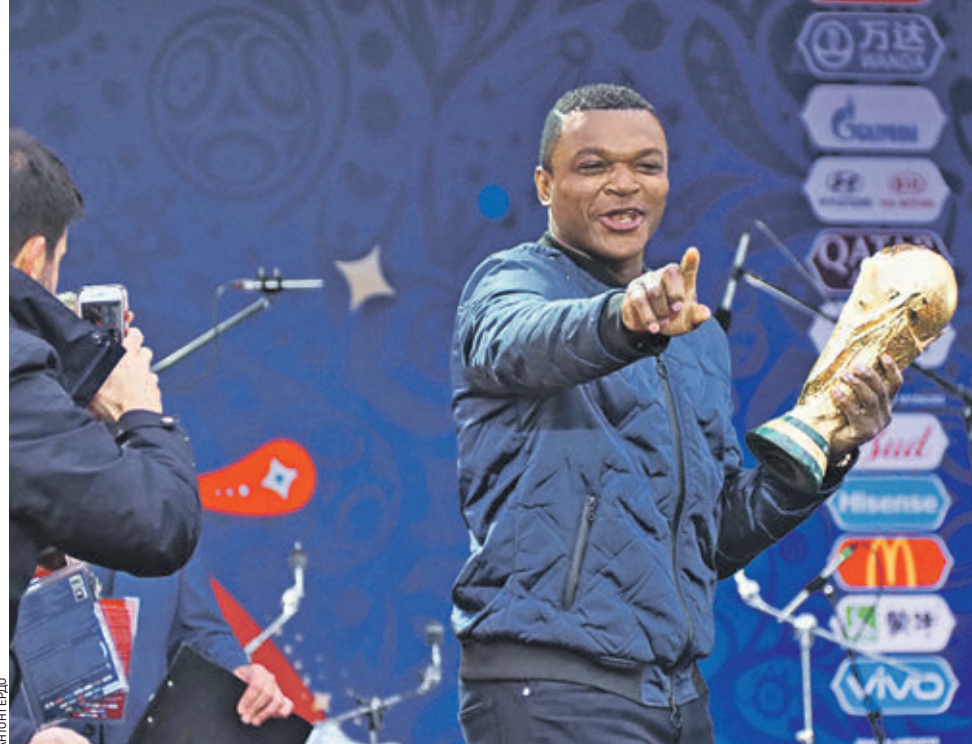
10 июня 19:20 Французский футболист, чемпион мира по футболу ФИФА — 1998, победитель Кубка конфедераций ФИФА — 2001 и 2003 в составе сборной Франции Марсель Десайс во время церемонии открытия фан-зоны чемпионата мира по футболу на Воробьевых горах в Москве. Француз со сцены представил болельщикам Кубок мира. Открывшаяся фан-зона может одновременно принять до 25 тысяч человек. Расположена она напротив Главного здания Московского государственного университета имени М. В. Ломоносова. Здесь установлены фуд-корты, интерактивные стенды и сувенирные магазины.