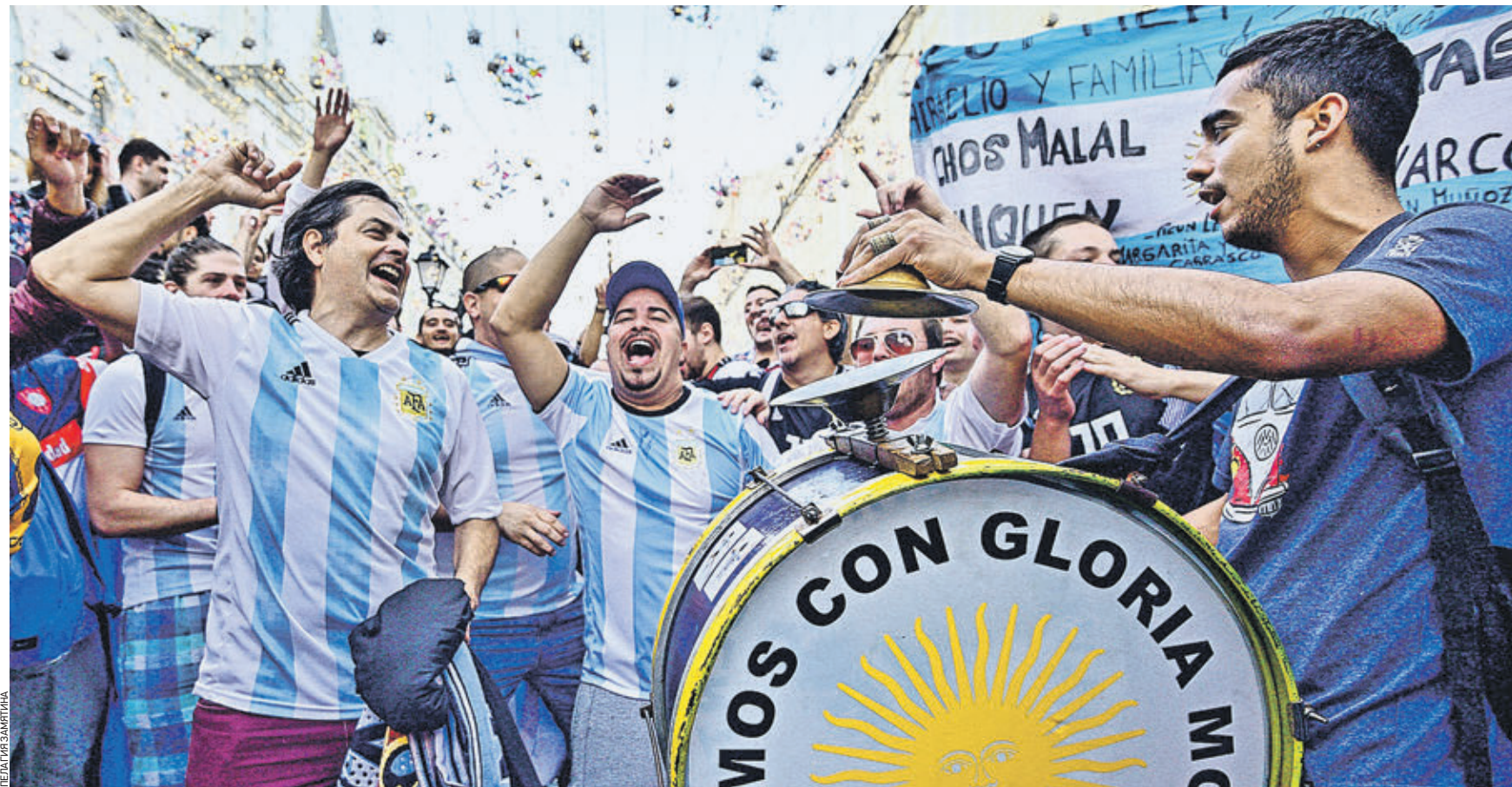
11 июня 19:03 Болельщики сборной по футболу из Аргентины вышли на Никольскую улицу в центре столицы