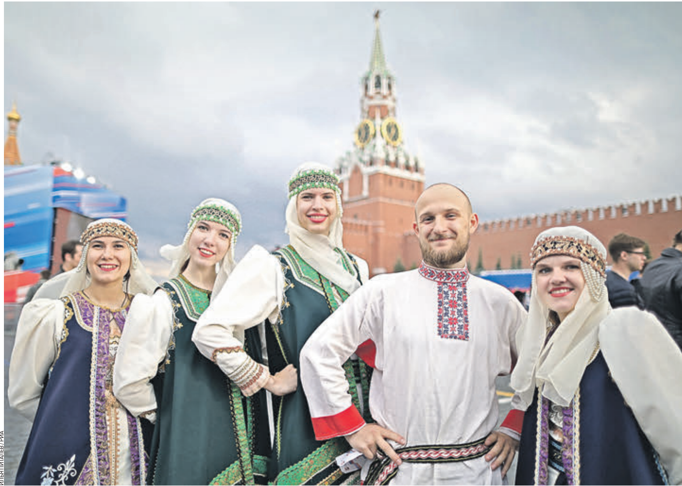
Вчера 18:58 Участники концерта, посвященного Дню России, собрались на Красной площади, чтобы порадовать гостей праздника красочными выступлениями