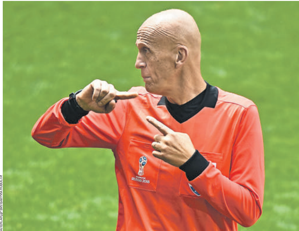
Вчера 12:40 Бывший футбольный судья, глава судейского комитета UEFA, консультант итальянской Ассоциации арбитров Пьерлуиджи Коллина во время футбольного турнира между делегатами 68-го Конгресса ФИФА в Москве. Матчи прошли на стадионе ЦСКА. Участие в турнире приняли восемь команд, шесть из которых были собраны из представителей каждой из конфедераций международной федерации. К ним присоединились сборные ФИФА и России. Кстати, сегодня в Москве состоится конгресс Международной федерации футбола, на котором будет выбрано место следующего чемпионата мира.