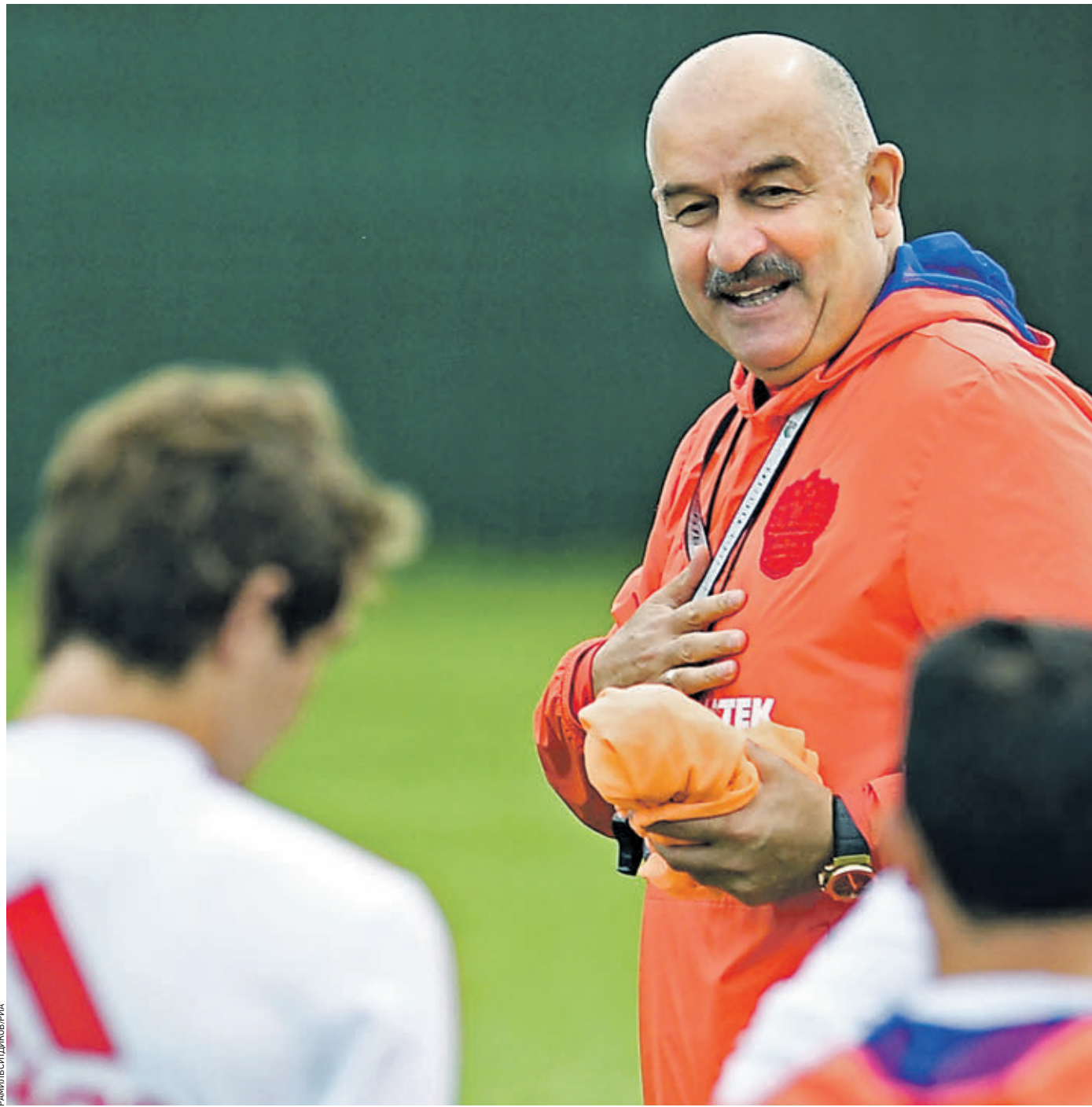
12 июня 11:25 Главный тренер сборной России по футболу Станислав Черчесов проводит тренировку в учебно-тренировочном центре «Новогорск» и дает ценные для спортсменов указания

9 июня сборная России по футболу провела открытую тренировку на домашнем стадионе ЦСКА «ВЭБ Арена». Чтобы увидеть, как готовится команда к предстоящим матчам чемпионата мира, на стадион пришли несколько тысяч болельщиков. Чего они ожидают от выступления национальной сборной, выяснил корреспондент «ВМ».