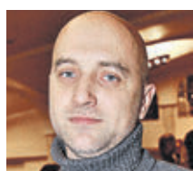
ЗАХАР ПРИЛЕПИН ПИСАТЕЛЬ, МАЙОР ДОНЕЦКОЙ НАРОДНОЙ РЕСПУБЛИКИ

Уже месяц как подтянула войска к границам ДНР/ЛНР. При чем много чего подвели, есть и тяжелая техника. И совсем недавно вероятность даже не провокации, а масштабного наступления была крайне высока. Но после высказываний президента Путина в ходе «Прямой линии» с гражданами появился шанс, что они вяли его предупреждению. Они стоят на месте и все время чемпионата никуда не уйдут. Думаю, они учитывают возможность того, что мир не примет провокацию во время ЧМ и высказывание Путина было направлено на это. Мы ведь отлучаемся от Украины, ее суверенитет Украины, ее зависимость от американских советников, которая не предполагает свободных действий. Если им прикажут наступать, они будут наступать. А Соединенным Штатам нет дела до нашего чемпионата, они в любом случае останутся с краю.