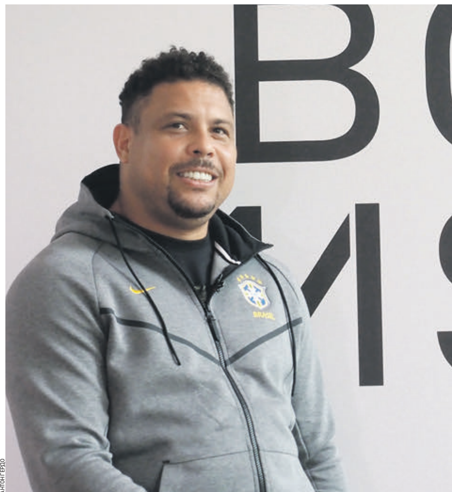
Вчера 12:26 Парк Горького. Бразильский футболист Роналду Луис Назариу ди Лима на открытии культурно-спортивного центра

Снижение цены на бензин было зафиксировано на нескольких столичных заправках впервые с начала марта. Как следует из статистики Московской топливной ассоциации, с 4 по 9 июня цены на топливо уменьшились примерно на 7–8 копеек.