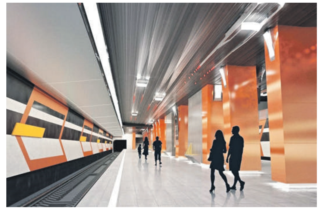
Проект станции «Боровское шоссе» Калининско-Солнцевской линии. Станцию метро архитекторы решили отождествить с одноименной транспортной артерией — Боровским шоссе

— На платформе полностью уложен гранит «Цветок Урала», на 97 процентов выполнены работы по облицовке стен и потолка текстурированными под бетон панелями. Завершается архитектурная отделка в вестибулях, — рассказал Марат Хуснуллин. Сама дизайн-концепция обычной подземки. Она полупод-