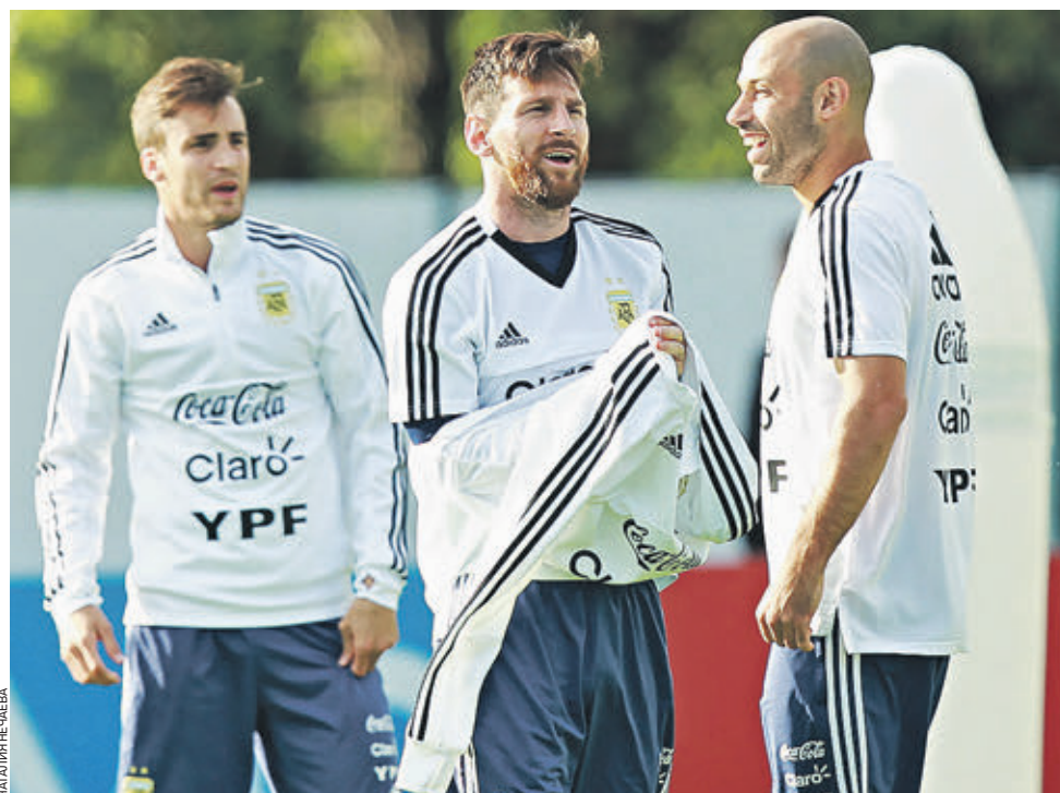
11 июня 11:00 Футболисты сборной Аргентины Пауло Дибала, Лионель Месси и Хавьер Маскерано (слева направо) во время открытой тренировки на базе в Бронницах в Московской области. Аргентинцам повезло с погодой, и звезды мирового футбола отработывали удары с мячом под солнцем. Однако все внимание собравшихся на трибунах, как российских болельщиков, так и иностранных, было приковано к нападающему Месси, который и обеспечил победу сборной на чемпионат. Тренировка была стандартной. Футболисты отработывали пасы вразрез, играли в «квадрат», а завершили все двухсторонкой — тренировочной игрой в два состава.