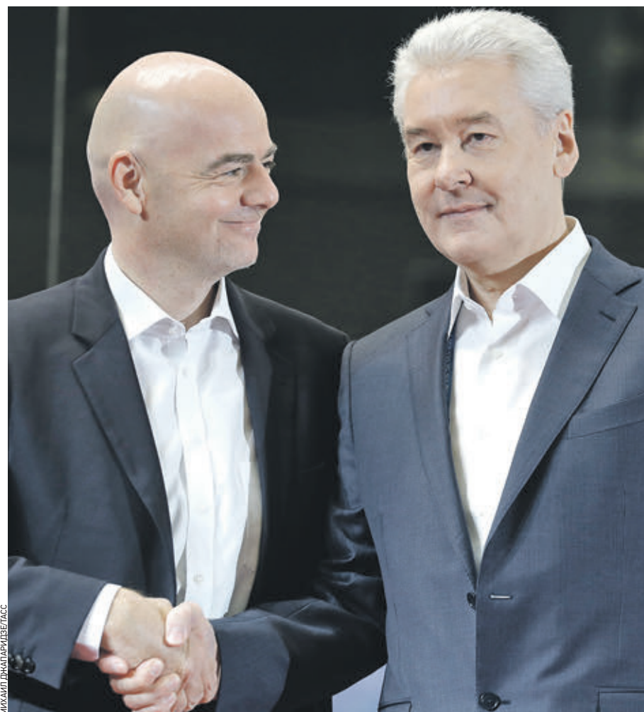
9 июня 11:30 Мэр Москвы Сергей Собянин и президент FIFA Джанни Инфантино открыли Международный вещательный центр чемпионата мира по футболу