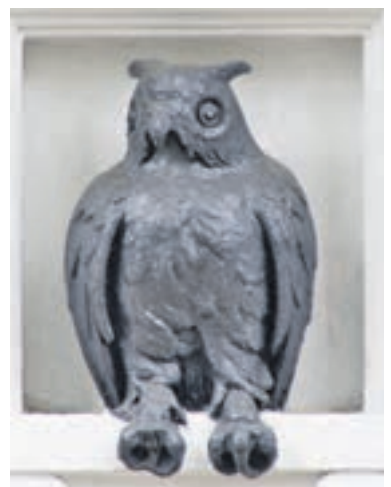
Вчера 13:25 Бронзовая птица — любимый объект съемки у туристов

13:45 Весна в разгаре, и, несмотря на дожди и туманы, корреспонденты «ВМ» решили прогнать мотороллер после «зимней спячки» и отправились в проезд Черепановых. Поллюбопытствовать, что же за таинственный особняк с соевой приталился там. Особое внимание к этому зданию привлекает и громадный тополь — прямо у старого дома. В четыре обхвата!