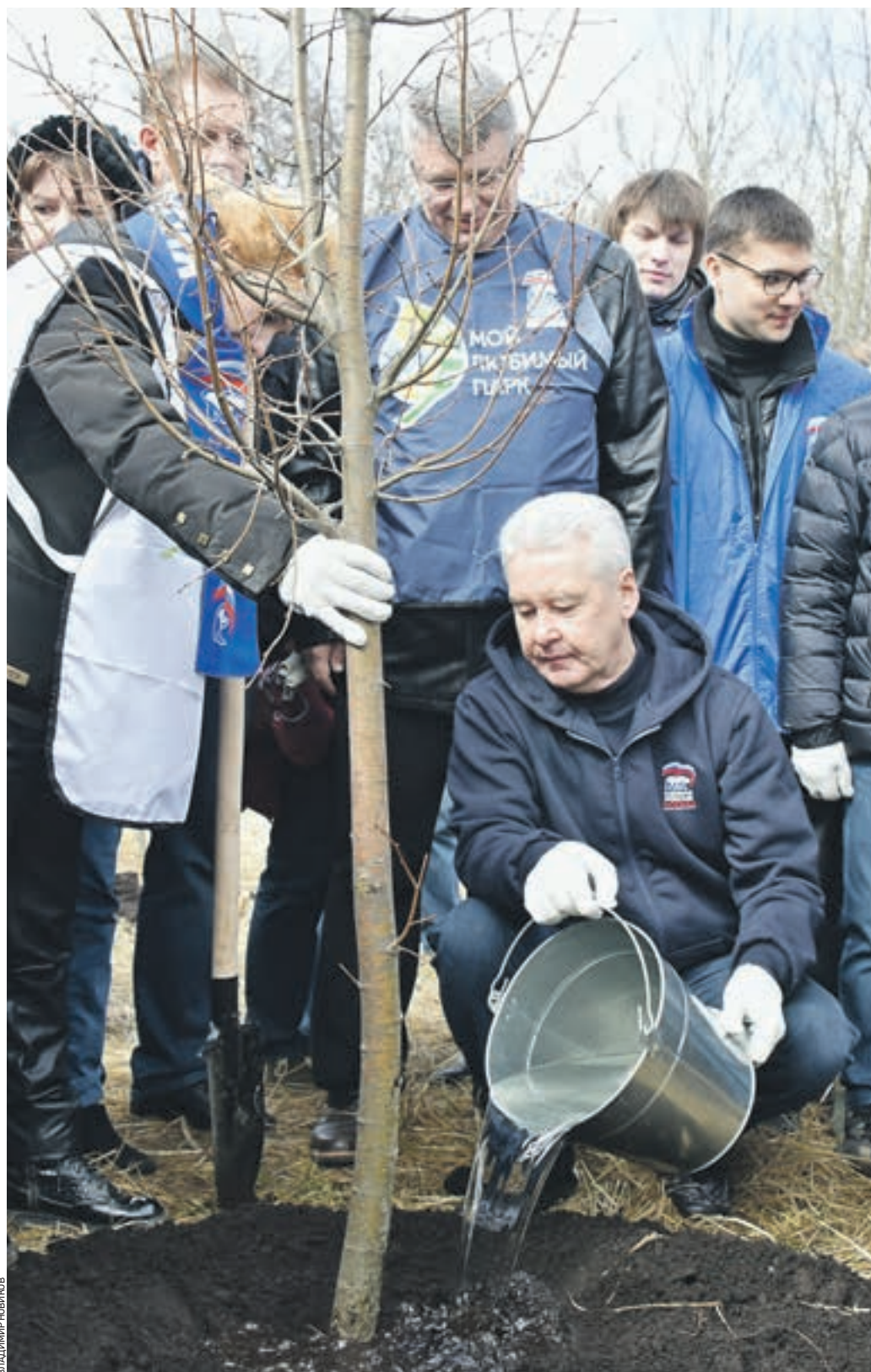
23 апреля 2016 года 10:08 Прошлой весной мэр Москвы Сергей Собянин принял участие в городском субботнике в парке «Братцево», который расположен в районе Северное Тушино