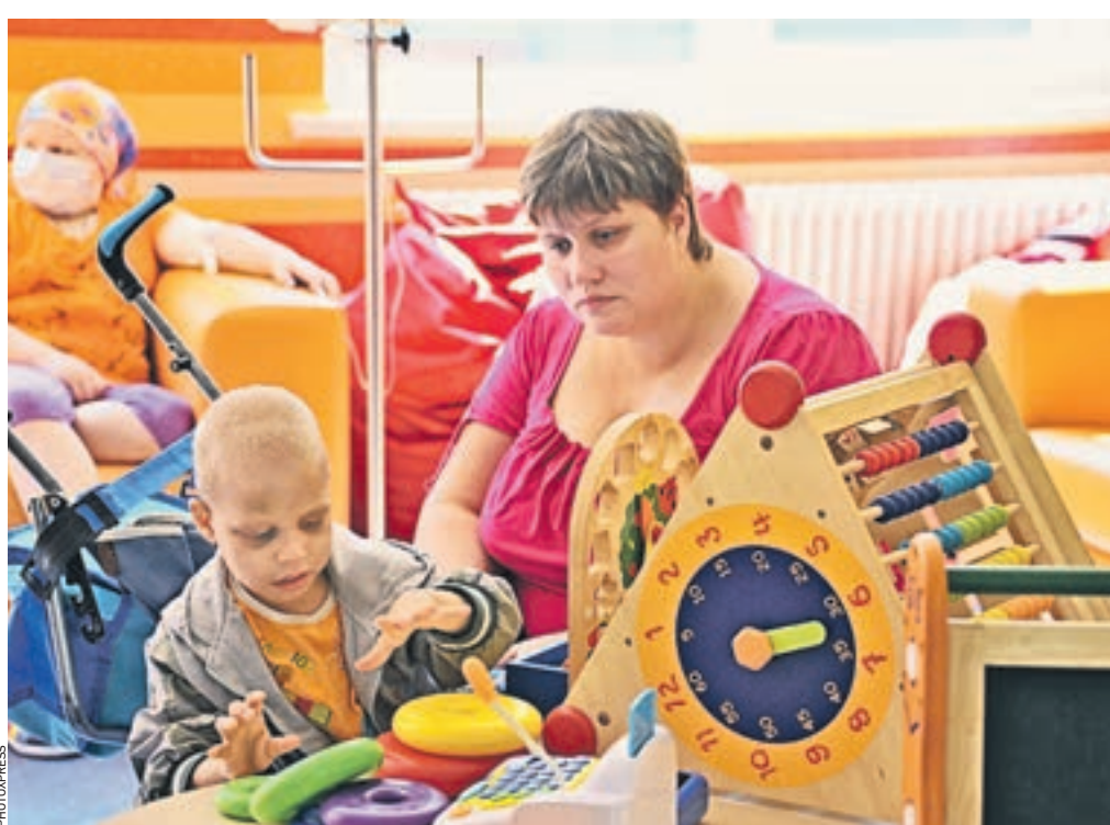
3 февраля 2017 года. В ННПЦ детской онкологии и гематологии

— Мы подготовили учителей — молодых, живых, активных, — которые обучают больных раком детей прямо в стенах больницы. Эти учителя одновременно являются профессионалами-предмет-