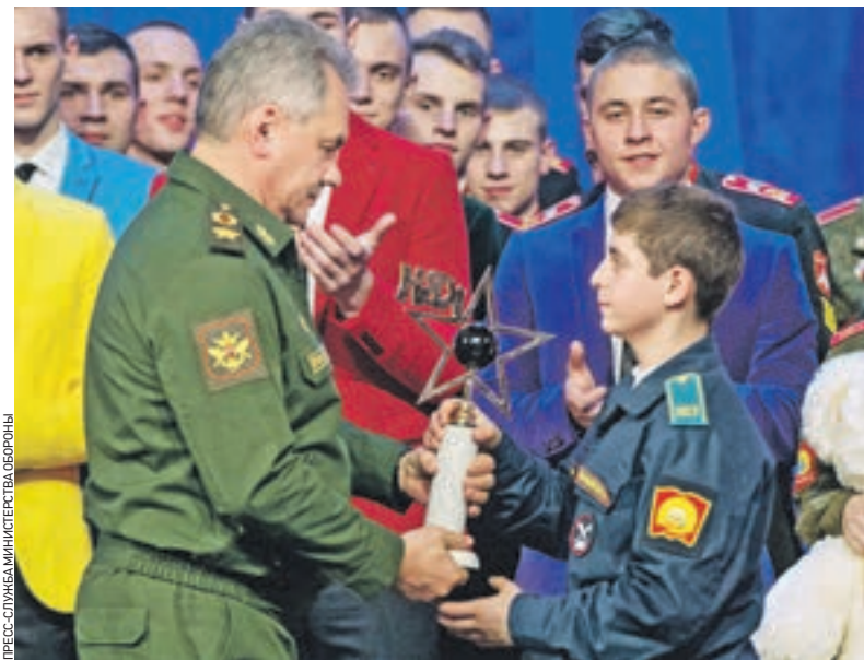
Среда 20:00 Министр обороны РФ Сергей Шойгу вручает кубок победителя команде «Салют» из Ставрополя

обороны Сергея Шойгу получил и главный организатор КВН Александр Масляков. — Ребята, которые стоят сейчас на сцене, — это настоящая и мощная Армия России, — говорит Шойгу. — И вы должны помнить, что у вас есть дом, служба, огромная семья, которая всегда заботится о вас. Этим людям патриотизму учить уже не надо, все они граждане своей страны.