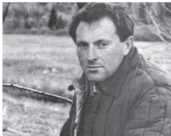
1964 год. Деревня Норинская Архангельской области. Поэт Иосиф Бродский в ссылке