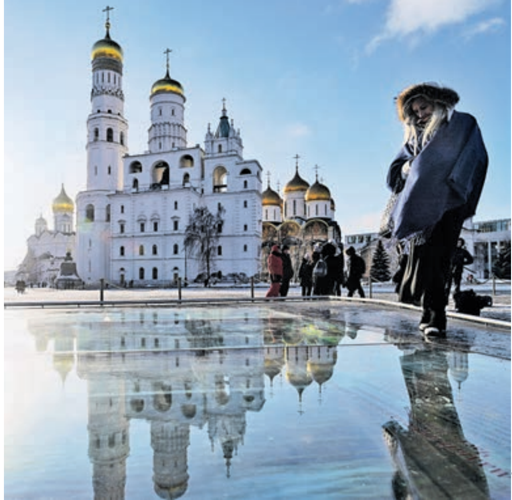
Вчера 11:00 Туристка осматривает раскопки на месте демонтированного 14-го корпуса Московского Кремля через «археологическое окно»