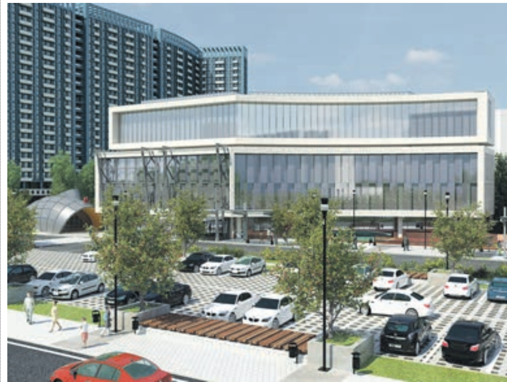
Проект транспортно-пересадочного узла «Тропарево». Помимо автобусных терминалов, он будет включать торговые объекты, паркинги для автомобилей и апартаменты

ВАСИЛИСА ЧЕРНЯВСКАЯ v.chernyavskaya@vm.ru