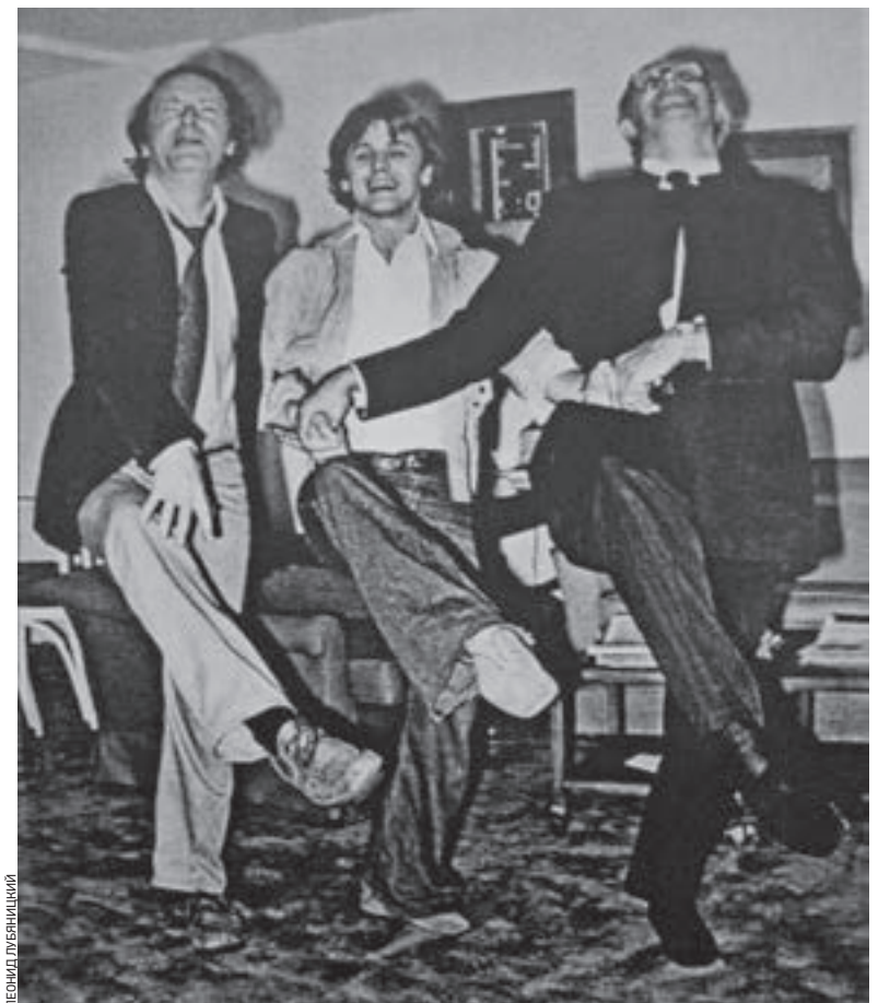
1970-е годы. Поэт Иосиф Бродский (слева), балетмейстер Михаил Барышников (в центре) и дирижер Мстислав Ростропович