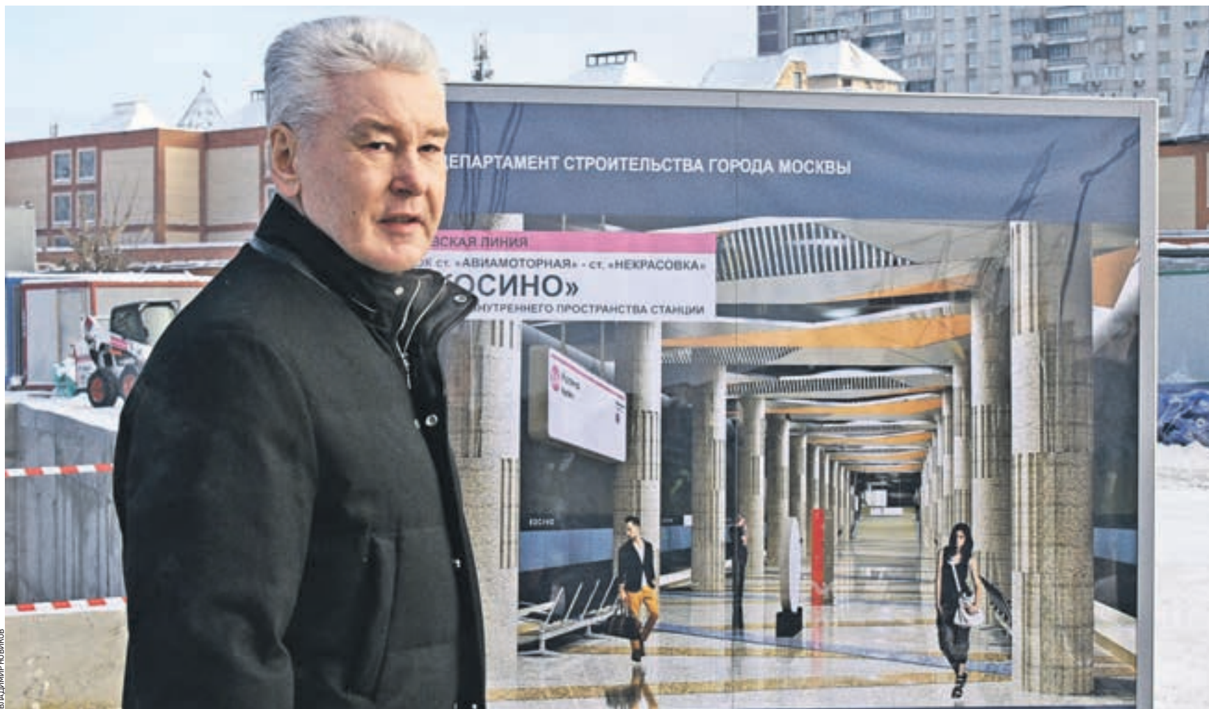
Вчера 12:05 Мэр Москвы Сергей Собянин осмотрел ход строительства перегонного тоннеля от станции «Косино» в сторону станции «Юго-Восточная» Кожуховской линии метро. Работы ведутся, несмотря на сильные морозы. Новую ветку ждут не только москвичи, но и жители Подмосквья

Слева от ворот, за которыми развернулась стройка станции метро «Косино», установлено бетонное кольцо. Внутри — силуэты двух поездов. Один как будто приближается, приветствуя пассажиров светом белых фар. Второй, подмигивая красными огнями, вот-вот исчезнет в темноте. Все это — наглядная иллюстрация того, как будет выглядеть готовый тоннель. Перегоны между некоторыми станциями новой ветки делаются по так называемой испанской технологии: в большом тоннеле прокладываются сразу два пути для движения поездов в разных направлениях. Такая стройка не только идет быстрее, но и обходится дешевле. Обычно в Москве сооружаются два однопутных тоннеля. — Мы находимся на строительстве одной из самых больших веток метро — Кожуховской, которая пройдет от «Авиамоторной» до «Некрасовки», — сказал Сергей Собянин, подчеркнув, что работы не останавливаются ни на час. — Строители работают в выходные, и в морозные дни.