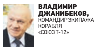
ВЛАДИМИР ДЖАНИБЕКОВ , КОМАНДИР КОРАБЛЯ «СОЮЗ Т-12»

На счету этого человека испытания самолетов Су-27 и Су-27УБ на «штопор». Сложные испытания на сверхзвуковых боевых МиГ'ах, космический полет на корабле «Союз Т-12» и орбитальной станции «Салют-7», испытания атмосферного аналога космического корабля «Буран». О том, каким его запомнили, «ВМ» спросила у его коллег.