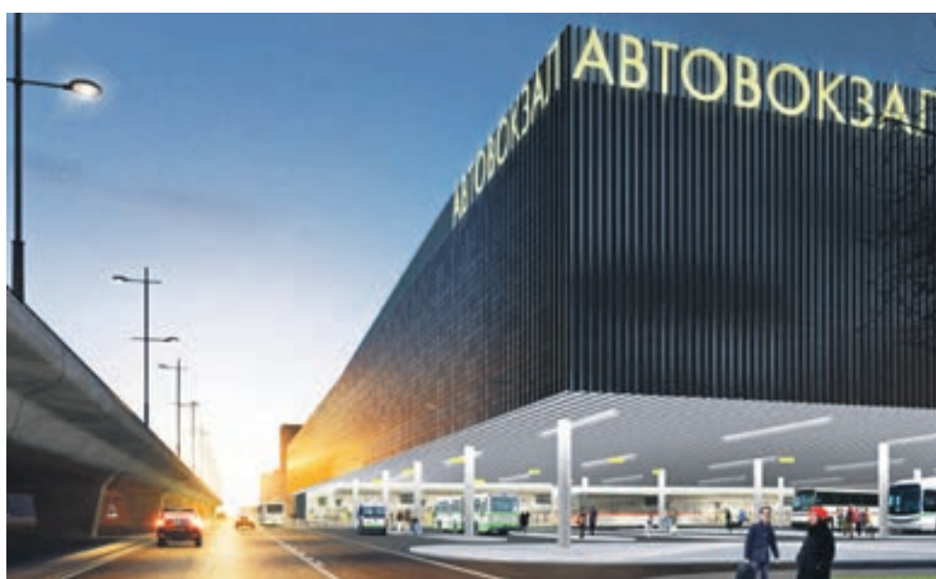
Визуализация дизайн-проекта Щелковского автовокзала. Согласно задумке российских архитекторов так будет выглядеть вокзал после комплексной перестройки

Москомархитектура согласовала дизайн-проект многофункционального комплекса с автовокзалом. Построенный на пересечении Щелковского шоссе с Уральской улицей он будет напоминать стеклянный корабль.