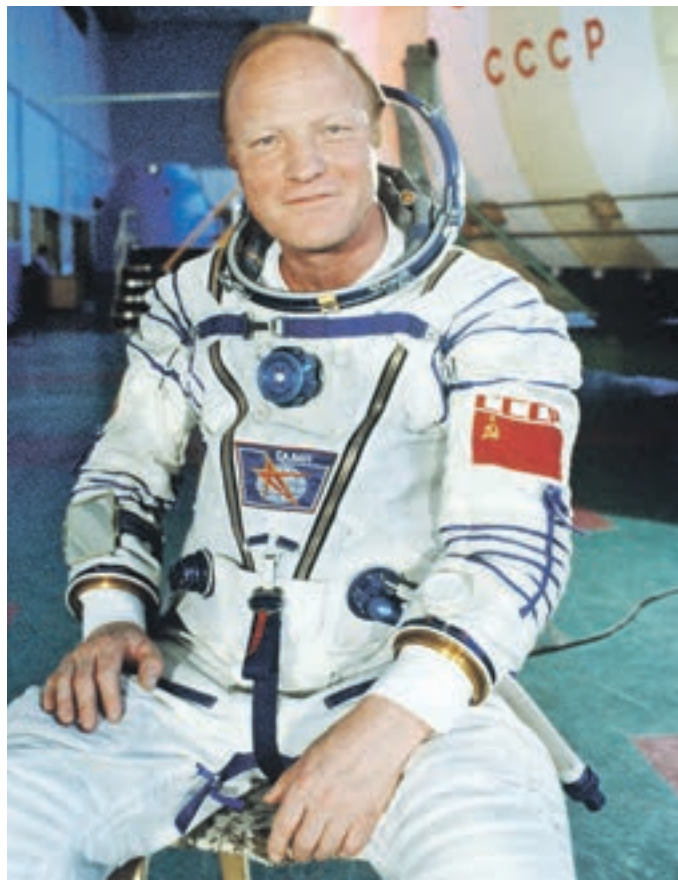
1984 год. Космонавт-исследователь, заслуженный летчик-испытатель СССР Игорь Волк у корабля «Союз»

Это был солнечный человек. Я не знал никого другого, кто бы так любил жизнь. 1984 год, мой четвертый полет, в этот раз на «Союзе Т-12». Неожиданно появилась идея — первый выход женщины в открытый космос. Экипаж был сформирован быстро, меня назначили командиром. Светлана Савицкая должна выйти в открытый космос, третьим в экипаже был Игорь Волк. Во время подготовки к полету проявилось очень важное качество Игоря — доверие к коллегам. Он не позволял себе излишнего контроля и ненужной суеты, что здорово облегчало работу. Он доверял мне совершенно и в мои вопросы — управление кораблем — не вникал. Доходило даже до того, что во время режимов стыковки, за которые я отвечал, он мог совершенно спокойно спать. Со Светланой Савицкой была другая ситуация — она как бортинженер все держала под контролем и периодически, во время проводимых биологических экспериментов, «закручивала гайки». Кроме того, она зани-