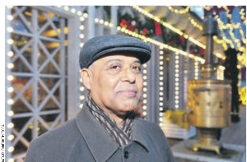
Вчера 17:30 Посол Народной Республики Бангладеш в России Сайфул Хок любит гулять по Тверской площади

руется визит российской делегации в Бангладеш. За 40 лет руководство вашего государства впервые посетит нашу республику.