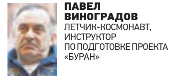
ПАВЕЛ ВИНОГРАДОВ , ЛЕТЧИК-КОСМОНАВТ, ИНСТРУКТОР ПО ПОДГОТОВКЕ ПРОЕКТА «БУРАН»

дила стыковка со станциями, основной экипаж был очень рад нас видеть. И Игорь приносил в эти встречи поток позитива и радости. У здоровых людей часто бывает тяжелый период адаптации к невесомости. Если человек часто болеет, то его иммунная система натренирована на преодоление различных трудностей. Ау здоровых людей такой тренировки поменьше. Несколько суток Игорь иногда жаловался на головную боль, чувствовалось, что ему сложно. Но в отличие от большинства летчиков-космонавтов, которые часто скрывают от врачей состояние здоровья, Игорь все откровенно рассказывал, чтобы на его примере можно было понять, как быстрее помочь другим.