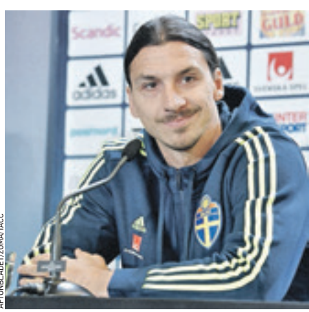
Нападающий сборной Швеции Златан Ибрагимович объявил, что он не выступит на Олимпийских играх-2016. 34-летний игрок заявил, что завершит карьеру в национальной команде после чемпионата Европы. Клубную карьеру игрок продолжит в «Манчестер Юнайтед»