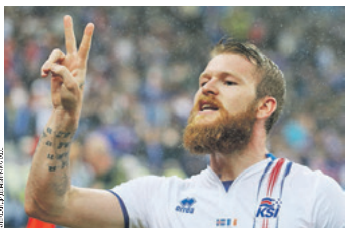
Арон Эйнар Гуннарссон, капитан сборной Исландии. Выступает на позициях защитника и полузащитника. Заигран за валлийский «Кардифф Сити». За сборную играет с 2008 года. Дебютировал 2 февраля в товарищеском матче с Белоруссией