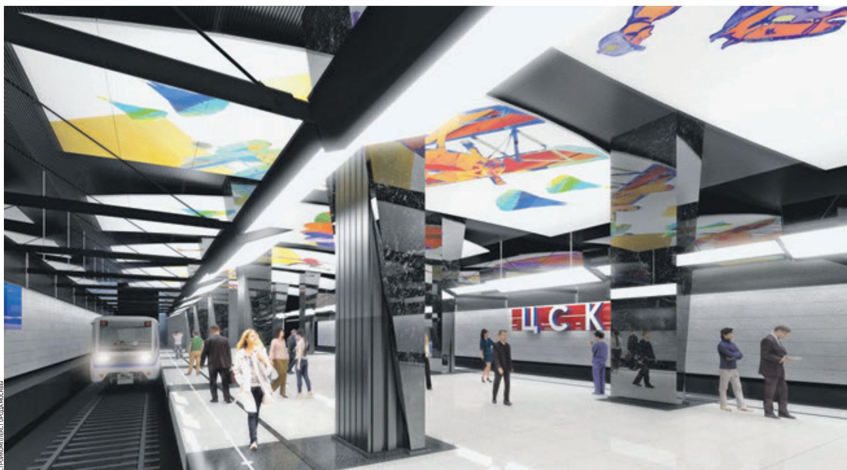
Проект станции «ЦСКА» Третьего пересадочного контура метро. Несмотря на типовое проектное решение самой станции, новый объект городской подземки получит яркое оформление: на фоне темных колонн и светлого пола разместят световые панели, на которых будут запечатлены сюжеты из жизни спортклуба

Чуть менее чем за два года до старта чемпионата мира по футболу болельщики легендарного спортивного клуба получили подарок от столичных властей. После продолжительного общественного обсуждения мэр Москвы Сергей Собянин принял решение удовлетворить просьбу активистов и болельщиков спортивного клуба «ЦСКА» и присвоить станции «Ходыньское Поле» новое название. Решение было утверждено весной этого года. В поддержку своей идеи заявители собрали почти девять тысяч подписей, и городские власти пошли им навстречу. Название обосновано нахождением вблизи станции многочисленных спортивных объектов ЦСКА. Во-первых, рядом со строящейся в настоящее время станцией находится спорткомплекс ЦСКА имени Гомельского. С другой стороны, Ходыньское Поле граничит с обширной территорией, где расположены бассейн и манеж ЦСКА, хоккейный Дворец имени Боброва, Дворец спортивных единоборств ЦСКА и другие объекты. На 3-й Песчаной улице в этом году должны достроить футбольный стадион ЦСКА.