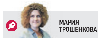
Ведущий редактор утренних номеров. Любит гулять по Москве с блокомном. Рисует профессиональными художественными маркерами.