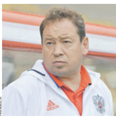
Главный тренер сборной России Леонид Слуцкий подал в отставку после того, как его команда потерпела два поражения и один раз сыграла вничью на групповом этапе чемпионата Европы. В результате россияне не попали в стадию плей-офф Евро-2016