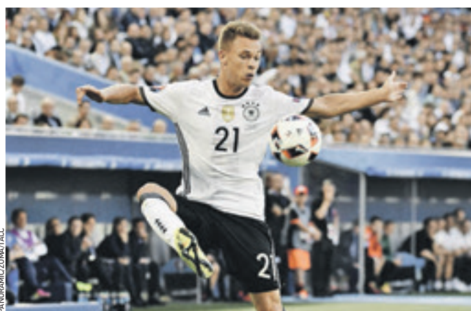
Джошуа Киммих из Германии способен закрыть сразу несколько позиций на поле. Редкий дар для игрока, которому всего лишь 21 год. Воспитанник мюнхенской «Баварии», с которой стал двукратным чемпионом Бундеслиги