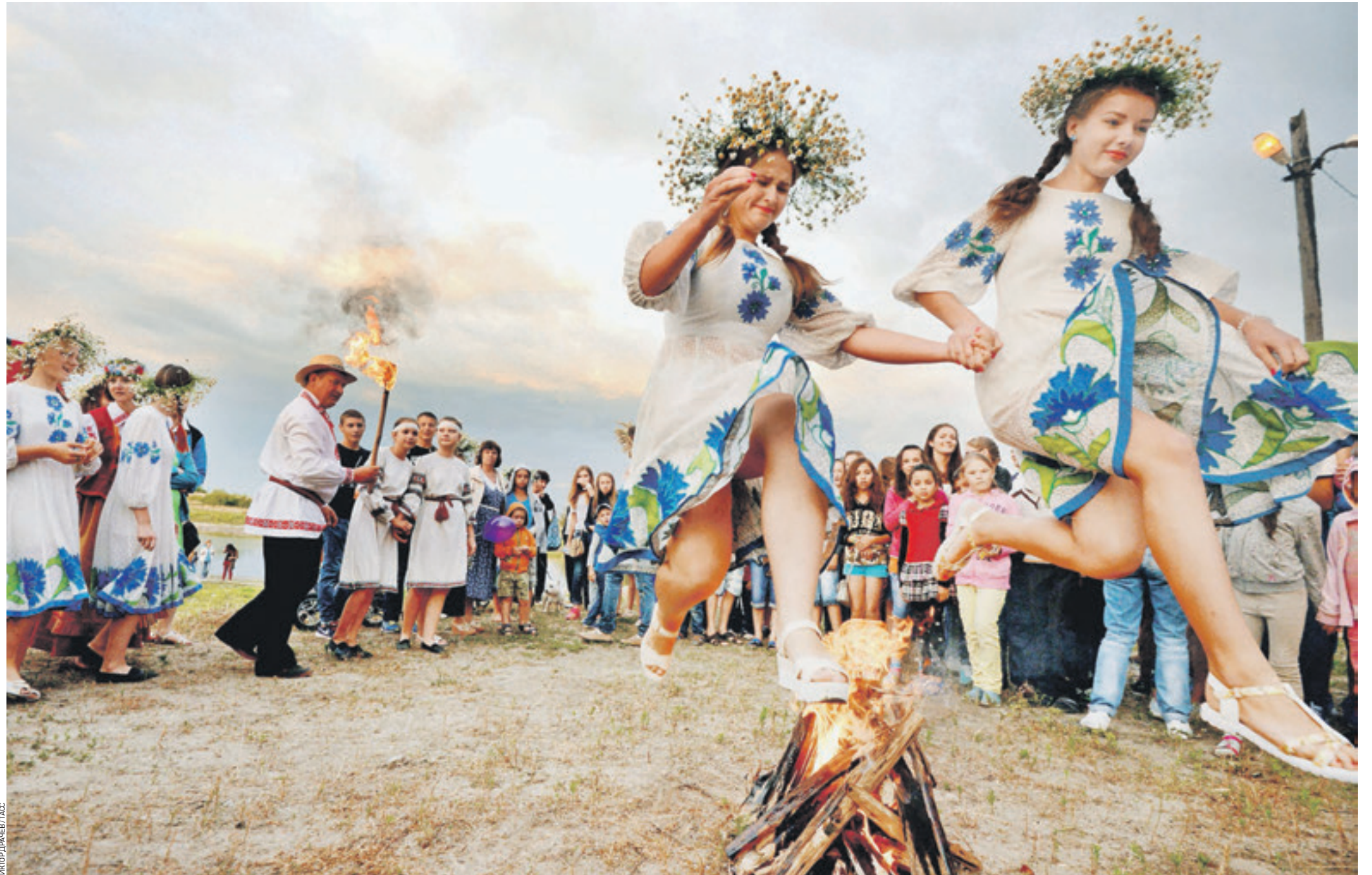
ТОЧКА Сегодня точку в номере ставят красавицы, принимающие участие в народных гуляньях по случаю празднования Ивана Купалы в белорусском городе Туров. В купальскую ночь принято разжигать так называемые очищающие костры. Кто удачнее и выше прыгнет, тот будет счастливее остальных в грядущем году. А еще девушки по традиции плетут венки из трав, а вечером пускают их в воду, наблюдая, как и куда они плывут. Если венок тонет, согласно приметам, суженый разбил и замуж за него не выйдет. Кстати, 9 июля в Измайловском парке также будут отмечать этот старинный славянский праздник, обещают даже поиски цветка папоротника. Согласно приметам, кто в эту ночь найдет цветущее растение, того ждет счастье и богатство.

Возможно, ты всерьез Поверила, что жидкость из-под крана Не родственница тихому ручью Хотя бы потому, что — горюханка. И вот мы в электричке спозаранку. Сидим — рука в руке, плечо к плечу. Трясет, как запряженную тачанку Вагон наш. Зай, возможно, нам — к врачу, Поправишь, скажешь: «Что-то мне не спится. Не хочешь, нстати, с чабрецом чайку?» Пить на ночь чай — почти что как молиться». Тоска исчезнет около реки. Дремучие сады спасут от сплина, Особенно когда дождями в спину, А после солнце выстрелом — в виски. Все будет как должно быть: чин по чину Зажмут леса нас в крепкие тиски — Упрямые, как горские мужичины.