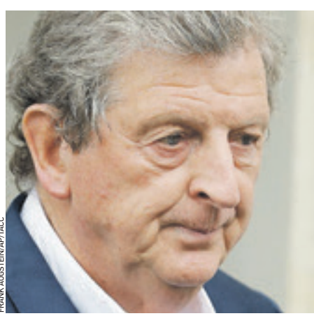
Главный тренер сборной Англии Рой Ходжсон подал в отставку после того, как его подопечные проиграли в одной восьмой финала дебютантке чемпионатов Европы по футболу — команде Исландии со счетом 1:2. Ходжсон работал в сборной Великобритании с 2012 года