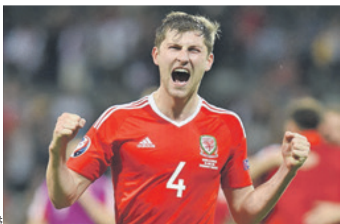
Центральный защитник сборной Уэльса Бен Дэвис — самый молодой среди всех защитников команды, его авторитет и мастерство никем не ставятся под сомнение. Играет в чемпионате английской премьер-лиги в «Тоттенхем Хотспур»