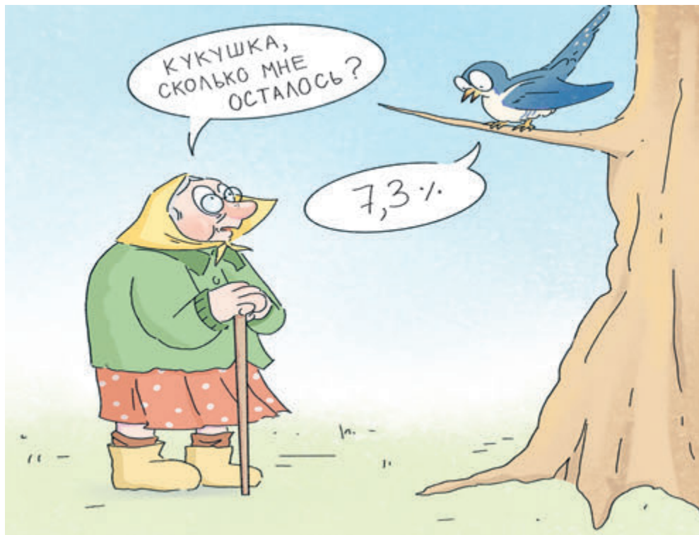
ИЛЛЮСТРАЦИЯ НАСТАСЬИ КОВАЛЕВСКОЙ

Еще на одном «фокусе» Минфин уже не просто сэкономит, а реально добавит в федеральную казну более 20 млрд рублей в виде