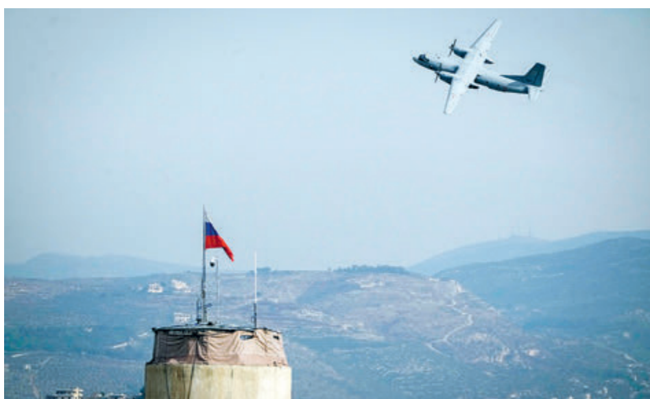
Авиабазы Хмеймим пока еще под российским флагом.

Первым проблему прямо обозначил Рамзан Кадыров. У нас в стране давно привыкли к тому, что он смело берется за решение задач, выходящих за рамки должностных обязанностей главы региона. С другой стороны, Кадыров лучше многих представляет степень непредсказуемости и пестроту амбиций еще не утвердившихся властей, когда старая государственная машина буксует, а новая еще не собрана. Прошедший трудную школу послевоенного восстановления Чечни, Рамзан исходит из того, что новым властям Сирии будет