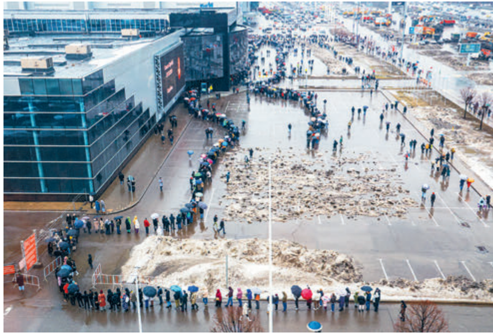
Все эти дни люди несут цветы к месту трагедии.

Отдельный разговор – проблема миграции. Не так давно за ограничение потока мигрантов публично высказывались гла-