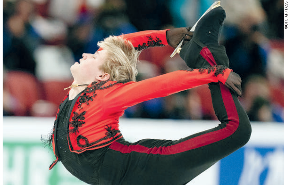
Илья Малинин, американский парень с русской фамилией.