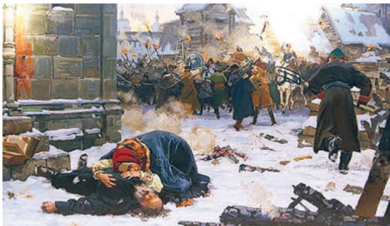
М.А. Подкопаева «В Смутное время». 2006 год.