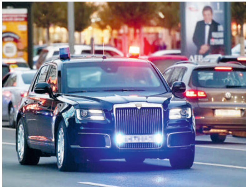
Так сегодня выглядит автомобиль-мечта российского чиновника.

Впрочем, дефицит был не только бюджетным, но кое-где и криминальным. Так, в городе Зеленодольске Красноярского края чиновница муниципального казенного учреждения со