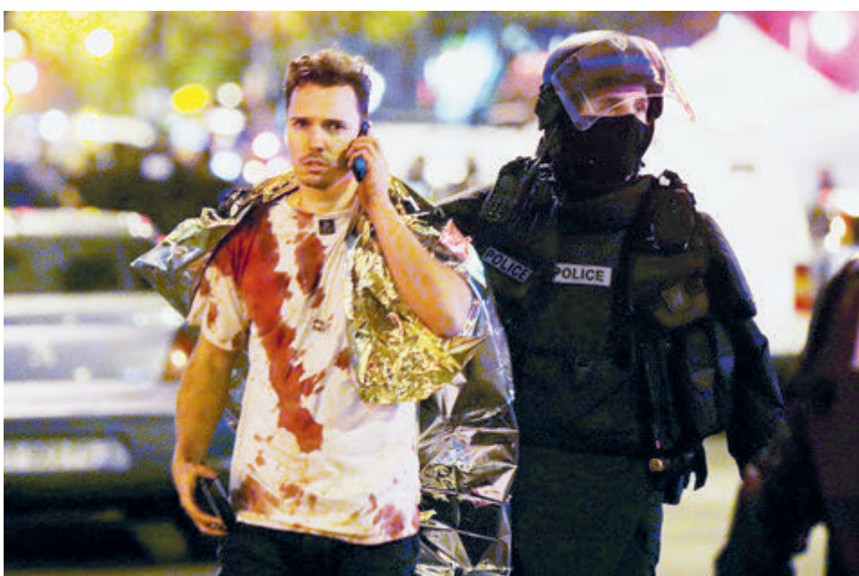
Париж, 2015 год. Теракт в театре «Батаклан».

The Washington Post подчеркивает, что нападение, показавшее уязвимость России к терактам, произошло сразу после победы Путина на выборах, укрепивших его власть на фоне конфликта на Украине. Пресс-секретарь Совета национальной безопасности Уотсон заявила, что администрация поделилась информацией об опасности теракта с российскими властями, но конкретных дат, мест и участников не передавалось. В редакционной статье The Irish Times подхватывает: «Попытка Путина переложить вину на Украину является удобным способом уклониться от сложных вопросов о неподготовленности его служб безопасности и их игнорировании конкретных предупреждений разведки США в начале марта. Это послужит оправданием наращивания атак на гражданские объекты».