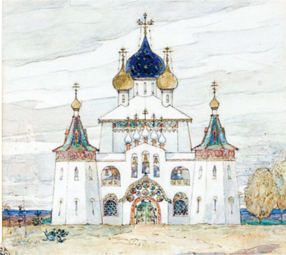
Щусев выработал оригинальный стиль, соединив древнерусские мотивы с модерном начала XX века.

Кстати, начинающий архитектор сумел возвести храмы не только на Куликовом поле, в усадьбе Натальевка Харьковской губернии или в Кутурештах в глубинке Валахии, как называли тогда Молдавию, но и в итальянских городах. Прекрасный образец этой «культурной экспансии» – храмы в Бари и Сан-Ремо.