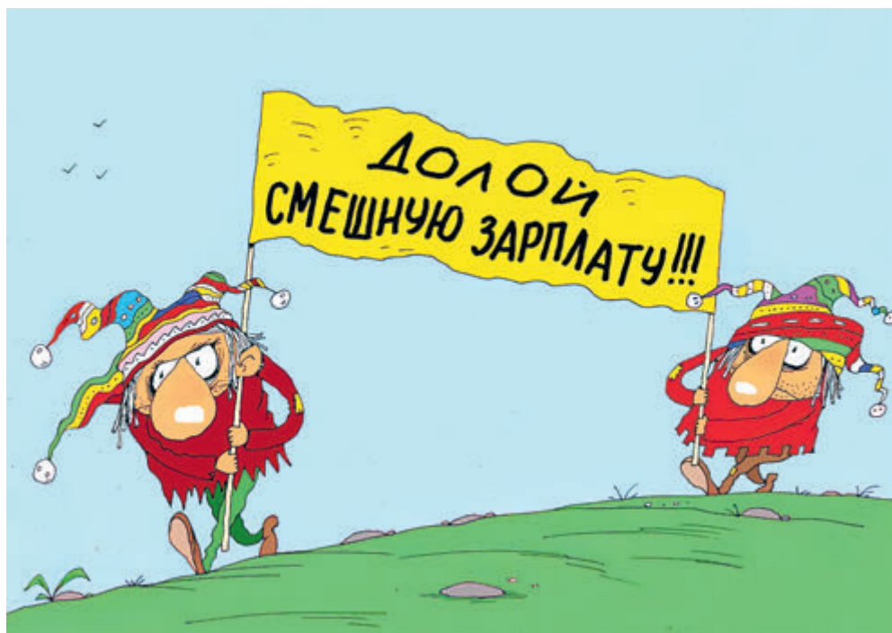
ИЛЛЮСТРАЦИЯ СЕРГИЯ САНДИНА

Учтем, что госслужащих в стране 2,4 млн человек, а в Минтруде уточнили, что нынешнее решение об индексации распространяется и на сотрудников, которые не имеют статуса госслужащих, в том числе на стенографистов, экспедиторов, кассиров и представителей других профессий. Таким образом государство борется с сокращением реальных доходов населения, комментируют эксперты.