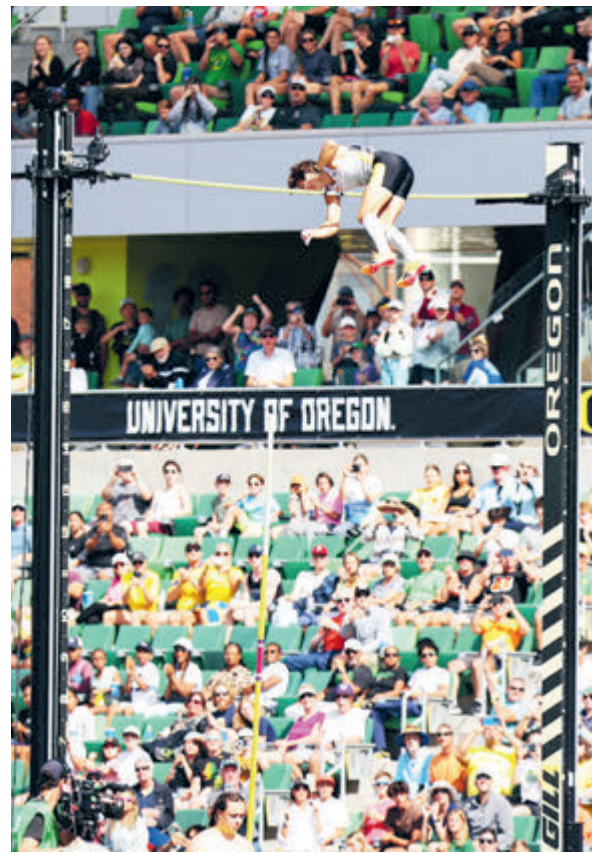
Арман Дюплантис добавляет к своим рекордам по сантиметру. А куда ему спешить?

Сейчас кое-кто, сравнивая уровень результатов в мире и в России, начинает кричать об отсутствии у нас перспектив. Но давайте вспомним чемпионат мира в Катаре-2019. Была похожая ситуация, но наши ребята, даже приехав в нейтральном статусе малочисленным и не самым оптимальным составом, завоевали две золотые медали, три серебряные и бронзовую. Заранее хоронить российскую легкую атлетку не следует. Уверен: когда удастся период изоляции прервать и выступать хотя бы в нейтральном статусе, в ряде дисциплин наши легкоатлеты не затеряются. ■