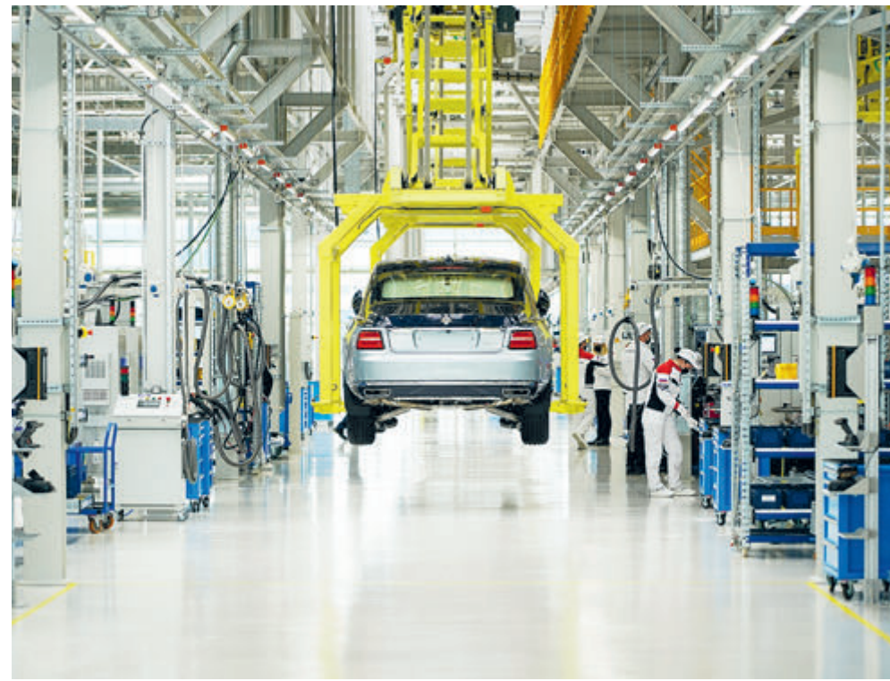
Лабура. Aurus Senat в сборочном цехе. Кому он достанется?

Сейчас средняя цена одного лота госзакупок по этой категории товара составляет 13,7 млн рублей. Зато гендиректор Авто-