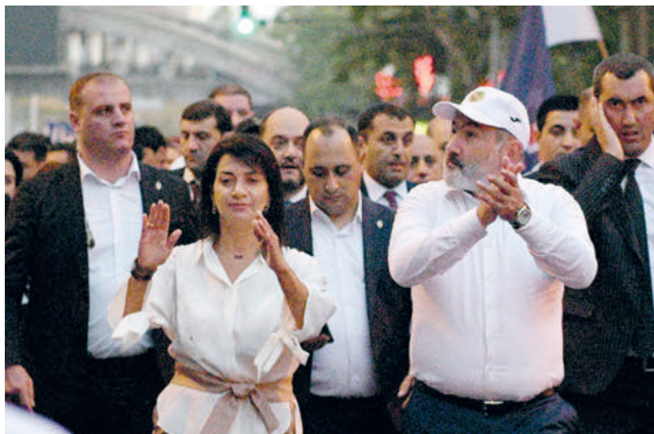
Никол Пашинян с супругой. Ничто не предвещает...

Как подчеркнула The Guardian, обе стороны заявили, что соглашение было