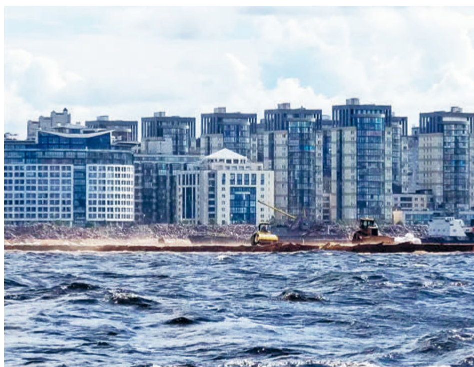
Все моют и моют...

Несколько многочасовых заседаний в суде, жаркие дебаты между истцами, ответчиками, рассмотрение ходатайств, запросы экспертиз, расхождения меж-