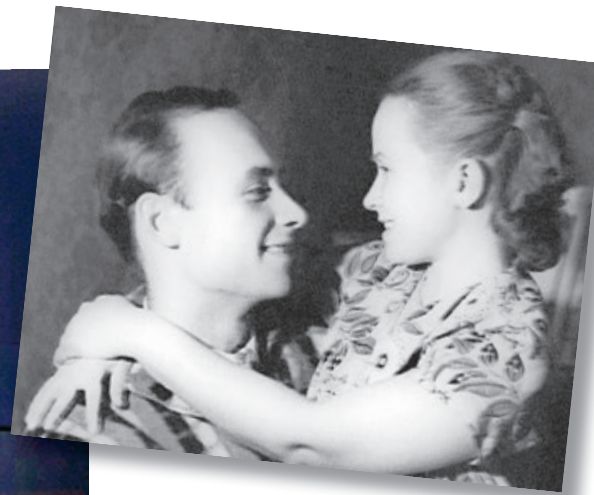
Пахмутова и Добронравов в день свадьбы.

ны уходят»... Может, тогда и не дошло бы до многих роковых пределов, за которыми стали неизбежными «невойны» XX и XXI веков, включая нынешнюю. А ведь кроме песен у Николая Николаевича много «просто» стихов, не менее пронзительных, чем подхваченные великими композиторами. Есть среди них такие, что жгут сердце, задавая тяжкие вопросы. Они написаны на обломках былой страны, но так много говорят и о нас сегодняшних.