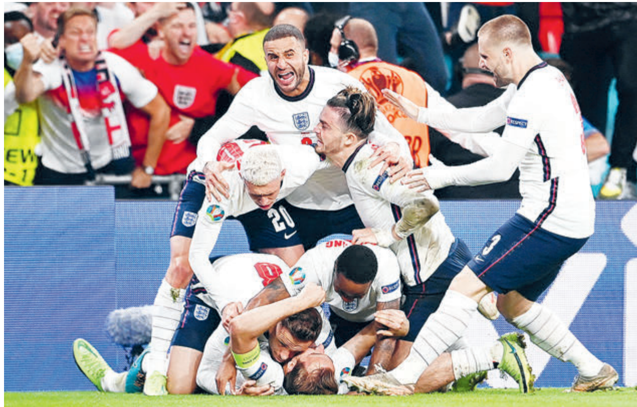
Родоначальники футбола предвкушают первую в истории победу на Евро. Осталось только узнать, что думают по этому поводу итальянцы...

Да, эта нехитрая мысль – «других футболистов у нас для вас нет!» – повторяется снова и снова. И в волне