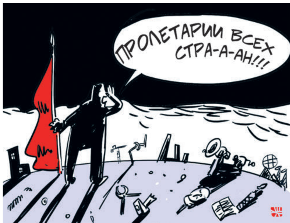
ИЛЛЮСТРАЦИЯ АЛЕКСЕЯ ЮРЬЕВА/ARTOFBANK.RU

Ограничения вступают в силу через три месяца, за которые работодатели должны произвести изменения в штатном расписании, то есть избавиться от гастарбайтеров. А еще через год правительство региона, в зависимости от ситуации на рынке труда, примет решение о продлении или прекращении запрета.