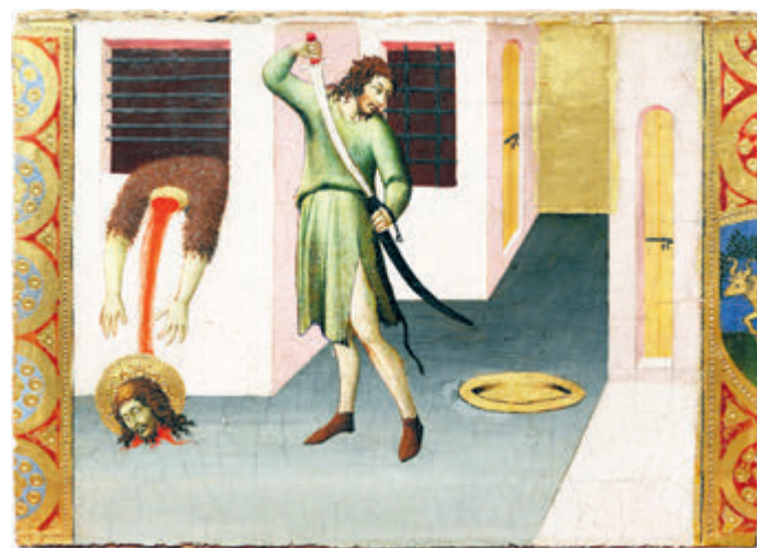
Искусство Сиены – мостик между восточной иконой и западной живописью.

не осталось в музее от дара коллекционера Щекина. Но поражает уже то, что осталось